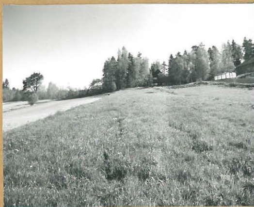
68680 Lohja, Osuniemi, Koivuhaho. Lohja 354. Kivikautinen asuinpaikka. Asuinpaikka vasemmalla kynniöspellon yläreunassa. Kur. lounaasta. Tommi Vuorinen 1986.