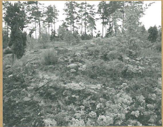
68682 Karjaa, Bällby, Övergård. Karjaa 380. Pronssikaikainen röykkiö. Kuvattu etelästä. Tommi Vuoninen 1986.