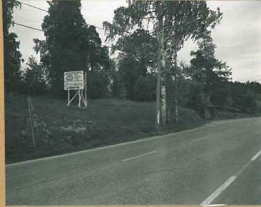
68693 Lohja, Hiitti, Karhumäki. Lohja 329. Rautakautinen röykkiö. Kuvattu lounaasta. Tommi Vuorinen 1986

Lohja, Kargjalahja, Kargjan t.n.v. 1986 T. Vuorinen