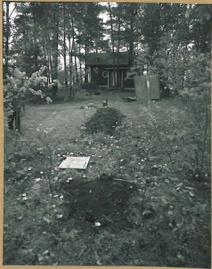
68697 Lohja, Vohloinen, Virmonsaari, Lohja 333. Kivikautinen asuinpaikka. Kuvattu etelästä. Tommi Vuorinen 1986