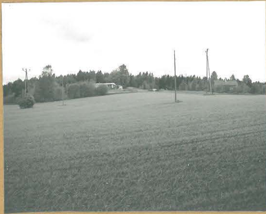
68685 Karjaa, Mjölmarby. Skräddarsbacke. Karjaa 376. Kivikaikainen asuinpaikka. Kuv. etelästä. Tommi Vuoninen 1986.

Lohja, Karjalohja Karjaa Inv. 1986 T. Vuoninen