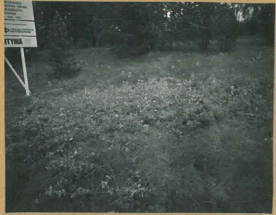
68692 Lohja, Hiitti, Karhumäki, Lohja 329. Rautakautinen röykkiö. Kuvattu kaakosta. Tommi Vuorinen 1986