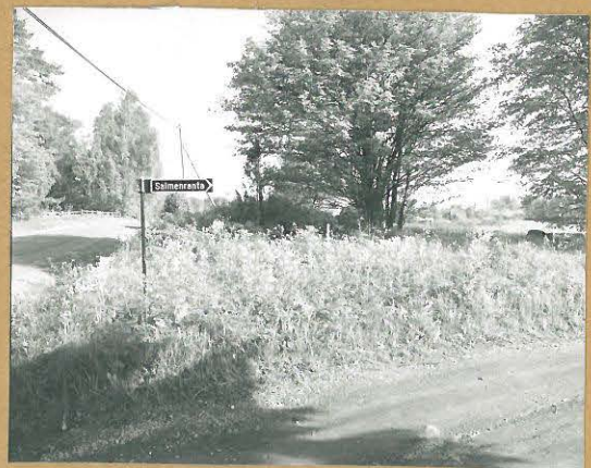
68688 Lohja, Paavola, Toivari. Lohja 341. Röykkiö n:o 2 Salmen- rannan hienhaerassa. Röykkiö kuvan keskellä oleran katajan kohdalla. Kuv. kaakosta. Tommi Vuorinen 1986