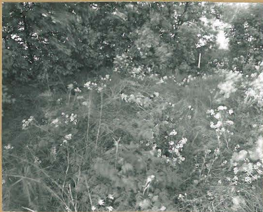
68686 Lohja, Paavola, Toivari. Lohja 341. Röykkiö n:o 1 kuvattuna pohjoisesta. Tommi Vuorinen 1986