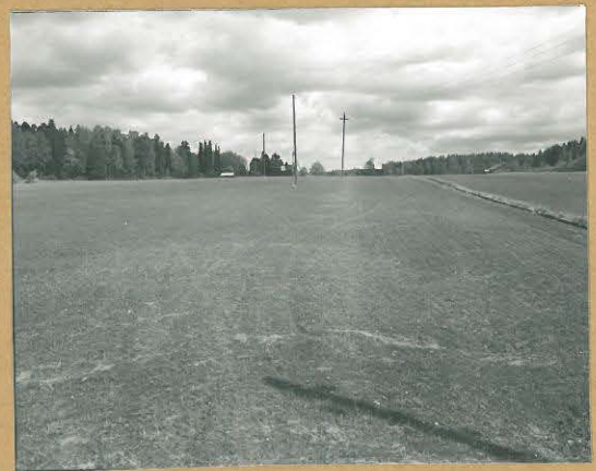
68684 Karjaa, Mjölmarby, Timpa 2. Karkaa 373. Kivikautinen asuinpaikka. vrt. edellinen kuva. Kur. lounaasta. Tommi Vuorinen 1986.