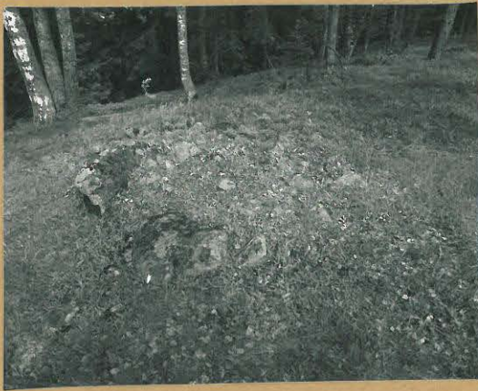
68690 Lohja, Piispala, Keinumäki. Lohja 364. Röykkiö n:o 1. Kur. etelästä. Tommi Vuorinen 1986.