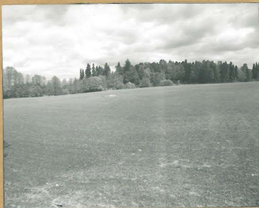
68683 Karjaa, Mjölmarby, Timpa 1. Karjaa 372. Kivikautinen asuinpaikka. Kur. etelästä. Tommi Vuorinen 1986.