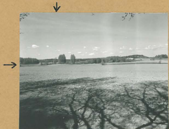
68681 Lohja, Osuniemi, Peltoniemi Lohja 355. Kivikautinen asuinpaikka. Asuinpaikka pienellä peltokammulla nuohien osoittamassa kohdassa. Kur. koillirestä. Tommi Vuorinen 1986.