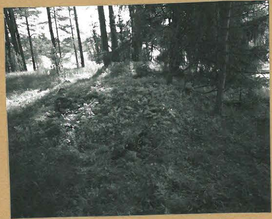
68689 Lohja, Piispala, Keinumäki. Lohja 364. Röykkiö n:o 2. Kur. luoteesta. Tommi Vuorinen 1986.