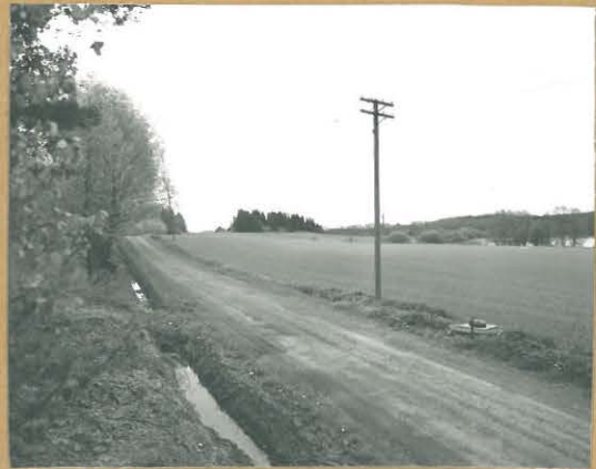
68678 Lohja, Osuniemi, Pohjan- pirtti. Lohja 348. Kivikautinen asuinpaikka. Kurattu luoteesta. Tommi Vuorinen 1986