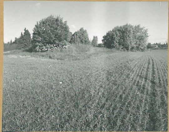
68687 Lohja, Paavola, Kovalan- niemi, Lohja 340. Kivikautinen asuinpaikka. Kuv. kaakosta. Puiden takana rautakautinen röykkiö. Lohja, Paavola, Toivari, Lohja 341. Tommi Vuorinen 1986