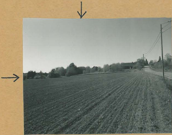
68684 Lohja, Vappula, Vappulan- lanti. Lohja 356. Kivikautinen asuinpaikka. Asuinpaikka pellolla nuolien oroitamassa kohdassa. Kur. kaakosta. Tommi Vuorinen 1986.

Lohja, Kargalohja Karjaa Inv. 1986 T. Vuorinen