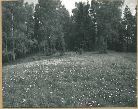
68691 Lohja, Piispala, Keinumäki. Lohja 364. Rautakautinen röykkiö + kalmisto (?). Yleiskuva. Kur. lounaasta. Tommi Vuorinen 1986.