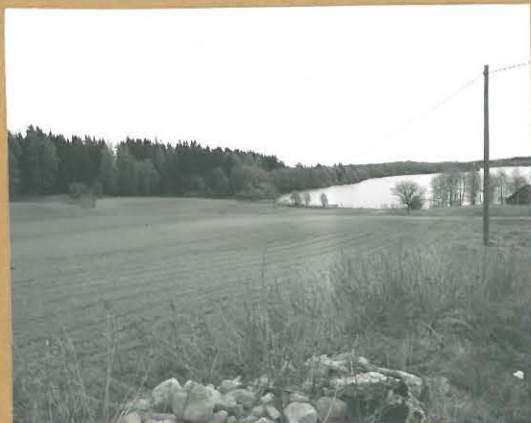
68679 Lohja, Osuniemi, Pensaari 1 ja 2. Lohja B50 ja 351. Kivi- kautisia asuinpaikkoja. Pensaari 1 pellolla vasemmalla metsän reunaan, Pensaari 2 pellolla aivan kuvan etualalla. Kur. luoteesta. Tommi Vuorinen 1986