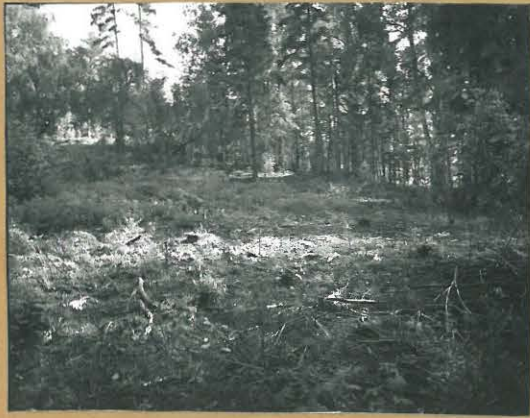
68695 Lohja, Ahtiala, Salmensuu. Lohja 347. Kivikautinen asuinpaikka. Kur. lounaasta. Tommi Vuorinen 1986

Lohja, Karjalohja Kargaa Inv. 1986 T. Vuorinen