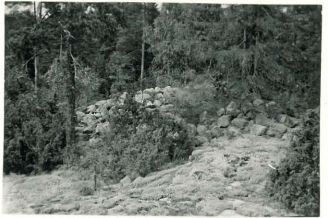
25279 Vajarainen, Vuorelan vare Mj: 46