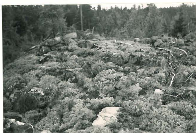
25260 Vasarainen, Uudentalon 5. vare Mj. 35