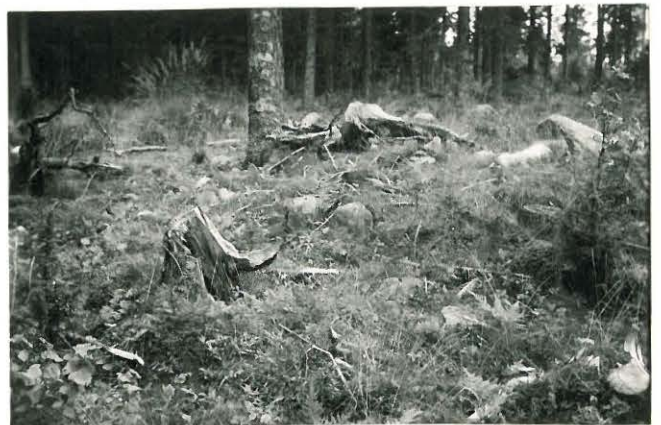
25291 Vermunttila, Laurikkalan Mj: 55 8. kumpu