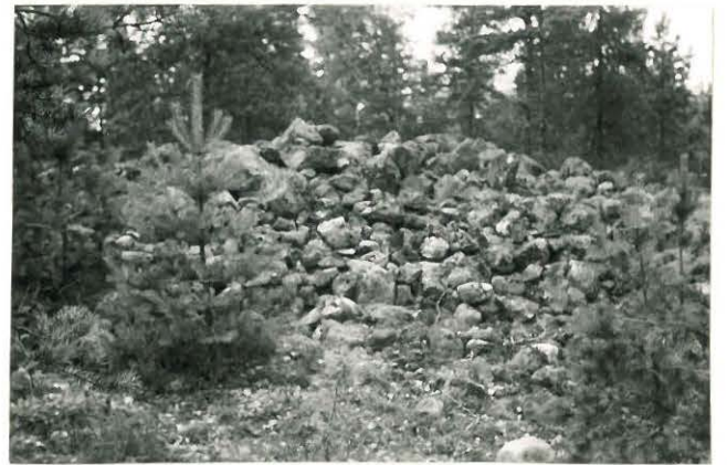
25241 Soukainen, Virtaniemen 2. vare Mj. 29