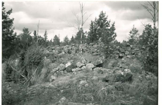
25283 Vermuntila, Ritakallion vareet Mj: 50