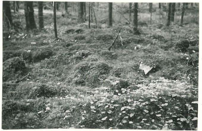
25293 Vermuntila, Laurikkalan Mj: 56 3. kumpu