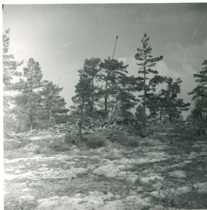
25205 Kolla, Tuitinvuoren vareet Mj. 13 lounaasta