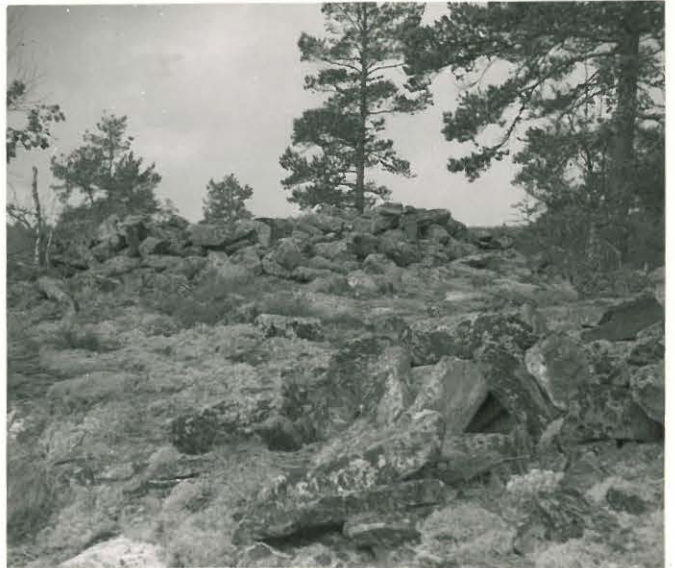
25209 Kolla, Tuittivuoren itäosa Mj. 13 Vareen eteläkulmasta läntiseen vare