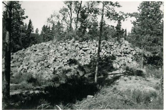
25223 Kolla, Hongisto, pohjoinen Mj. 20 vare