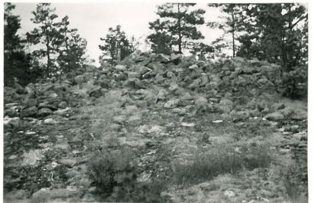
25233 Soukainen, Varustanvuoren vare Mj. 25