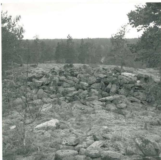
25207 Kuin edellä Mj. 13

Mj. 11 ja 12 Kerttu Ikonen 1961 Mj. 13 M. Linkola 1960