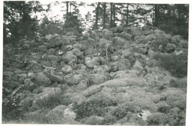
25287 Vermunttila, Pihalan Mj: 52 3. vare