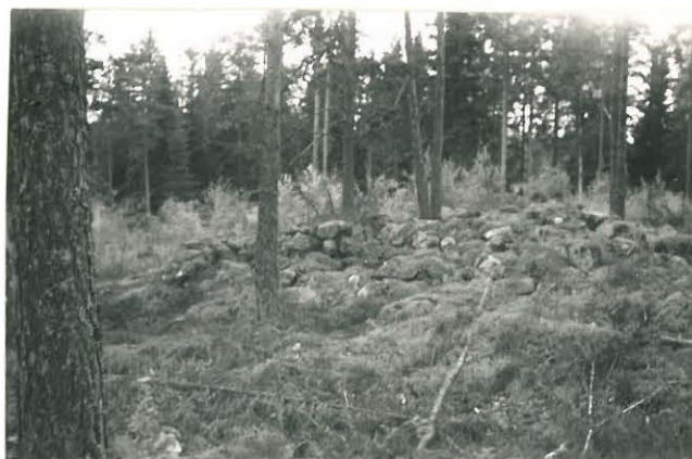
25251 Vasarainen, kouluilan läntinen vare Mj: 32