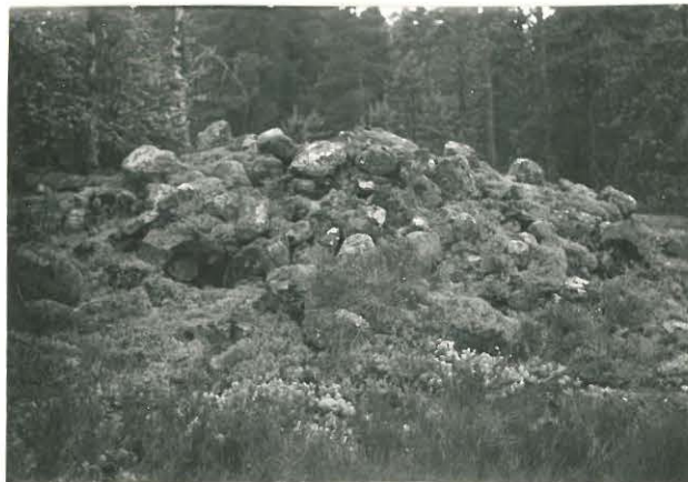
25201 Nihattula, Pruukinkallion kallion vare Mj. 11