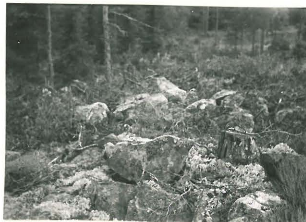
25249 Vasarainen, Paavolan vare Mj: 31