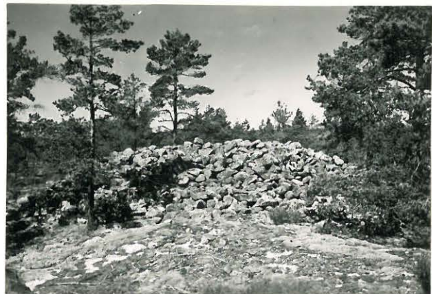
25217 Kolla, Kaupinvuori läntinen vare Mj. 18