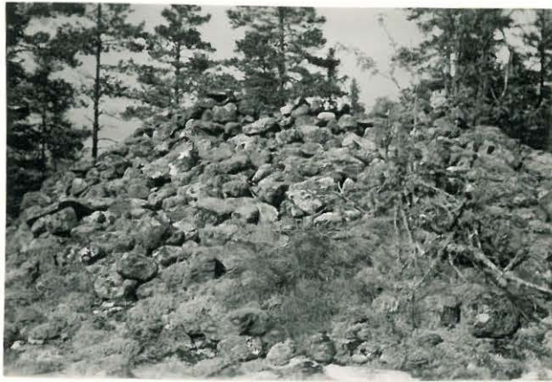
25238 Soukainen, Soukaisten eteläinen vare Mj. 28