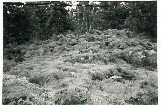
25285 Vermuntila, Pihalan 1. vare Mj: 52