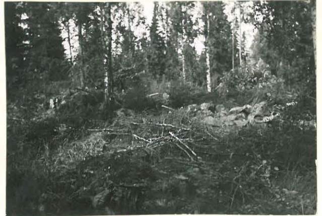
25183 Sorkkan Uolan vare idästä Mj. 1