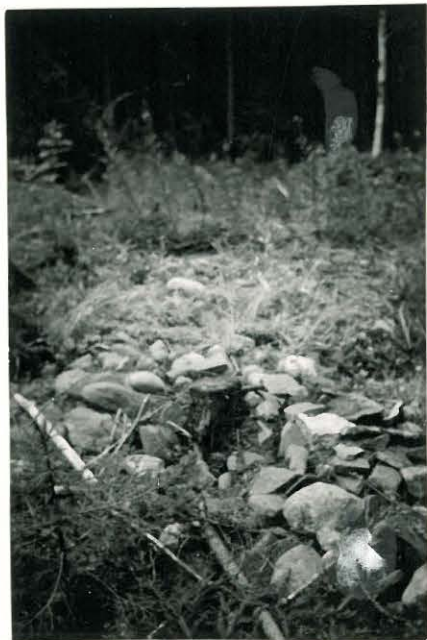
25290 Vermunttila, Mj: 55 Laurikkalan 1. kumpu