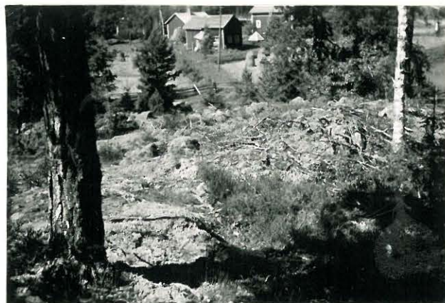
25220 Kolla, Hongiston 3. vare Mj. 19