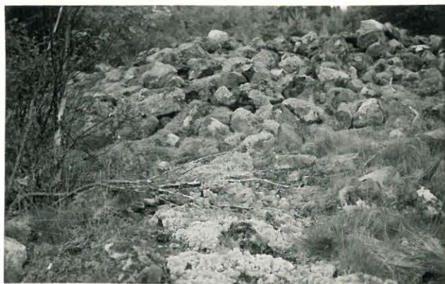
25273 Vasarainen, Hannulan vare Mj: 42