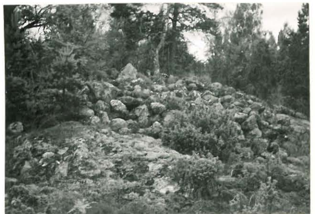
25213 Kolla, Kartanon Ruukinmaan vare Mj. 15