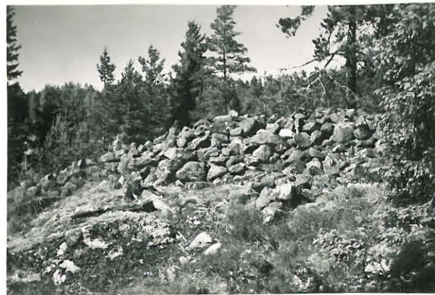
25221 Kolla, Hongiston 2. vare Mj. 19