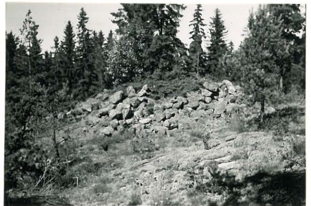
25225 Kolla, Hongisto, eteläinen vare Mj. 20