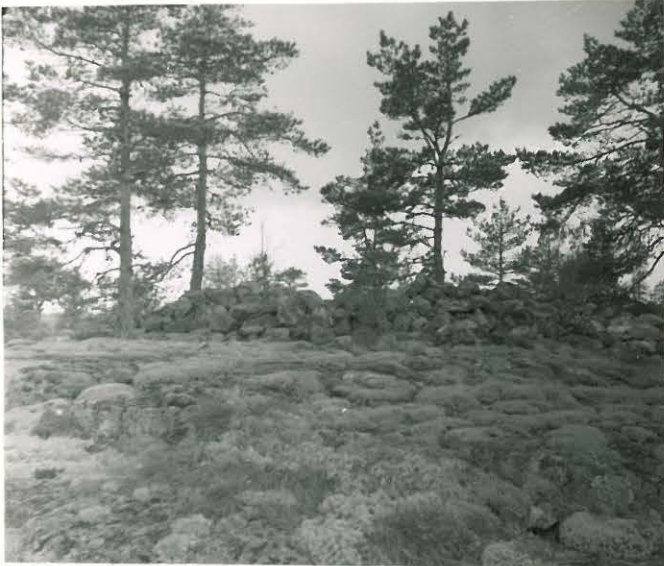
25208 Kolla, Tuittivuoren itäosa Mj. 13 Vare koillisesta