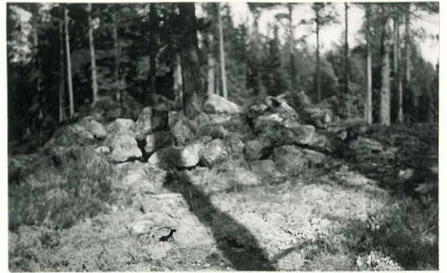
25190 Uotila, Matinkaan pohjoisen vare Mj. 4