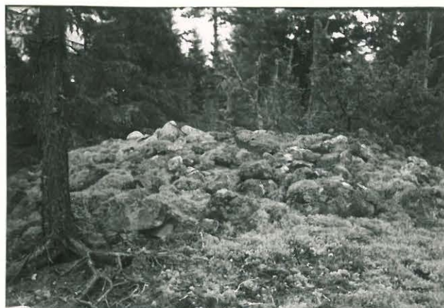
25203 Nihattula, Hanolainnityn Mj. 12 vare