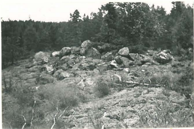
25262 Vasarainen, Kylänpään Mj. 36 1. vare