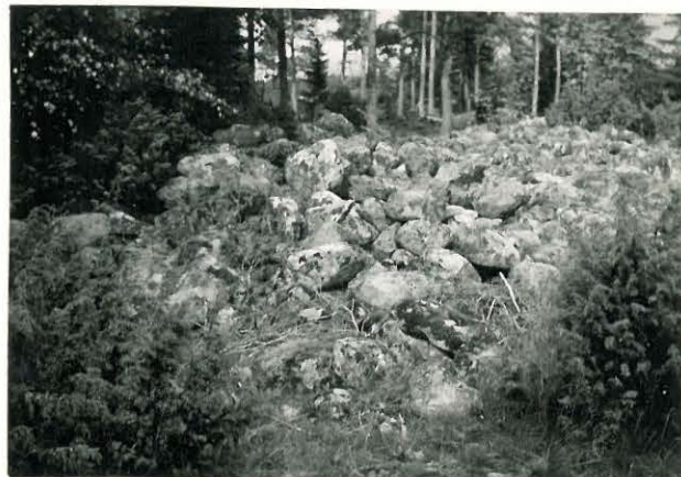
25197 Nihattula, Kaskiston Ruhivainion kivikkoa Mj. 10