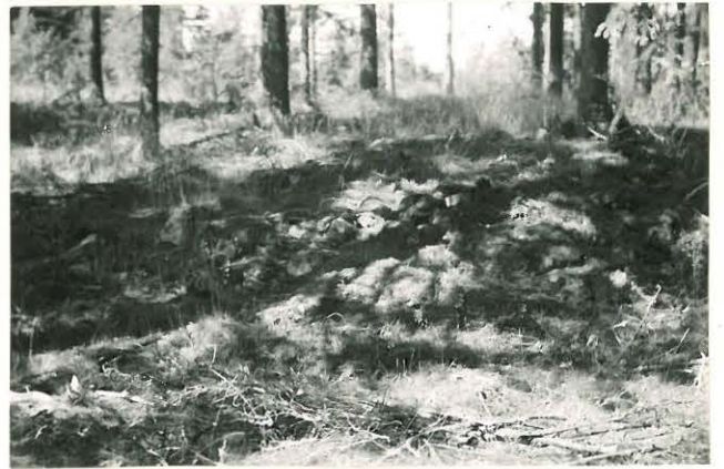
25295 Vermuntila, Lavin 6. Mj: 57 kumpu