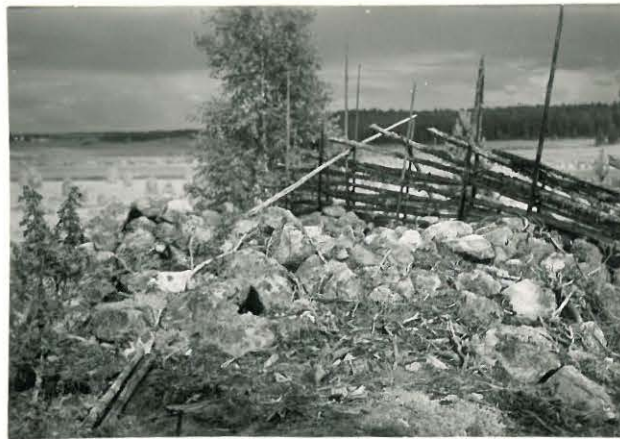
25199 Nihattula, Kaskiston Rūhi- vainion eteläinen vare Mj. 10