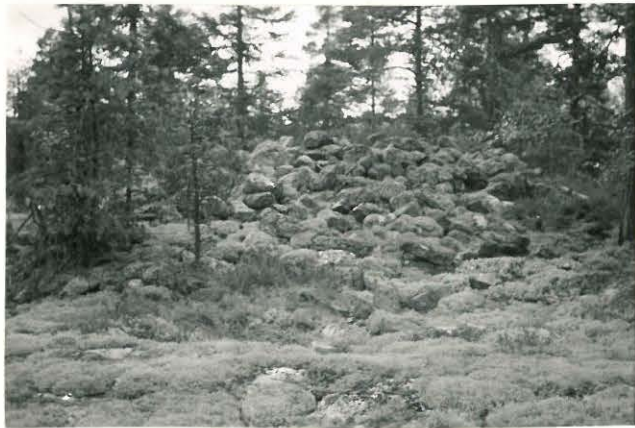
25288 Vermunttila, Eerolan vare Mj: 53