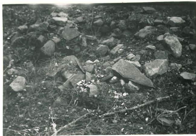
25298 Vermuntila, Kurkisuon Mj: 60 3. kumpu