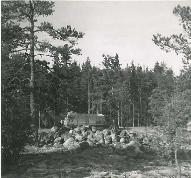
25187 Uotila, vare idästä Mj. 3