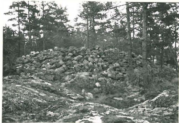
25195 Nihattula, Retkenuoren vare Mj. 8