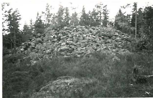
25275 Vasarainen, Aron eteläinen vare Mj: 43