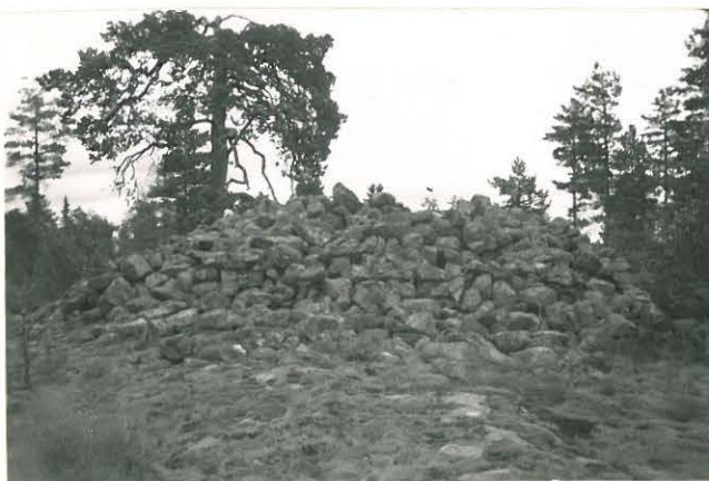
25284 Vermuntila, Ritakallion vare Mj: 51