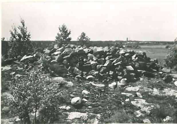
25185 Uotila, Isonvuoren vare idästä Mj. 2