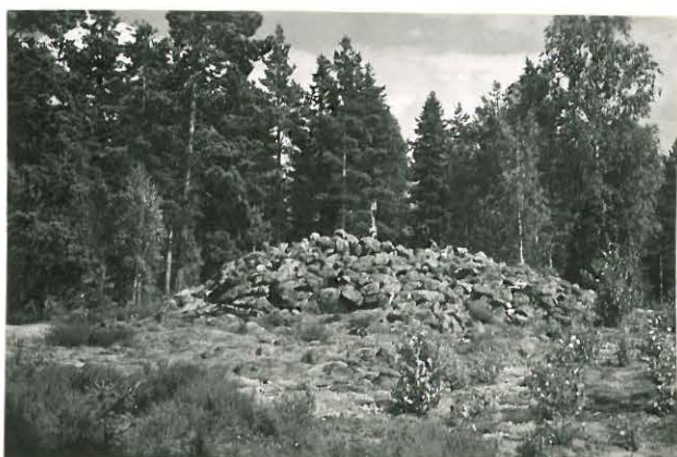
25228 Kolla, Rapajärven vare 1. Mj. 23