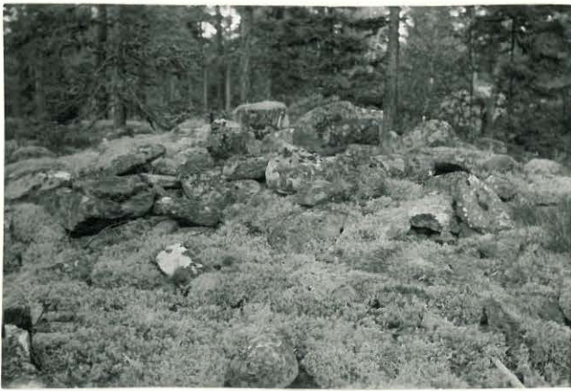
25286 Vermunttila, Pihalan Mj: 52 2. vare