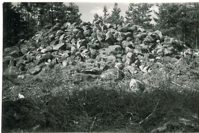
25265 Vasarainen, Nontalon vare Mj. 37