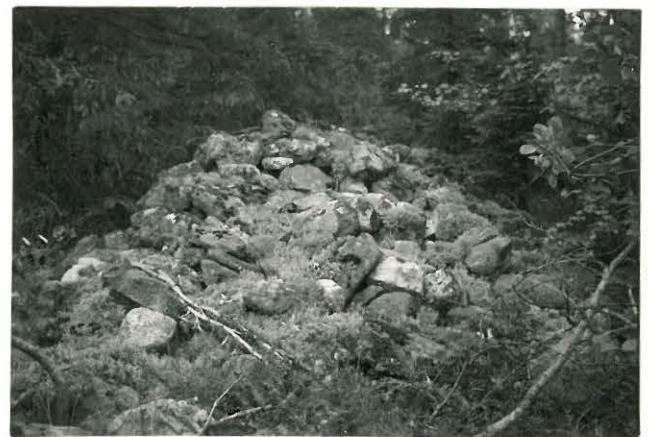
25245 Soukainen, Ruoholan 2. vare Mj. 30