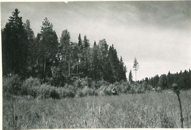
25182 Sorkka, Uola, Hieten- vareen kallio Mj. 1