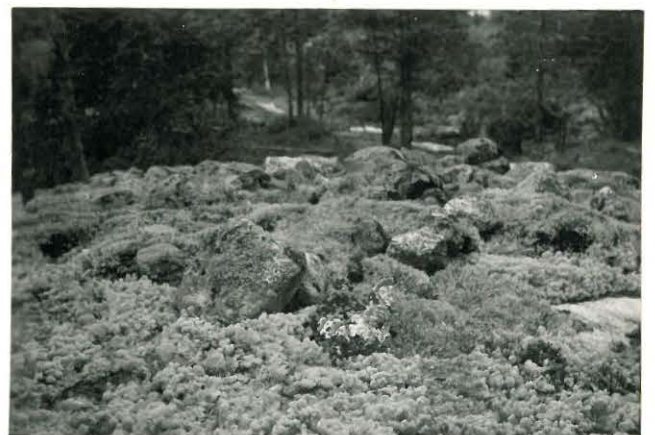
25243 Soukainen, Virtaniemen 4. vare Mj. 29