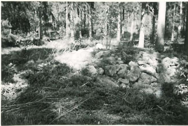
25294 Vermuntila, Lavin Mj: 57 4. kumpu