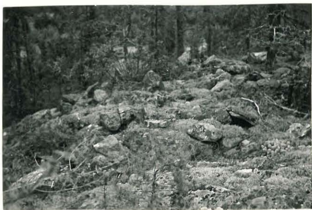
25264 Vasarainen, kylänpään Mj. 36 3. vare