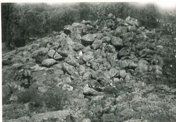
25216 Kollan Kuusiston vare Mj. 17