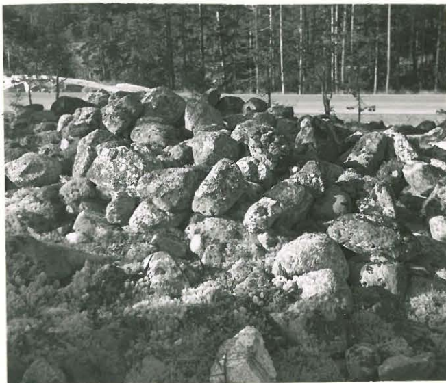
25189 Uotila, vare idästä Mj. 3