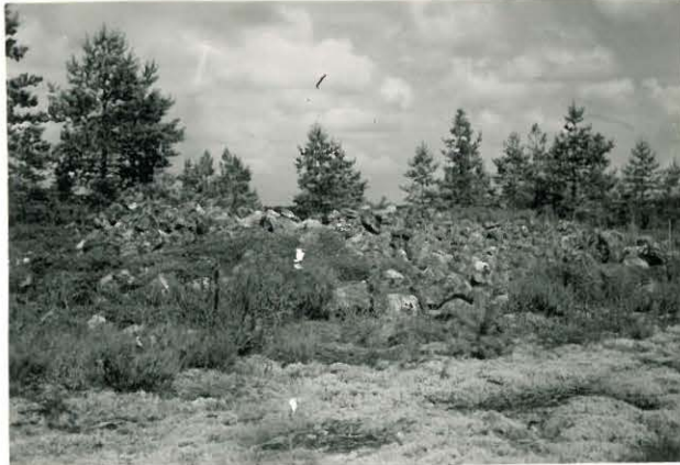
25234 Soukainen, Varustanvuoren kivikko Mj. 25