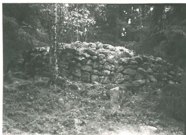
25277 Vasarainen, Heleksen vare Mj: 45