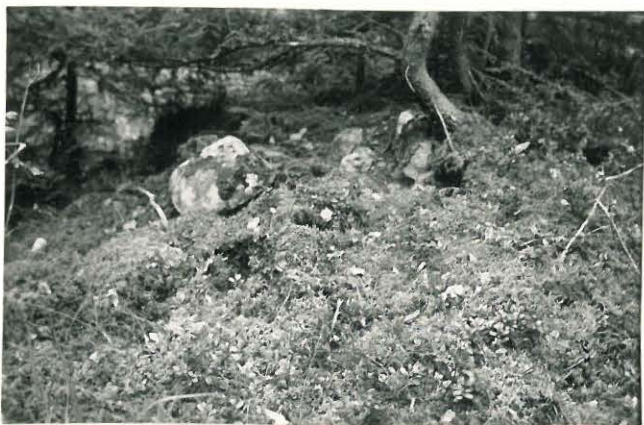
25246 Soukainen, Ruoholan 3. vare Mj: 30