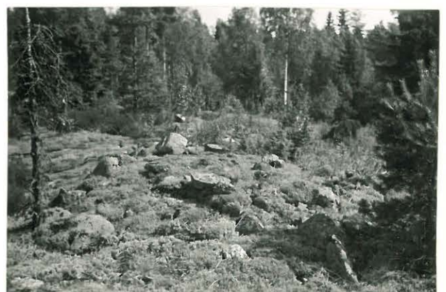
25229 Kolla, Rapajärven vare 2 Mj. 23