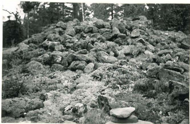
25248 Soukainen, Ruoholan 5. vare Mj: 30