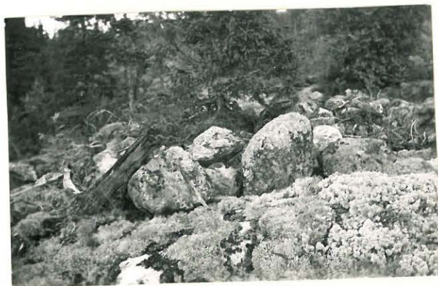
25261 Vasarainen, Uudentalon 6. vare Mj. 35