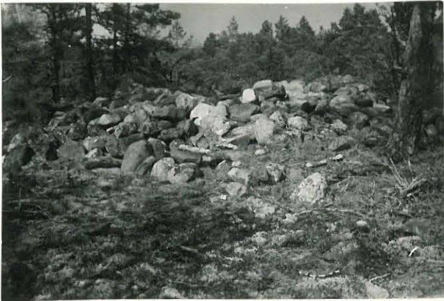
25280 Kulamaa, Pinaron vare Mj: 48