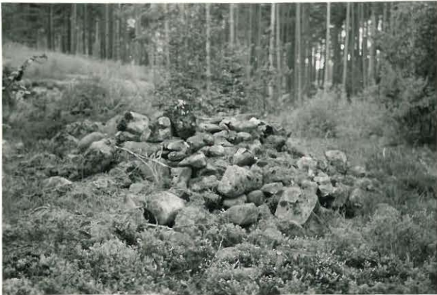
25232 Unaja, Männikön läntinen vare Mj. 24