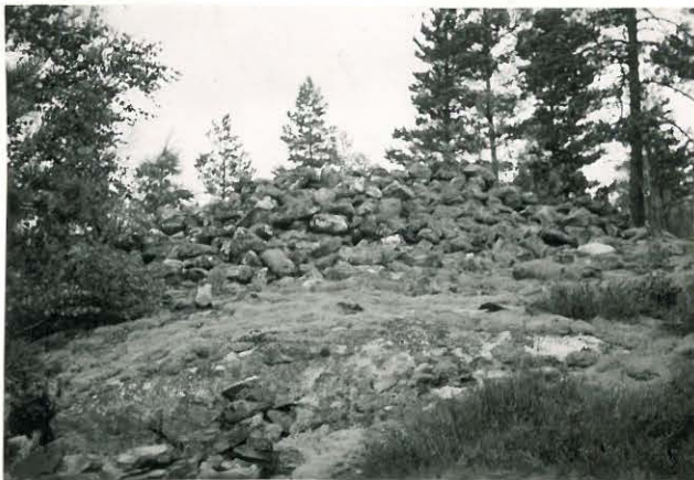
25240 Soukainen, Virtaniemen 1. vare Mj. 29