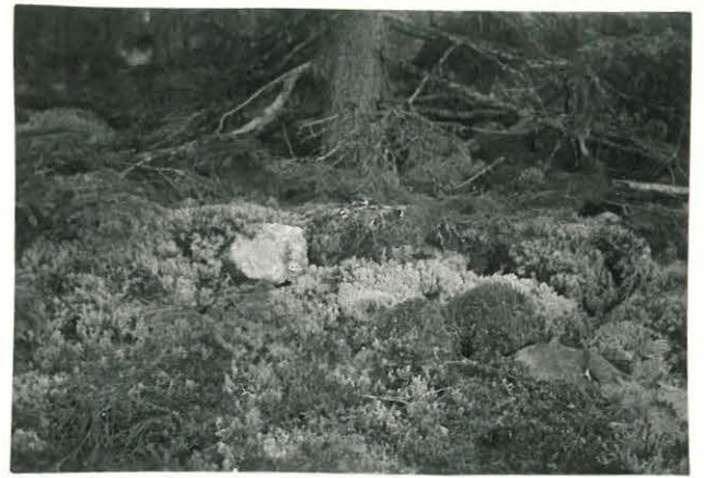
25239 Soukainen, Soukaisten pohjoinen vare Mj. 28