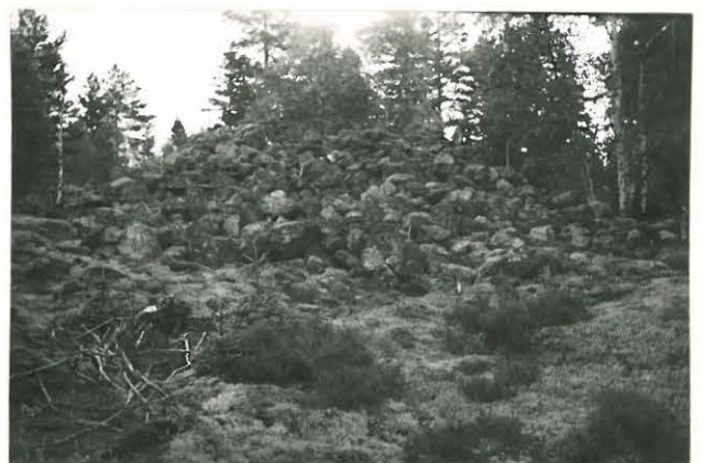
25227 Kolla, Rapajärven vare Mj. 22