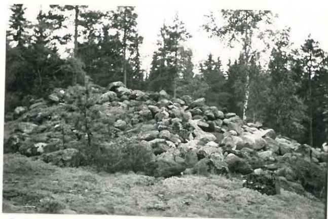
25247 Soukainen, Ruoholan 4. vare Mj: 30