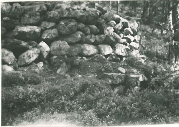
25278 Vajarainen, Hellenhon varen reunaa Mj: 45