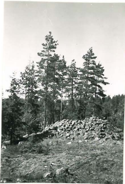
25222 Kolla, Hongiston Mj. 19 1. vare