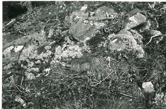
25253 Vasarainen, Laurin luoteinen vare Mj: 33