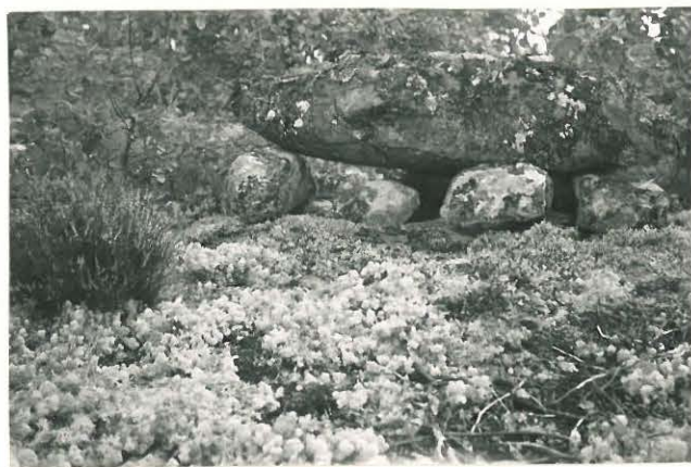
25253 Vasarainen Laurin kiviasetelma Mj. 34