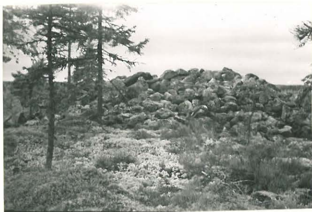
25256 Vasarainen, Uudentalon 1. vare Mj. 35