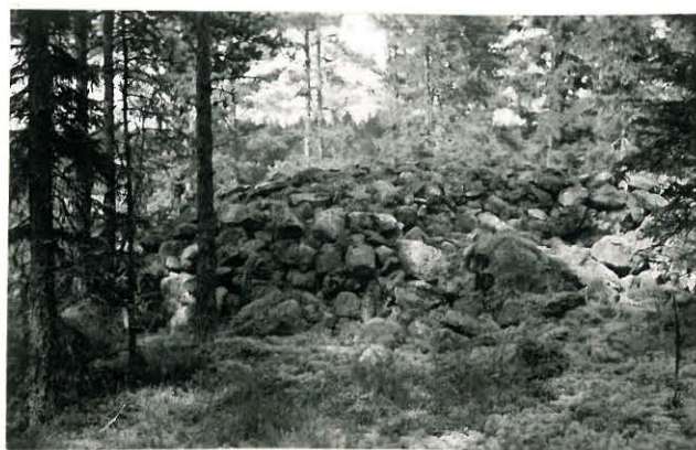
25269 Vasarainen, Kylänpään Mj. 40 vare