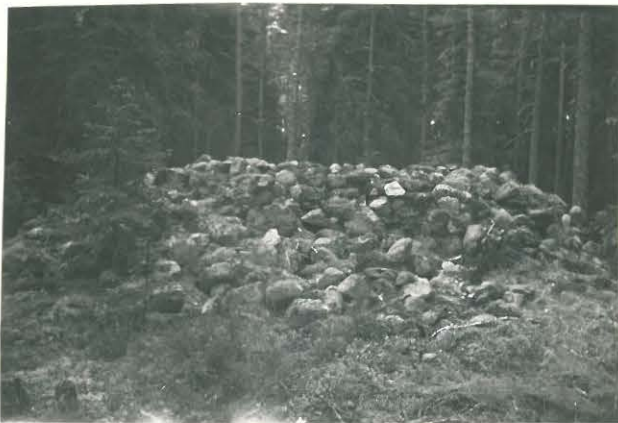
25214 Kolla, Kuusisto, pohjoinen vare Mj. 16