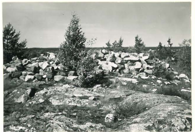
25186 Uotila, Isonvuoren vare pohjoisesta Mj. 2