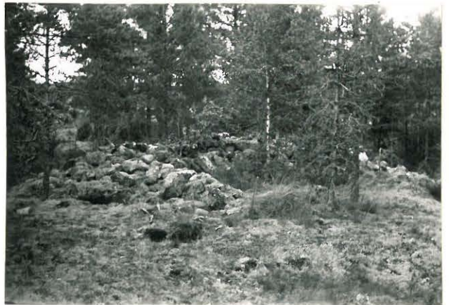
25211 Kolla, Kartanon luseinon vare Mj. 14