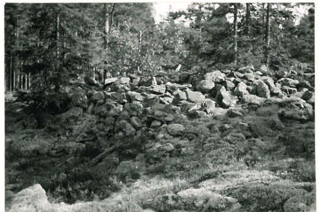
25235 Soukainen, Kotometsän vare Mj. 26