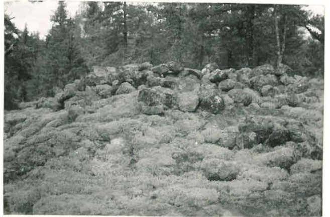
25281 Kulamaa, Tarnalhon läntinen vare Mj: 49