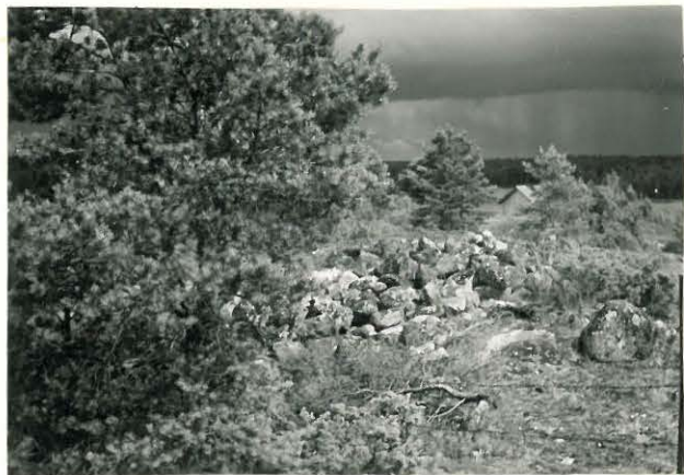
25196 Nihattula, Kaskiston Mylly- kallion vare Mj. 9