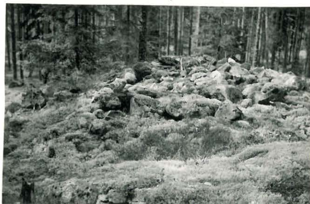
25267 Vasarainen, Kestilän lounainen vare Mj. 38