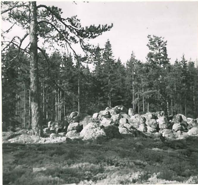
25188 Uotila, vare koillisesta Mj. 3