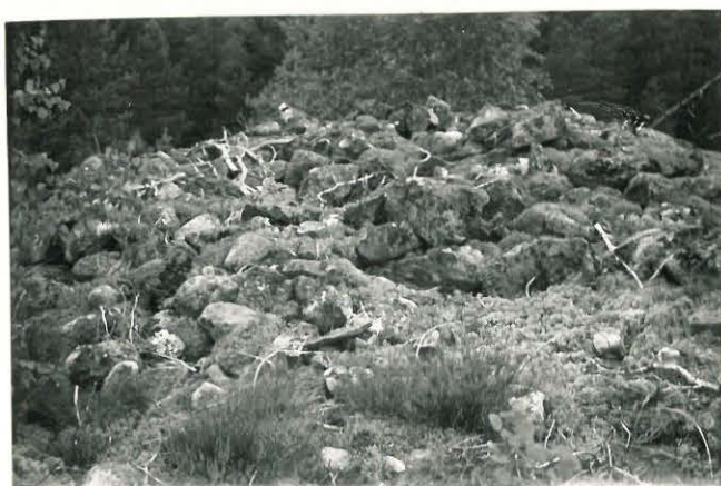
25258 Vasarainen, Uudentalon 3. vare Mj. 35