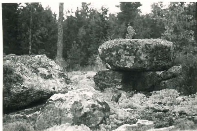
25254 Vasarainen, Laurin kiviasetelma Mj. 34