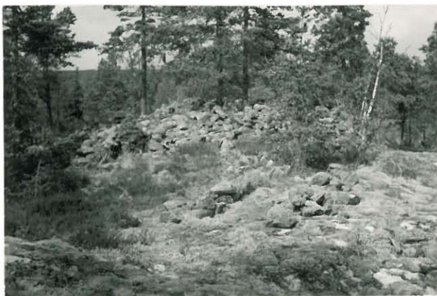
25236 Soukainen, Rehelmä Mj. 27 vare ja sille johtava tiekatumus →