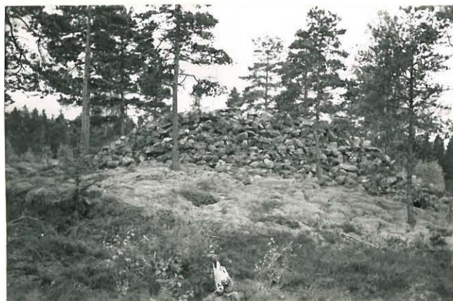
25257 Vasarainen, Uudentalon 2. vare Mj. 35