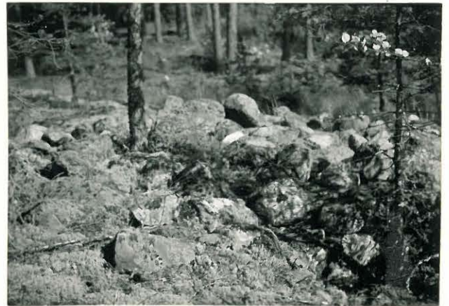
25191 Uotila, Matinkaan eteläisen vare Mj. 4