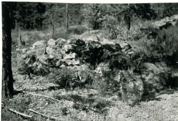
25224 Kolla, Hongisto, keskimäinen vare Mj. 20