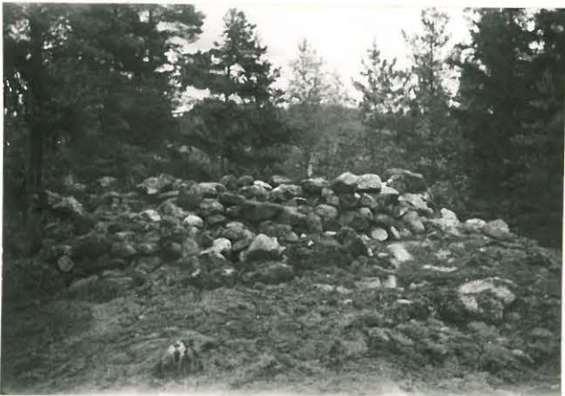
25210 Kolla, Kartanon kaakkinen vare Mj. 14