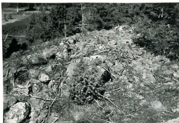
25219 Kolla, Hongiston 4. vare Mj. 19