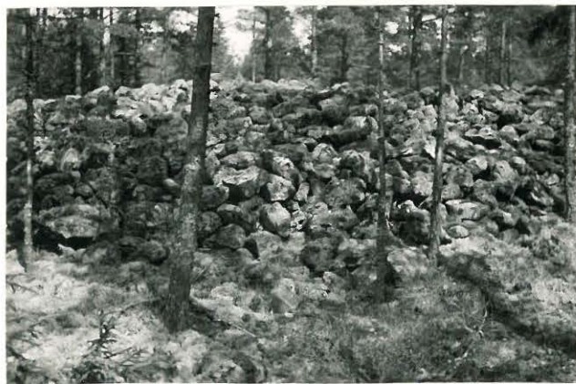
25266 Vasarainen, Kestilän kestilinen vare Mj. 38