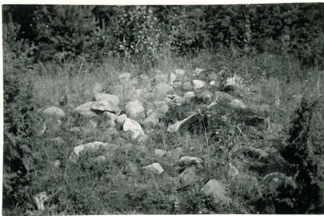
25296 Vermuntila, Lavin 1. kumpu Mj: 58