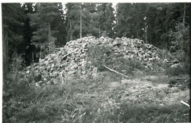
25274 Vasarainen, Aron pohjoinen vare Mj: 43