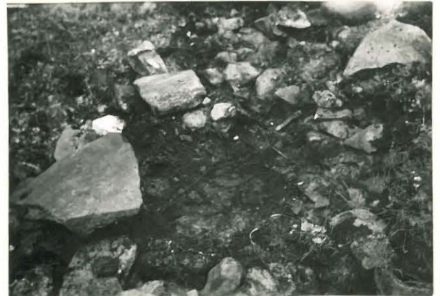
25192 Uotila, Matinkaan kumpu Mj. 5