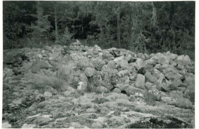
25231 Unaja, Männikön itäinen vare Mj. 24