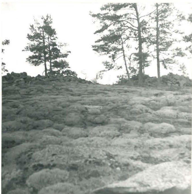
25204 Kolla, Tuitinvuoren vareet Mj. 13 pohjoisesta