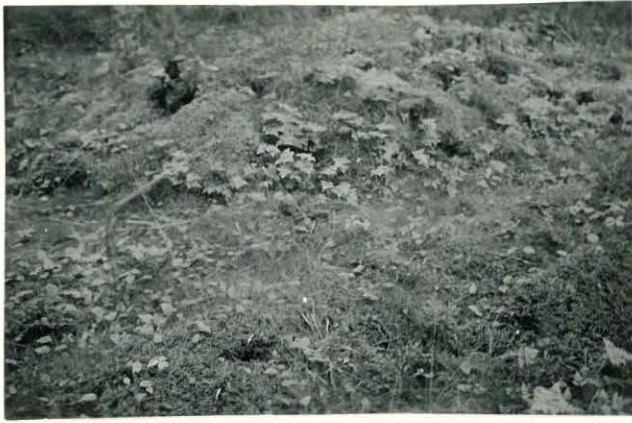
25292 Vermuntila, Laurikkalan Mj: 55 9. kumpu