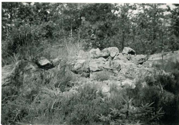
25244 Soukainen, Ruoholan 1. vare Mj. 30