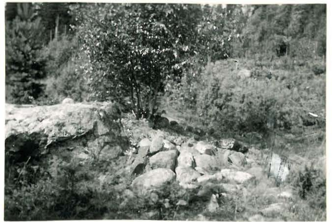
25297 Vermuntila, Lavin 4. Mj: 58 kumpu