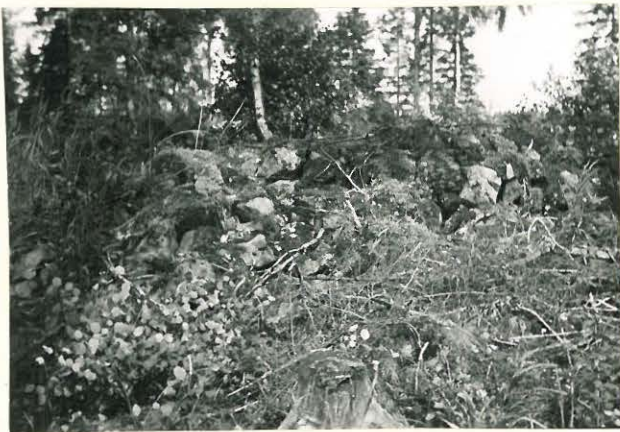
25184 Sorkkan Uolan vare etelästä Mj. 1