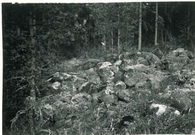
25202 Nihattula, Pruukinkallion Mj. 11 lounainen vare