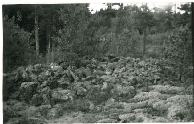
25276 Vasarainen, Aron vare Mj: 44