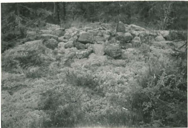
25282 Kulamaa, Tarnalhon itäinen vare Mj: 49