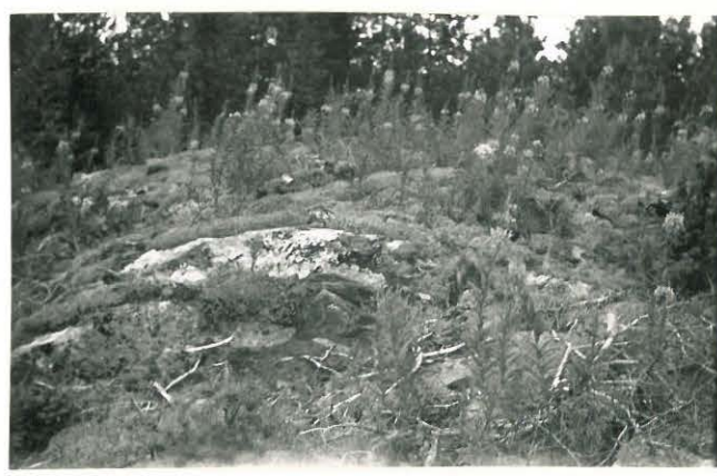
25259 Vasarainen, Uudentalon 4. vare Mj. 35