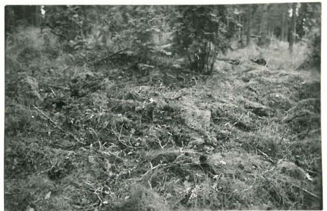
25289 Vermunttila, Kallion Mj: 54 kumpu