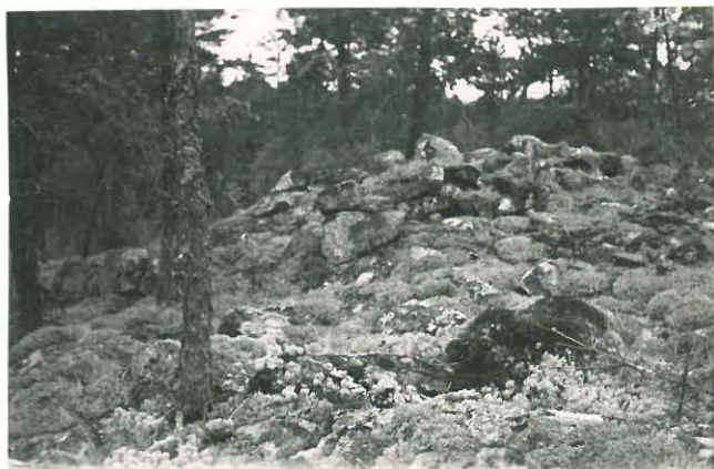
25263 Vasarainen, Kylänpään Mj. 36 2. vare