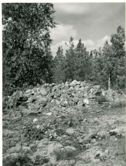
25268 Vasarainen, Mj. 39 Kestilän (Kylänpään) vare