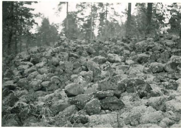
25194 Tarvola, Rajamaan vare Mj. 6