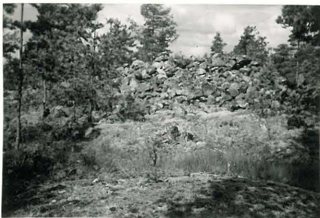
25270 Vasarainen, Hannulan pohjoinen vare Mj: 41