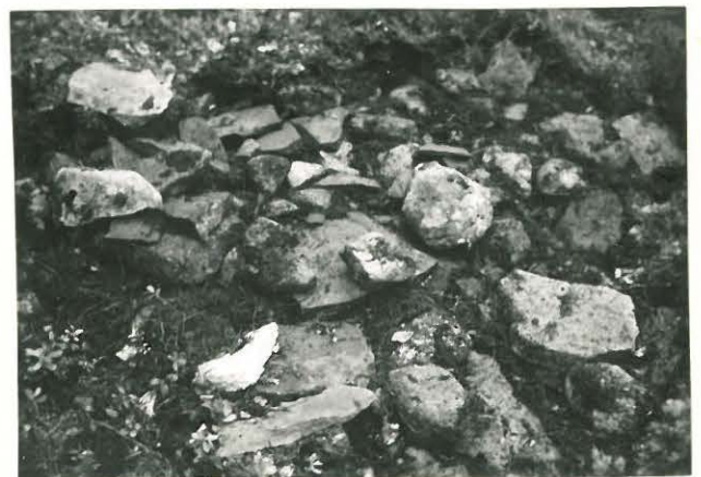
25193 Uotila, Matinkaan kumpu Mj. 5