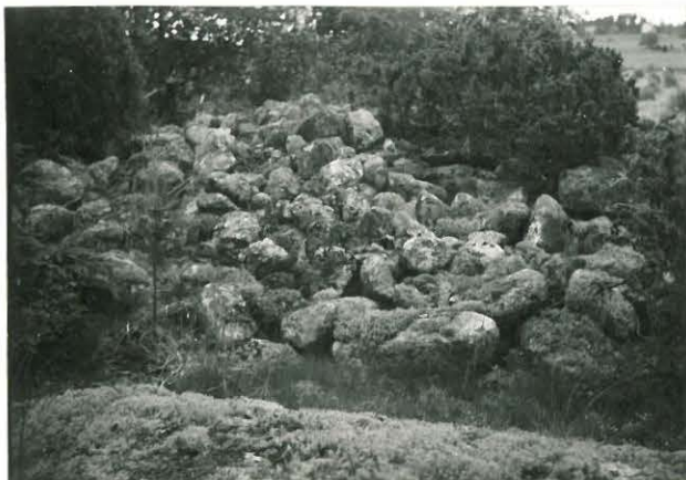
25212 Kolla, Kartanon pohjoisen vare Mj. 14