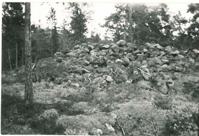
25250 Vasarainen, kouluilan itäinen vare Mj: 32