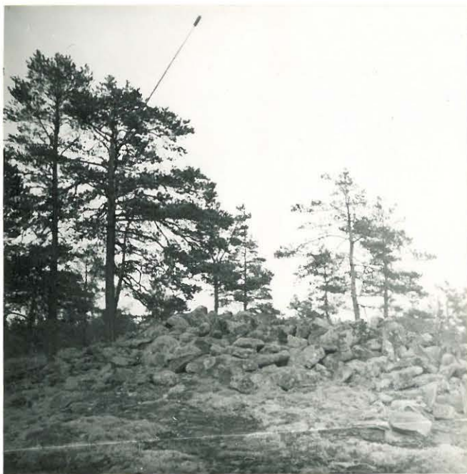
25206 Kolla, Tuitinvuoren länti- Mj. 13 nen vare länneestä