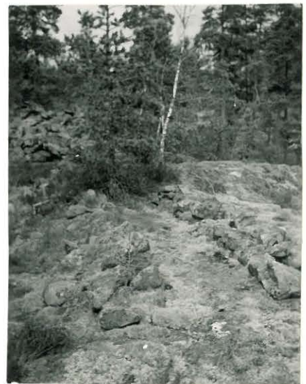
25237 Mj. 27