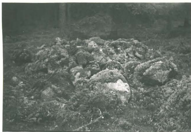
25215 Kolla, Kuusisto, eteläinen vare Mj. 16