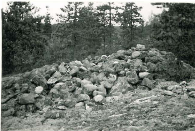
25242 Soukainen, Virtaniemen 3. vare Mj. 29