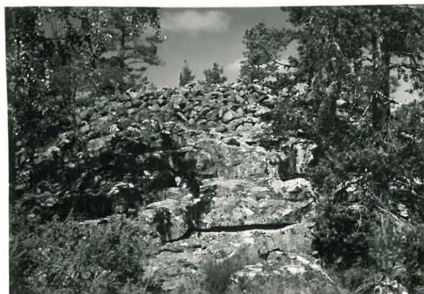
25218 Kolla, Kaupinvuori, itäinen vare Mj. 18