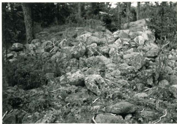
25198 Nihattula, Kaskiston Ruhivainion kivikkoa Mj. 10