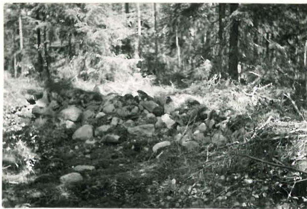
25226 Kolla, Harjun kiviröykkiö Mj. 21