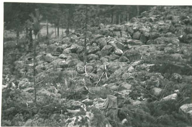
25271 Vasarainen, Hannulan pohjoinen vare Mj: 41