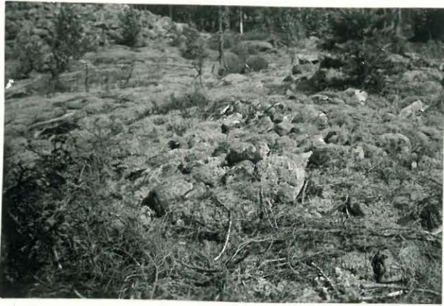
25230 Kolla, Rapajärven vare 3 Mj. 23