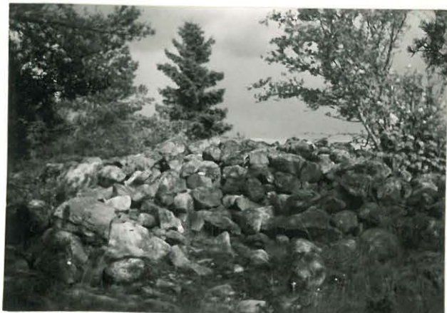
25200 Nihattula, Kaskiston Ruhivainion pohjainen vare Mj. 10