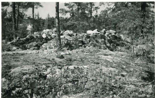
25272 Vasarainen, Hannulan eteläinen vare Mj: 41