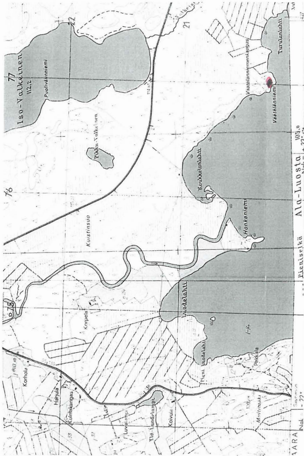
PERUSKARTTA 3234 11 + 4312 02 HANKAMÄKI