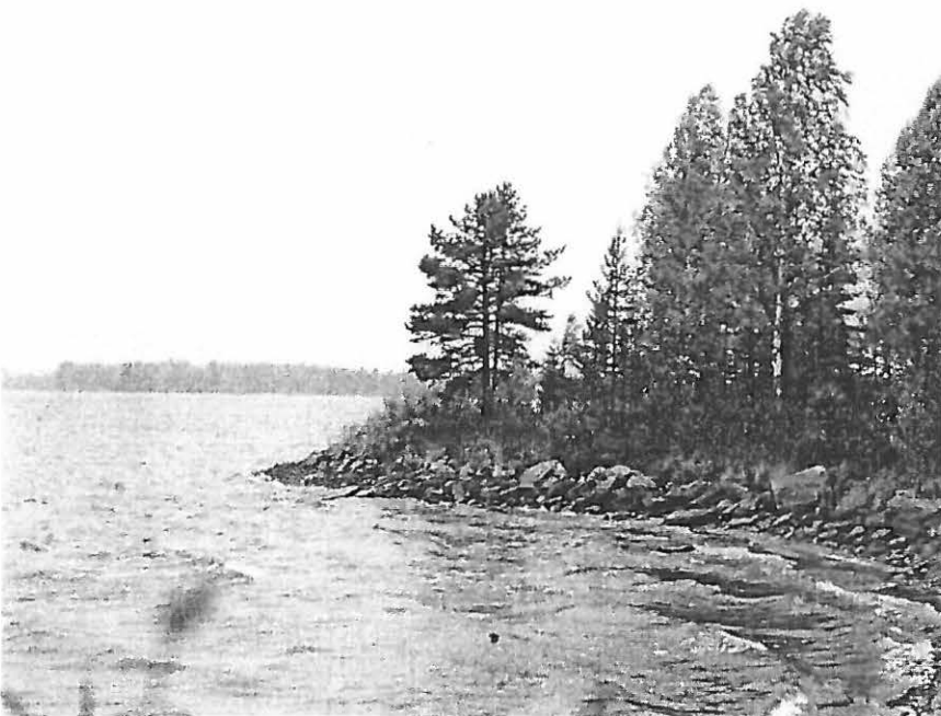
Kuva 1: Väävälänniemi katsottuna itäkoillisesta. Rantahiekalla näkyi muutamia valkeita kvartsi-iskoksia.