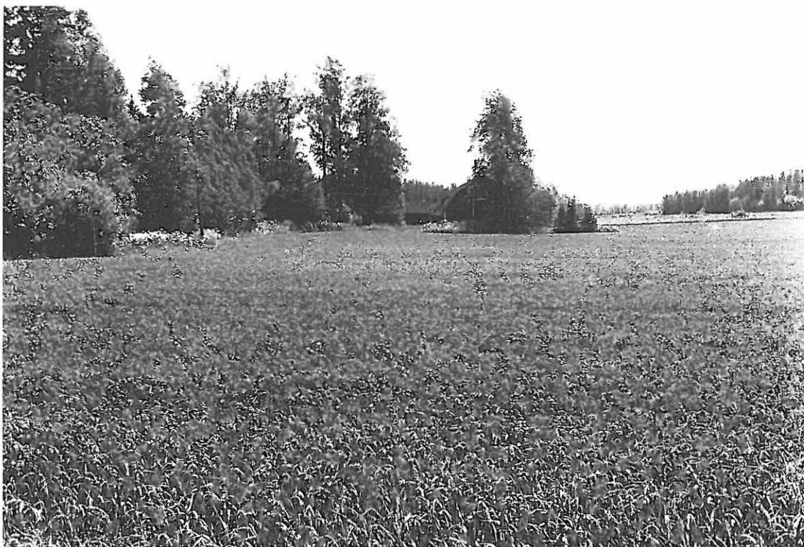
LKM Neg 129929 Lahti Mattila, esihistoriallinen asuinpaikka.