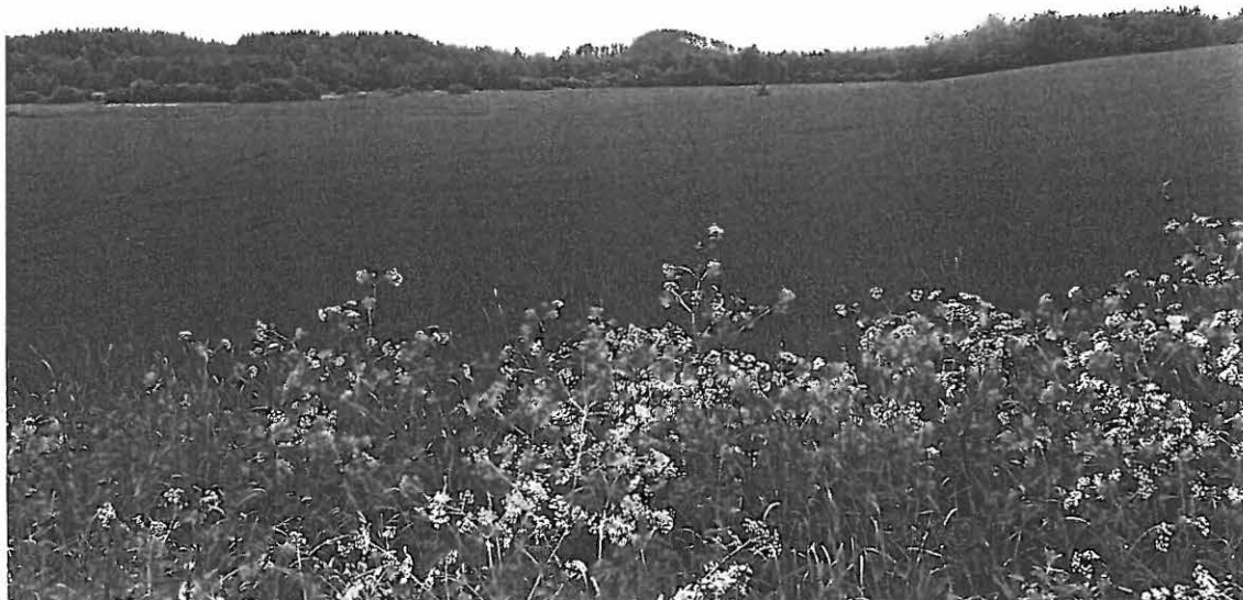
LKM Neg 129878 Orimattila Rengonjoki 1. Taustalla Pyssymäki.