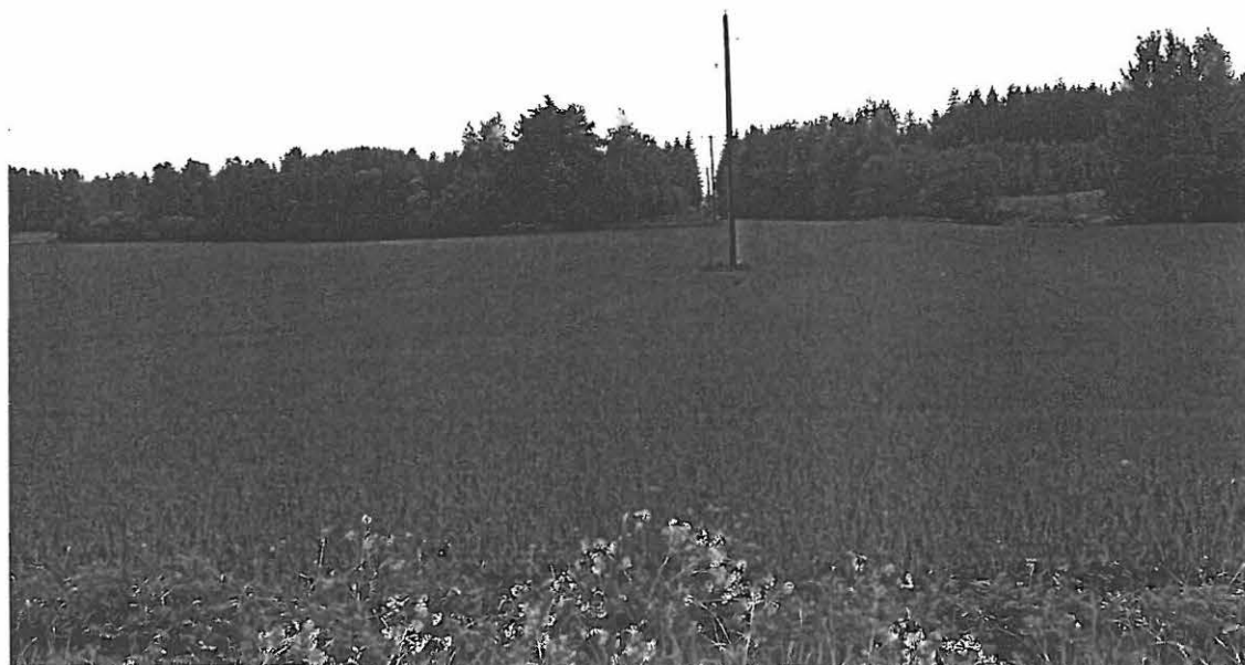
LKM Neg 129879 Orimattila Rengonjoki 2. Vasemmalla Pyssymäen laki.