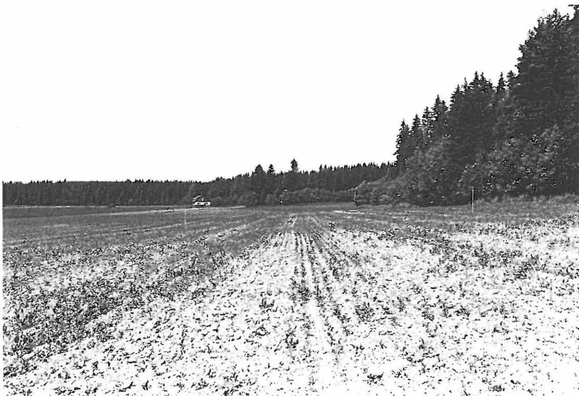
LKM Neg 129935 Lahti Myllymäki, esihistoriallinen asuinpaikka.