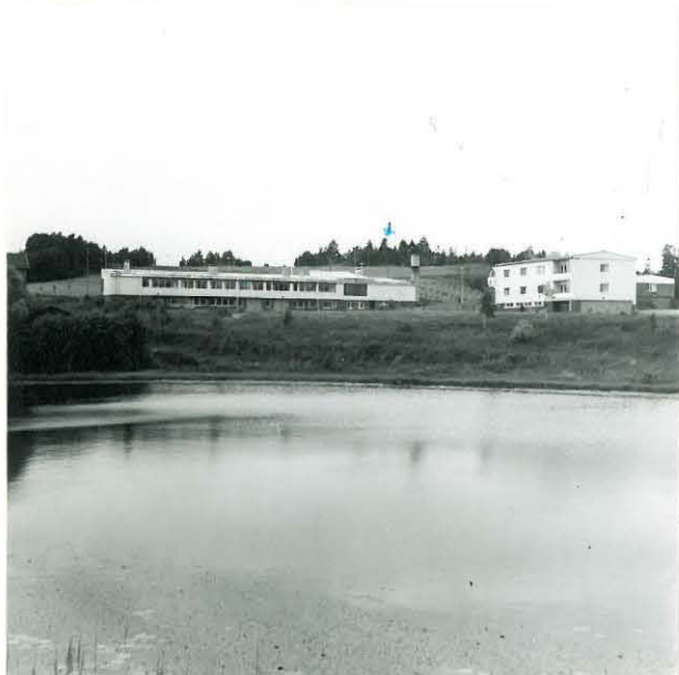
3. KÄRÄJÄMÄKI KUVATTU KAAKOSTA KIRKON LUONA OLEVAN KOTISEUTUMUSEON KOHDALTA KIRKKOJÄRVEN RANNASTA, EDESSÄ KUNNANTALO, „KÄRÄJÄKIVIEN” PAIKKA ↓.