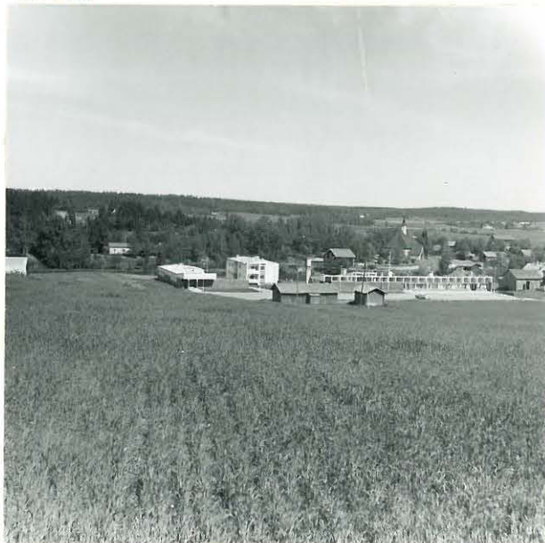
2. RENGON KIRKON SEUTUA KUVATTU MUURILAN KÄRÄJÄMÄEN (N:o 19) ITÄLAILTA ITÄÄN.