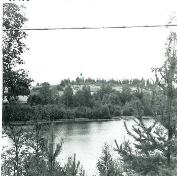
4. KÄRÄJÄMÄKI KUVATTU KOILLISESTA KIRKKOJÄRVEN YLI. SORAKUOPPA ON TUHON- NUT SEN POHJOISOSAN „KÄRÄJÄKIVIEN” PAIKKA ↓.