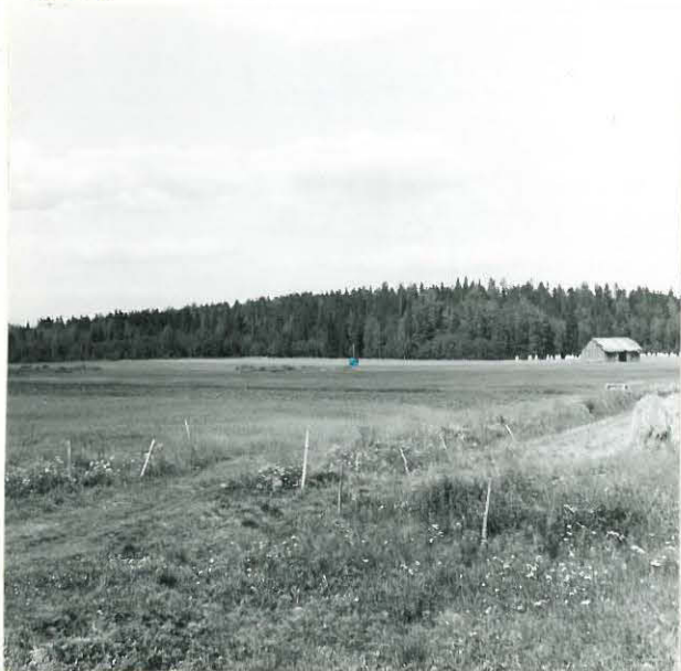
1. AHOINEN RAPIKISTO, KIRVEEN LÖYTÖPAIKKA (N:o 14) KUVAN KESKIVAI- HEILLA. KUVATTU RIIHEN LUOTA POHJOISEEN.