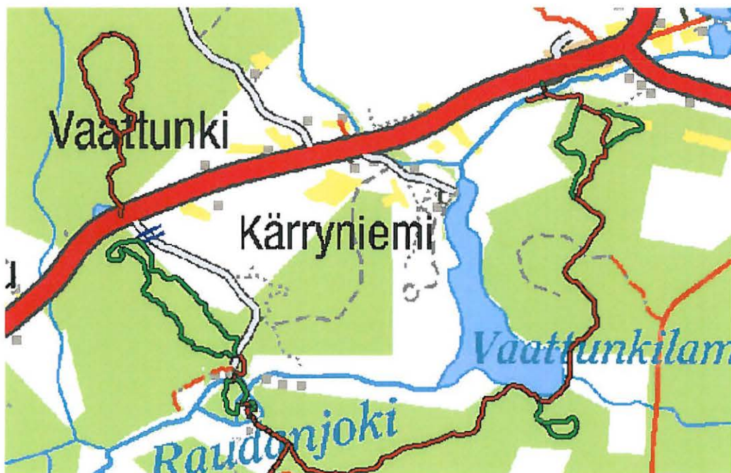
Kartta 1. Napapiirin retkeilyalueen reittejä, joiden ympäristö inventoitiin.

Inventoinnissa löytyi yksi kivikautinen asuinpaikka Vaattunkikönkäältä.