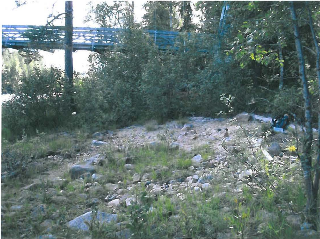
Kuva 1. Löytöpaikka lännestä kuvattuna.