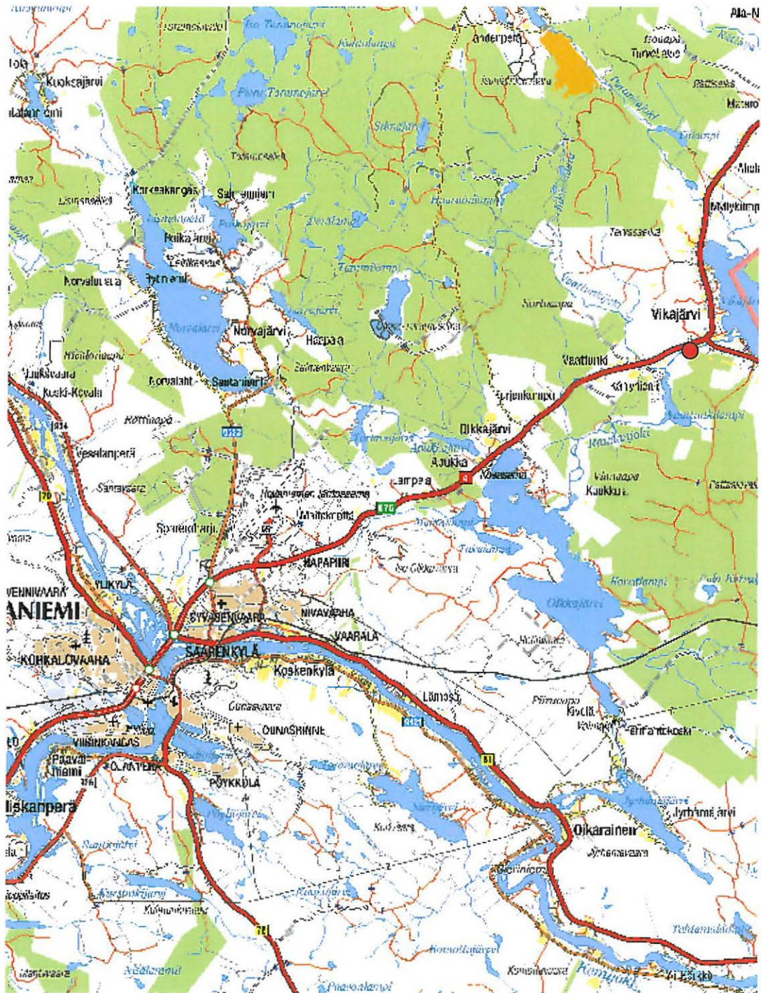
Kartta 2. Vikaköngäs. Löytöpaikan sijainti (punainen pallo). ©Metsähallitus 2008, ©Maanmittauslaitos 1/MYY/2008.