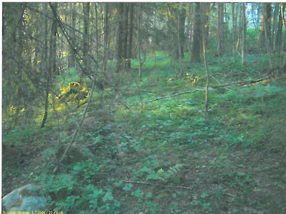
Vanha tieura rinteessä kuvattu pohjoiseen.