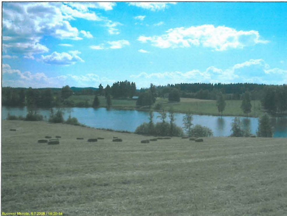
Ruovesi Murole, 6.7.2005 / 15:20-14