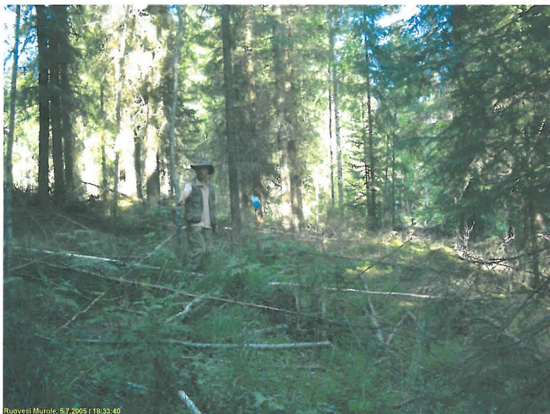
Asuinpaikan maastoa kuvattuna itään.