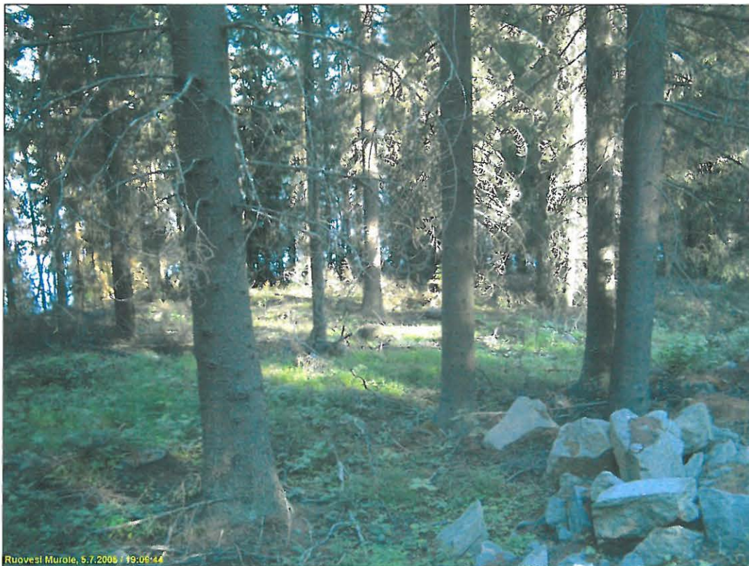
Asuinpaikka tasannetta kuvattuna etelään.