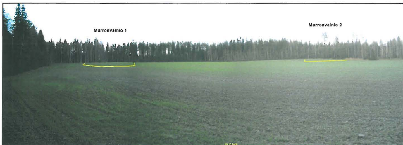
Panoraama kuva pohjoiseen. Asuinpaikat merkitty kuvaan keltaisella viivalla.