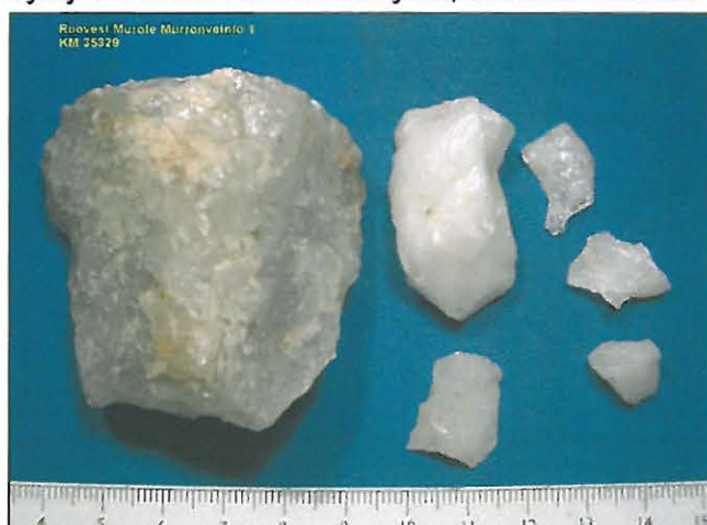
Löytöjä. Vasemmalla kvartsiydin, oikealla iskoksia