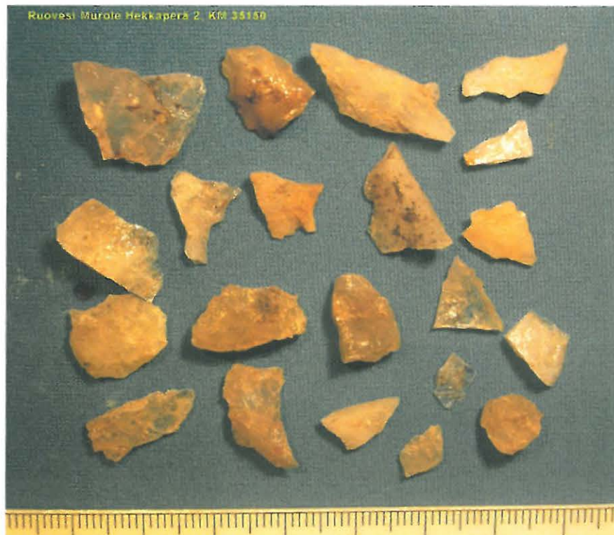
Asuinpaikalta löytyneitä kvartsi-iskoksia