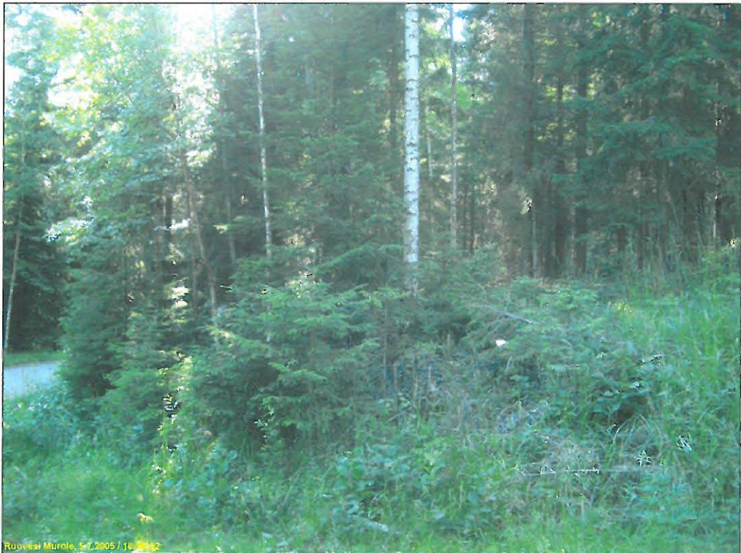
Kuvattu "laaksosta" länteen, asuinpaikka ylätasanteella metsässä.