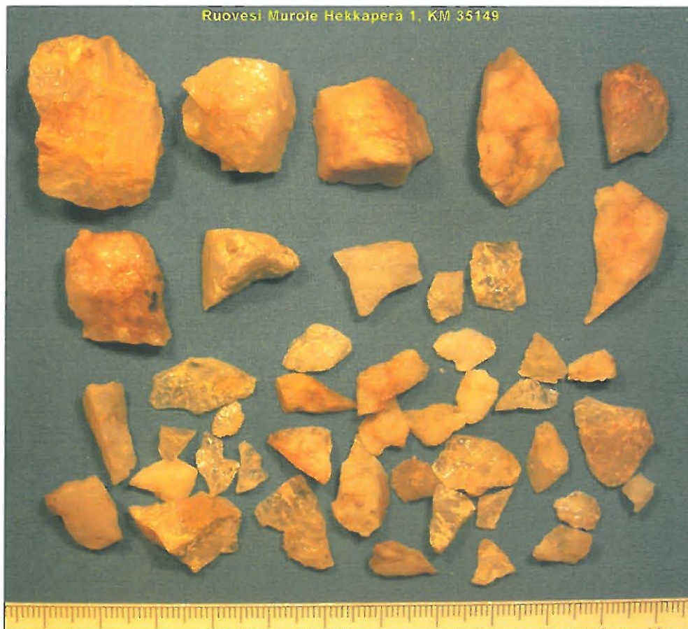
Asuinpaikalta löytyneitä kvartsi-iskoksia ja -ytimiä.