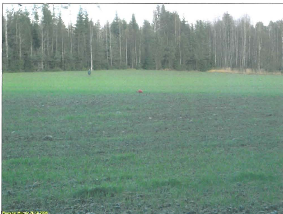
Asuinpaikan maastoa kuvan etualalla, kuvattu itään kohti Murronvainio 2 asuinpaikkaa.