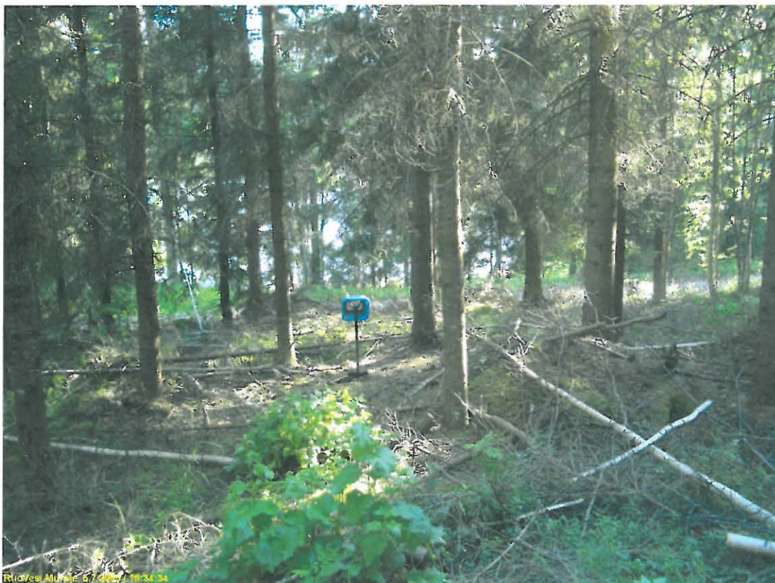
Asuinpaikan maastoa kuvattuna etelään.