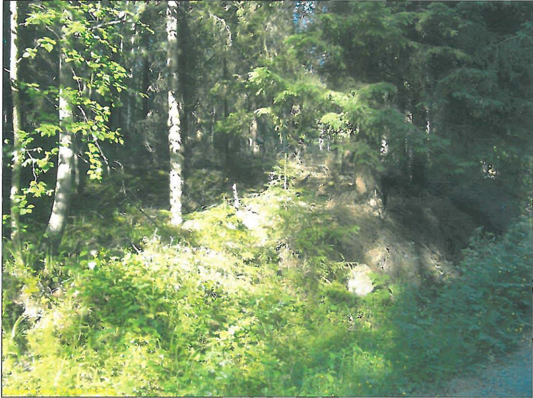
Kuvattu tieltä koilliseen, asuinpaikka törmän päällä metsässä.