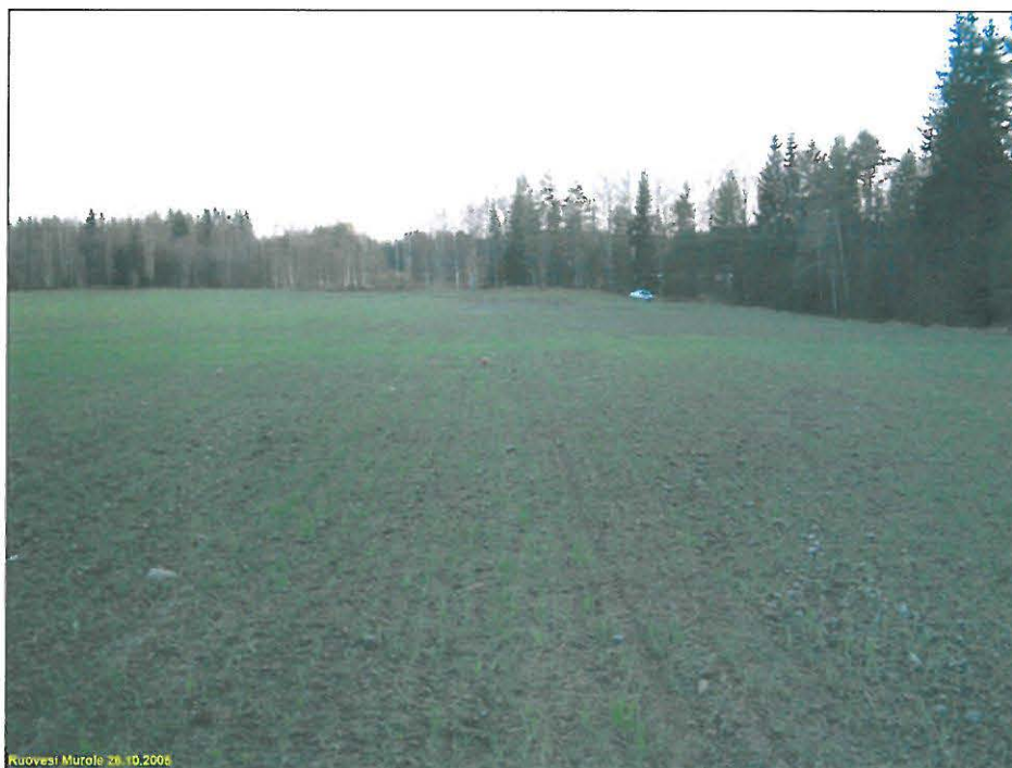
Asuinpaikkaa pellossa kuvan etualalla. Kuvattu etelään.

Paikka on muinismuistolailta suojeltu 2. luokan muinaisjäännös. Paikka on merkittävä kaavaan vähintään oheisen kartan rajauksen mukaisesti SM-alueena.