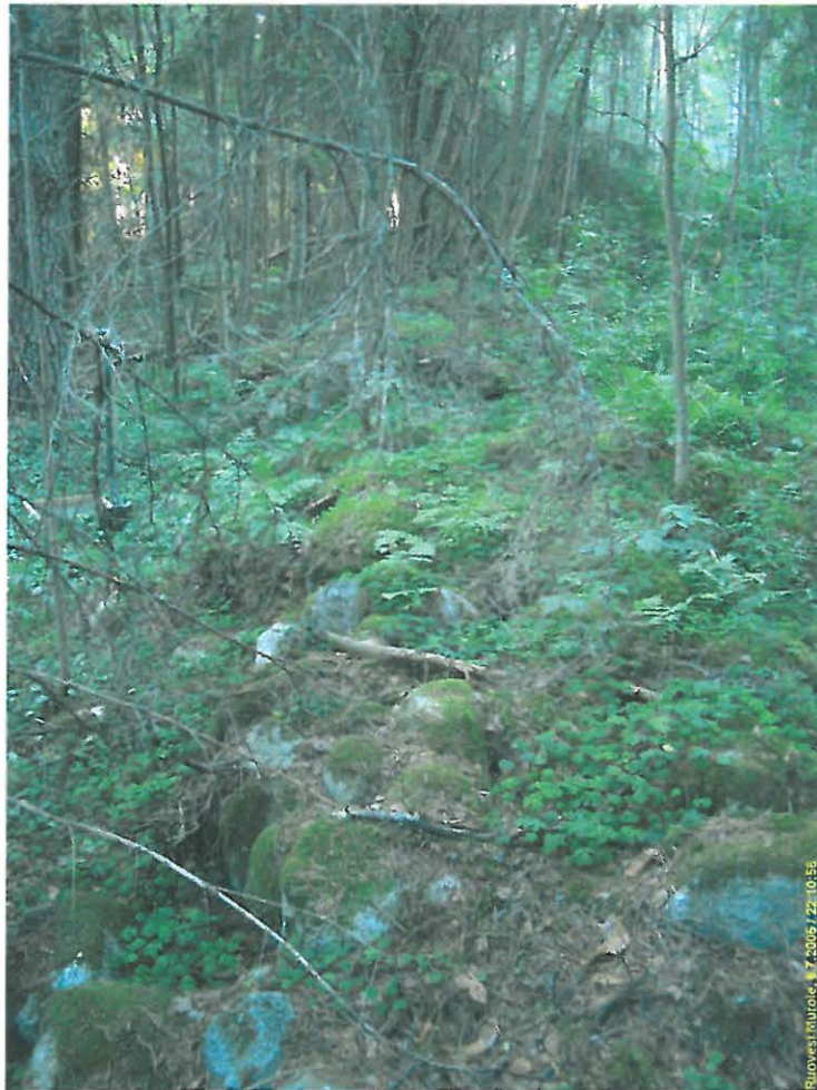
Kiviaidan eteläpäättä kuvattuna pohjoiseen.