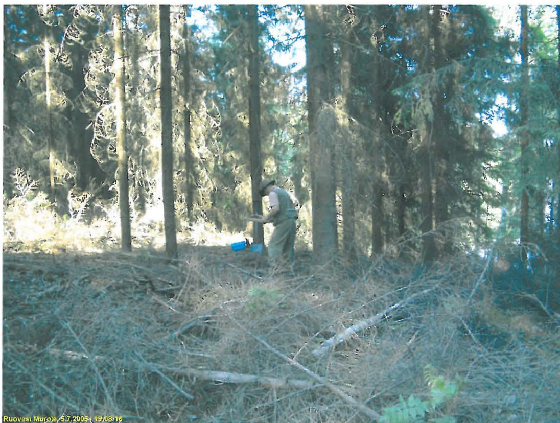
Asuinpaikka kuvattuna itään.