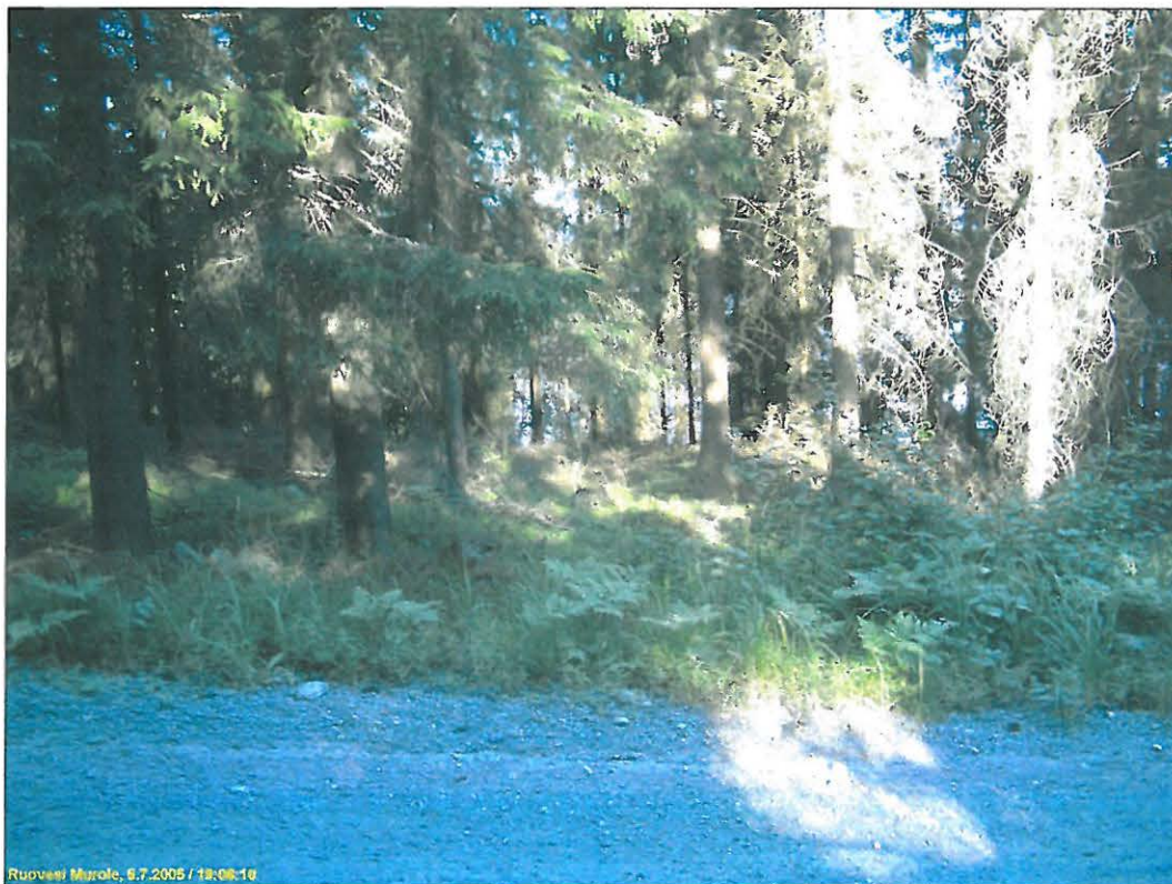
Asuinpaikkatasannetta kuvattuna tieltä kaakkoon.