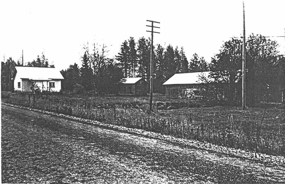
F.a. 3068 KUVA 1 : LASSILAN TALON PIHAPELTO VALOKUVATTUNA LOUNAASTA.