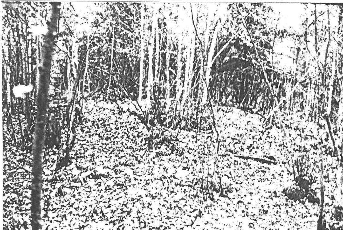
F.a. 3063. KUOPPA VALOKUVATTUNA PÖHJOISESTA. 25.9.1989, KINO.