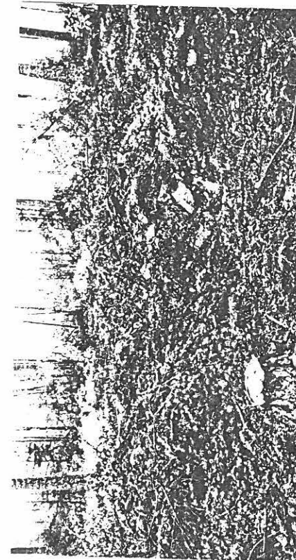
KUVA 4 : KUTEN ED.. SORAKUOPPA.