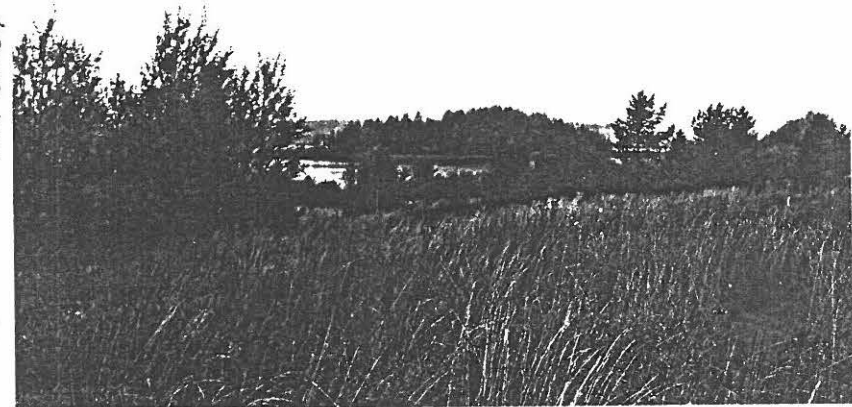
KUVA 2 : SONKAJÄRVI. KUOLIOSAARI. VALOKUVATTUNA HUUKAJANIEMELTÄ.