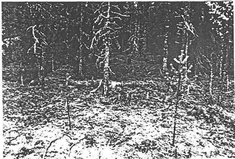
KUVA 1 : SONKAJÄRVI, RUTAKKO, VARMILA, ASUNNON POHJA.