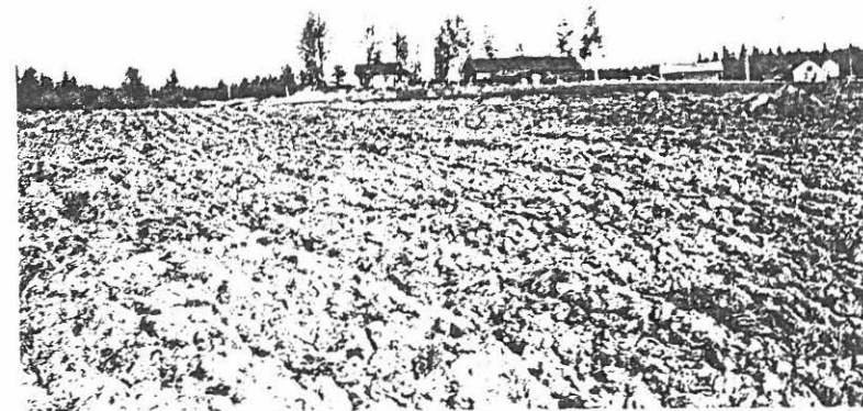
KUVA 2: SAMETTIN PELTOA KUVATTUNA LOU- NAASTA.