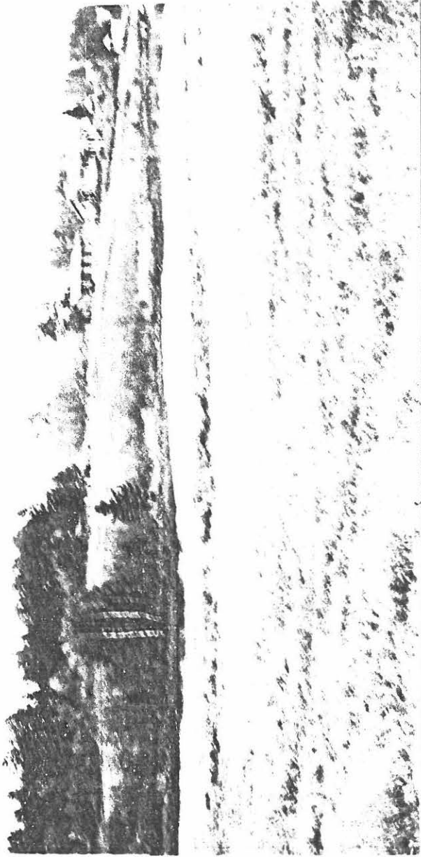
F.a. 3073 Kuva 1: SUKEVA, TENETTI, MIKKOLANPELTO VALOKUVAT- TUNA LOUNAASTA.