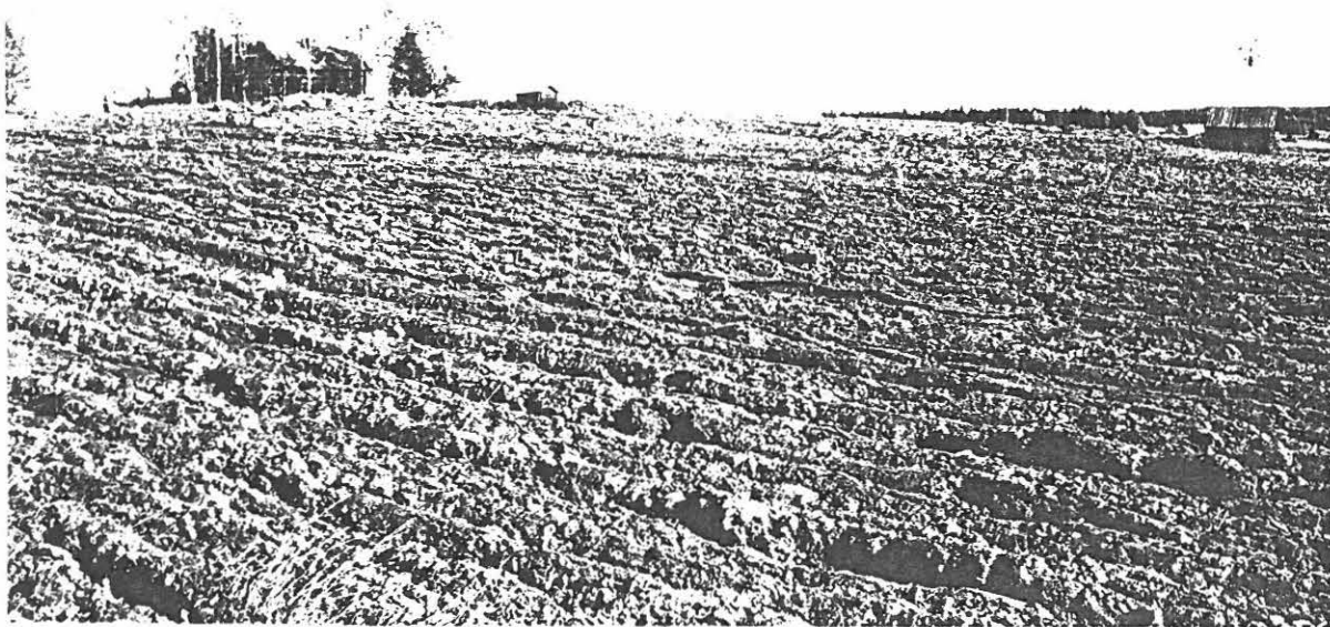
F.a. 3057 KUVA 1. SONKAJÄRVI VÄNNILÄNMÄKI, SAMETTI, PIHA - PELTO VALOKUVATTUNA LOUNAASTA. 22.9.1989, KINO.