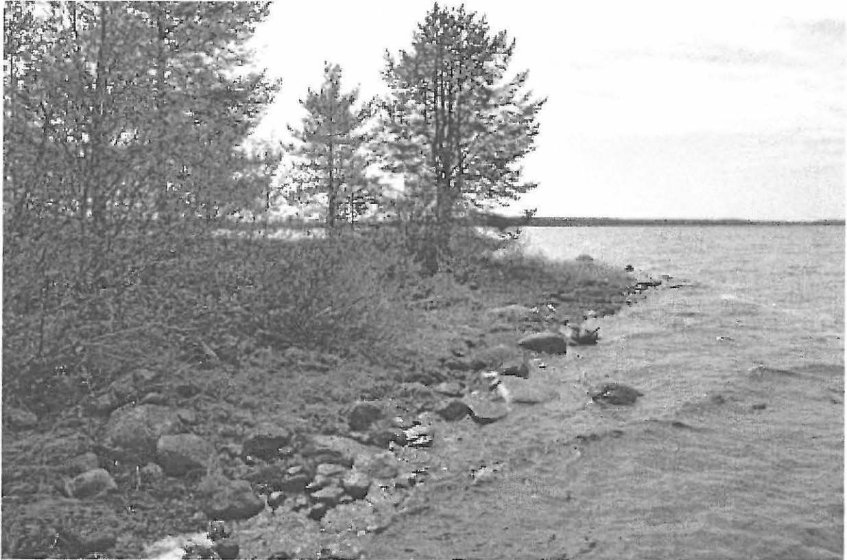
Kuva 3. Selkäsaari 2. Saaren länsipään pohjoisrantaa, jonka rantavedestä löytyi kvartsi-iskoksia. NE. KaiM 7589:4.