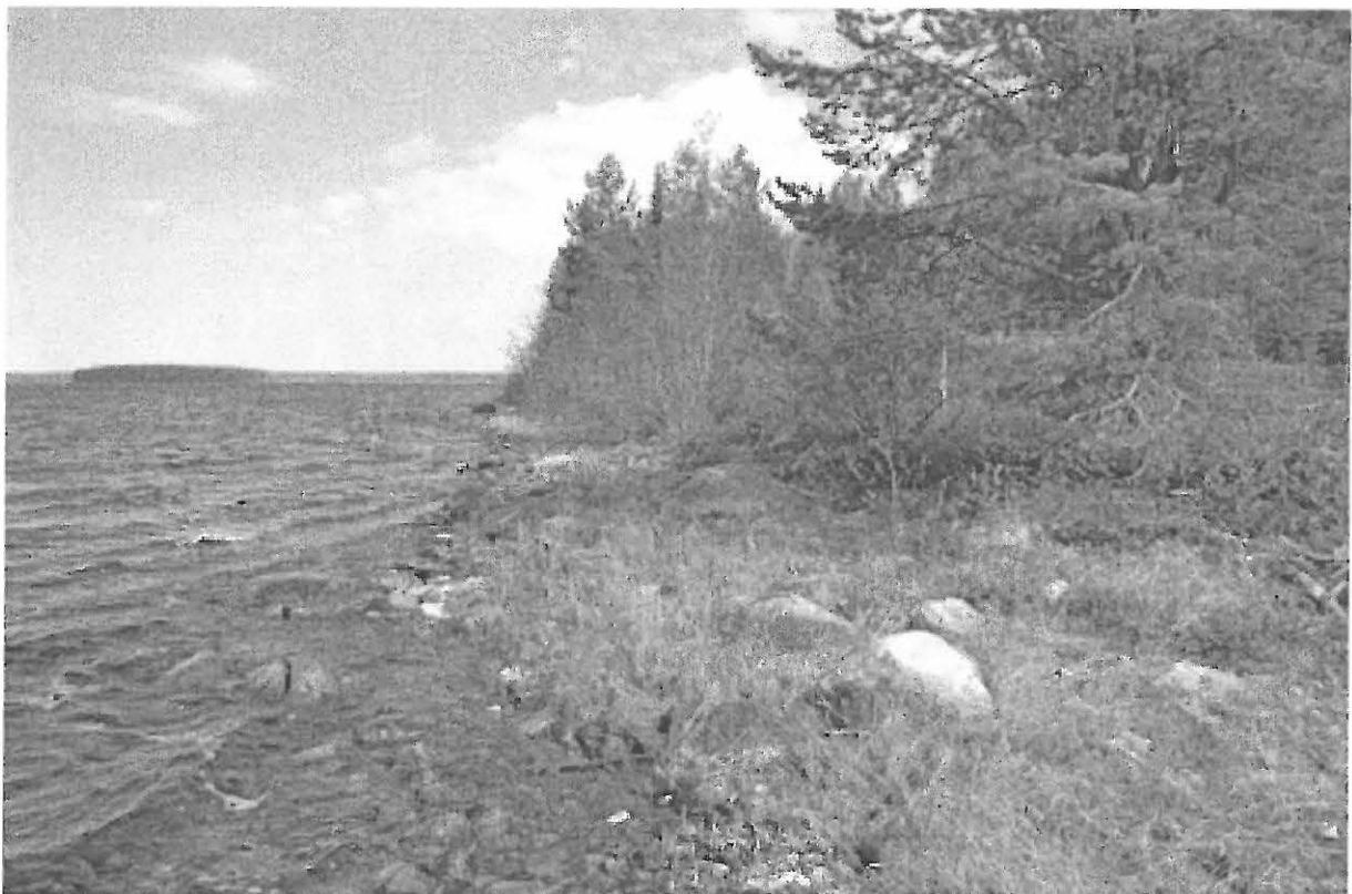
Kuva 4. Selkäsaari 2. Saaren länsipään pohjoisrantaa, jonka rantavedestä löytyi kvartsi-iskoksia. W. KaiM 7589:5.