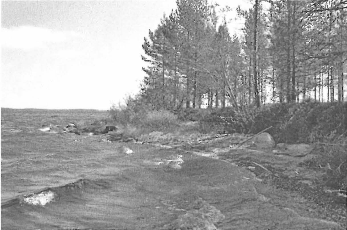
Kuva 5. Selkäsaari 3. Lahdelma pohjoisrannan länsipäässä. Siitä löytyi hieman kvartsi-iskokia. NW. KaiM 7589:6