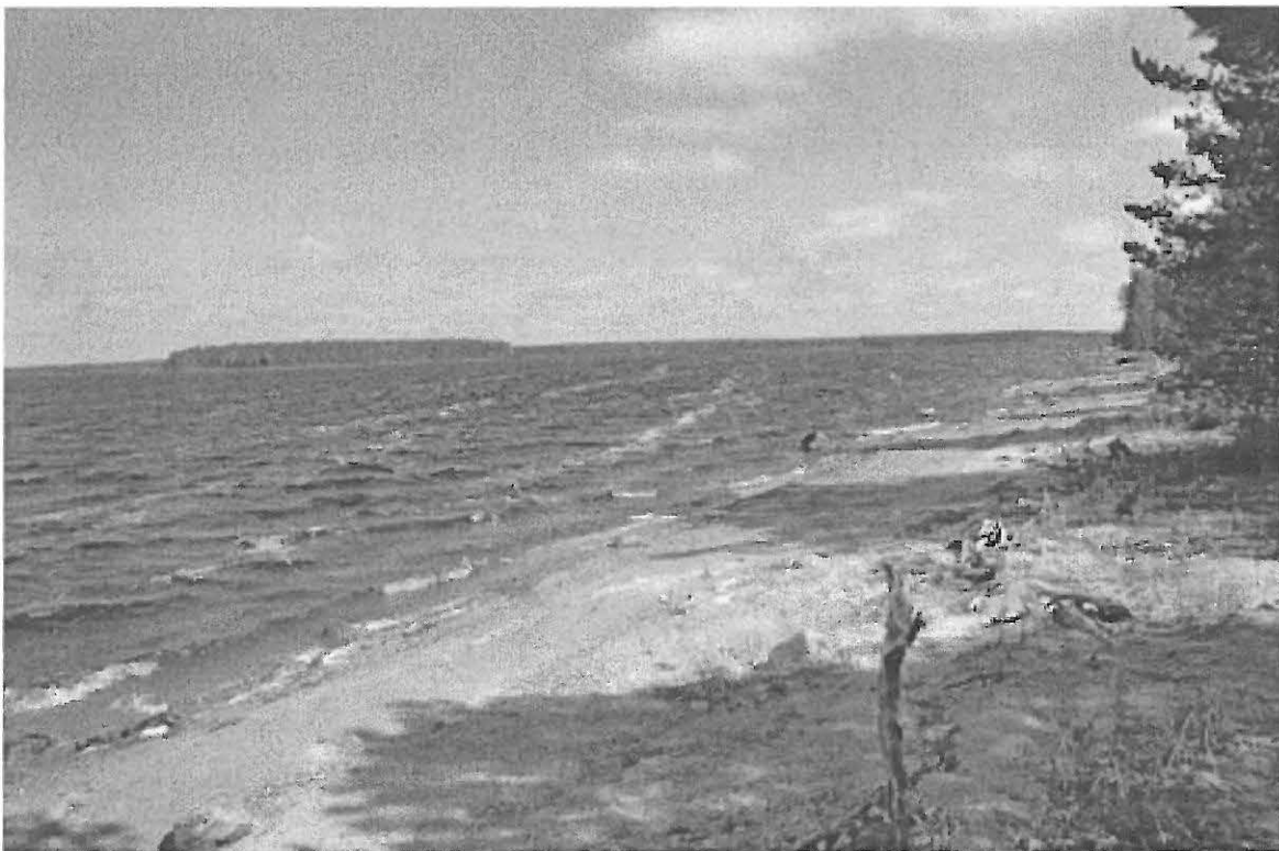
Kuva 2. Selkäsaari (1). Kvartsialueen länsipää, vasemmalla Pärsämönsaari. SW. KaiM 7589:3.