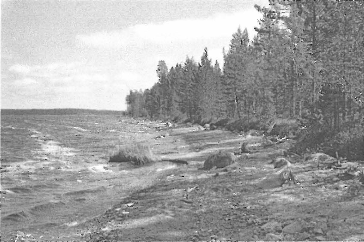
Kuva 1. Selkäsaaren pohjoisrantaan kohdassa, jossa kivikko vaihtuu hiekkarannaksi. W. KaiM 7589:1.