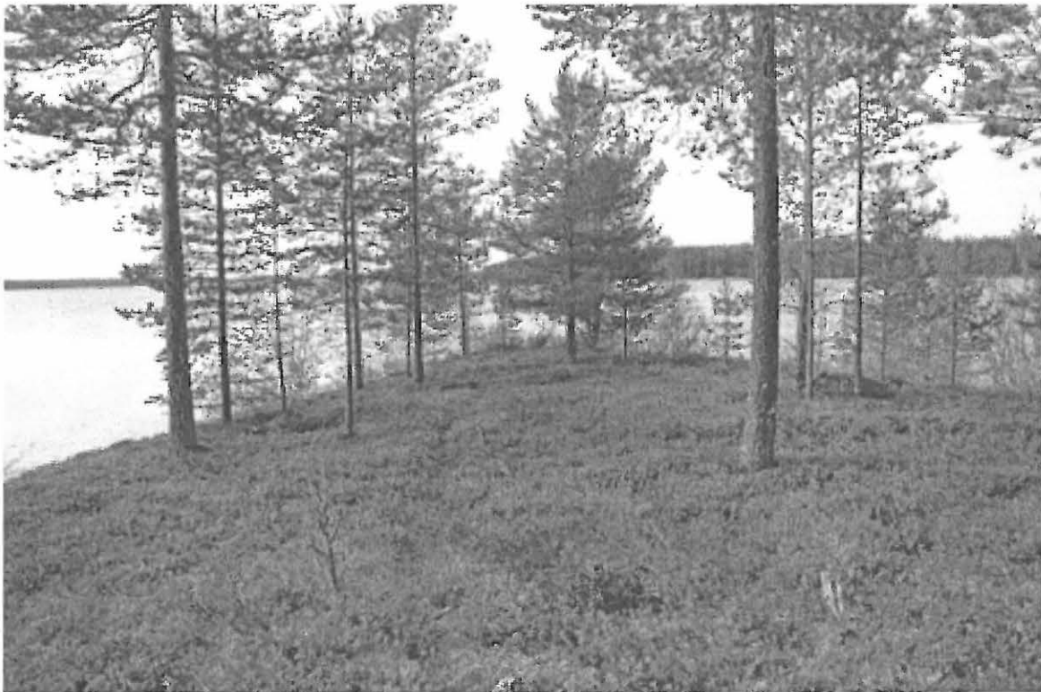
Kuva 6. Selkäsaari 3. Saaren itäpää. W. KaiM 7589:7.