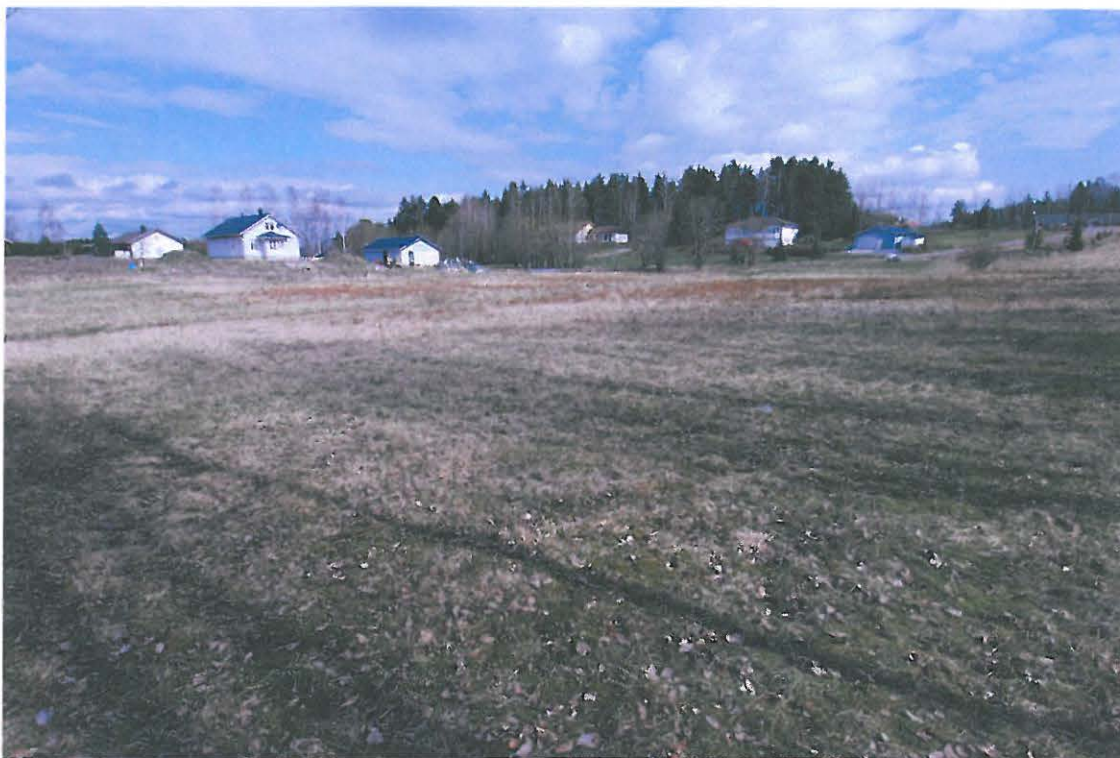
Bromarv Pålarp. Vuoden 1647 maakirjakarttaan merkitty talo on sijainnut jotakuinkin kuvassa vasemmalla näkyvien talojen kohdalla, mahdollisesti hieman niiden eteläpuolella. Kuvattu lounaasta. (DG114:1)