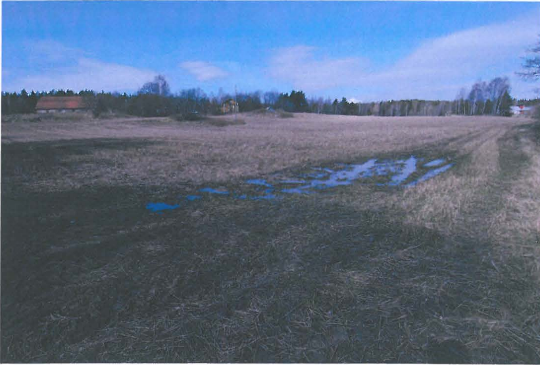
Kuvassa vasemmalla näkyy Revbackan tilan rakennuksia, joiden kohdalla 1600-luvun talo on sijainnut. Kuvattu kaakosta. (DG113:1)