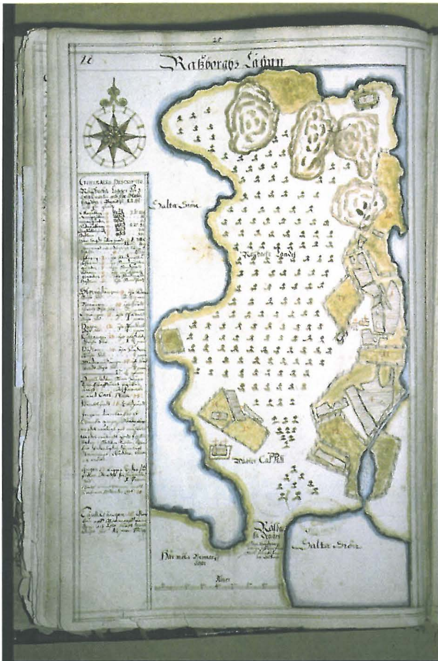
Revbackan maakirjakartta vuodelta 1647 (B1a s. 28). Kartassa näkyy vanha kappeli (Wäster Cappell) sekä Revbackan (Räffbacka) asutus.