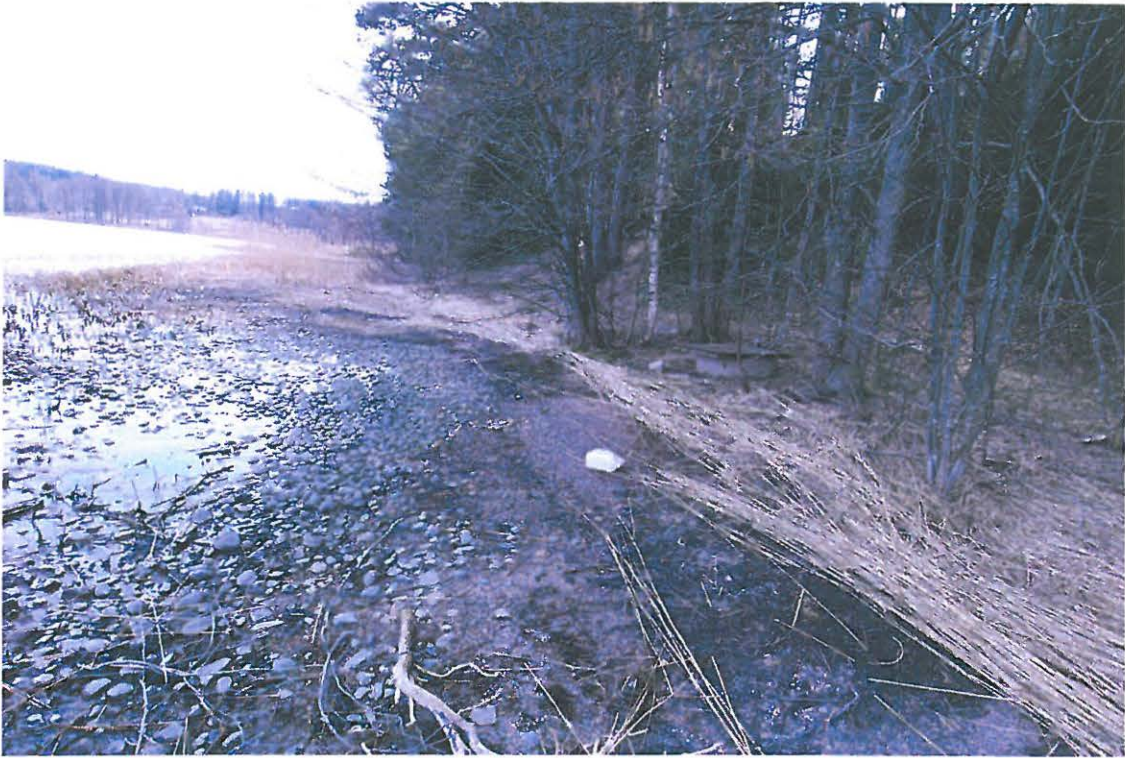
Kejsarbrunnen. Lähde on peitetty puukannella, näkyy kuvassa olevien puiden luona. Kuvattu pohjoisesta. (DG116:1)