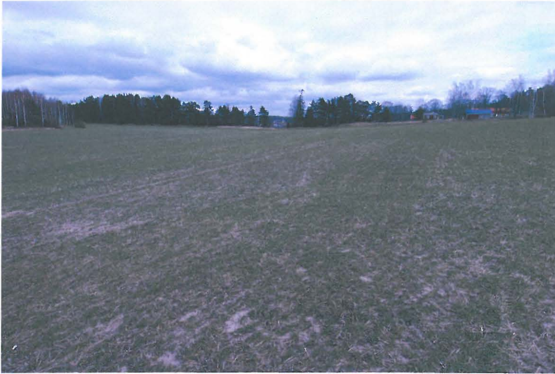
Bromarv (Bråmarff). Rusthollin rakennuksia kuvan oikeassa laidassa. Vuoden 1647 kartaan merkitty talo on ilmeisesti sijainnut rakennuksista pohjoiseen (kuvassa vasemmalle) olevalla alueella. (DG115:1)