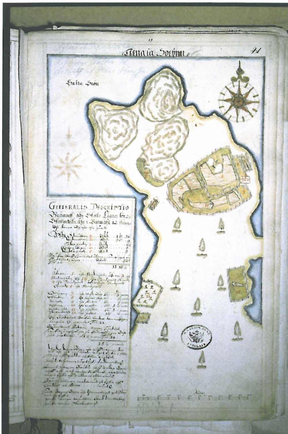
Bromarv (Bråmarff). Maakirjakartta vuodelta 1647 (B1a s. 19). Kartassa näkyy nykyisen Revbackavikenin eteläpuolella sijainnut talo.