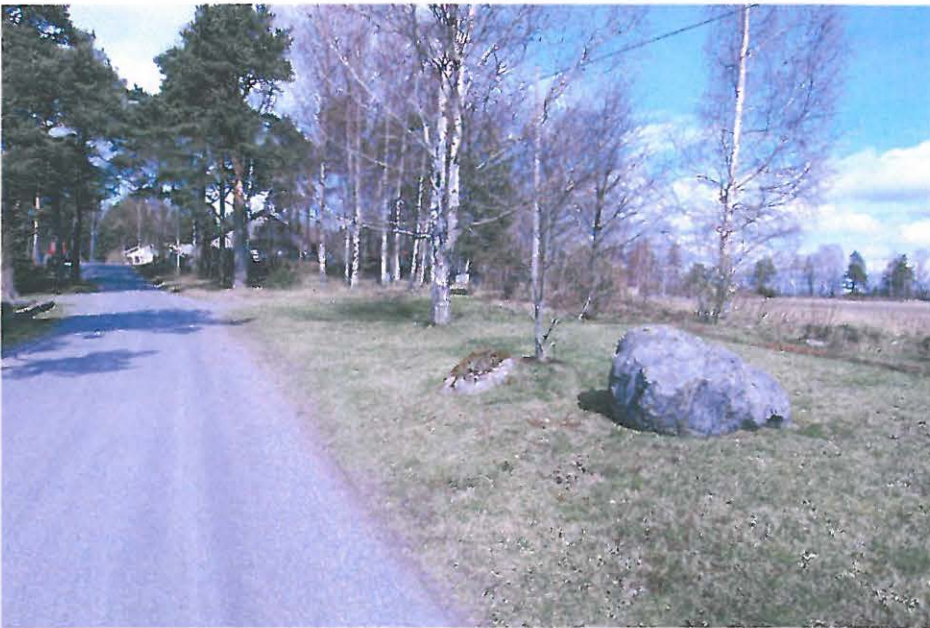
Bromarv vanha kappeli. Yleiskuva alueesta, kuvattu lännestä. (DG112:2)