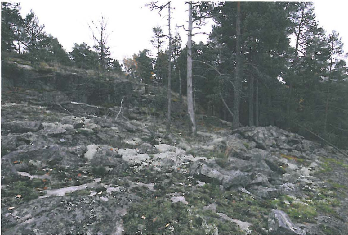
Näsebergetin kivilouhos kuvattuna pohjoisesta (DG111:1).