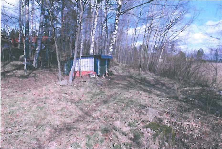
Bromarv vanha kappeli. Matala kivivalli kulkee kuvassa näkyvän kojun alla. Kuvattu lännestä. (DG112:1)

Rauhoitusluokka II Lukumäärä 1 Koordinaattiselite Kohde gps paikannettu. Karttaotteet 2012 07 Bromarv, 1:10000