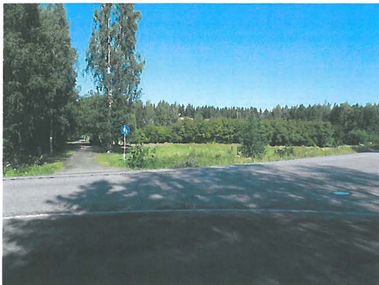
Kuva 2. Nallenpuiston leikkikenttä kuvattuna kaakosta. 17.7.2009