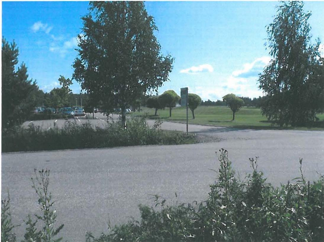
Kuva 9. Nykyisin löytöpaikalla sijaitsee parkkipaikka ja golfkenttä. 17.7.2009