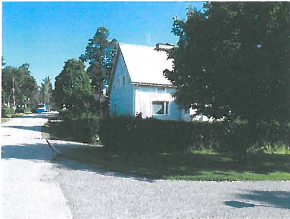
Kuva 3. Karhunkatu ja Karhunkatu 75:n kohdalla sijaitseva omakotitalo. 17.7.2009