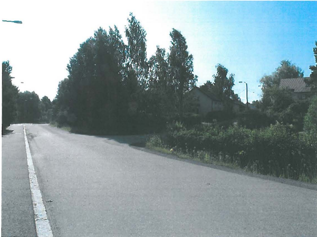
Kuva 7. Sudenkatu 32.