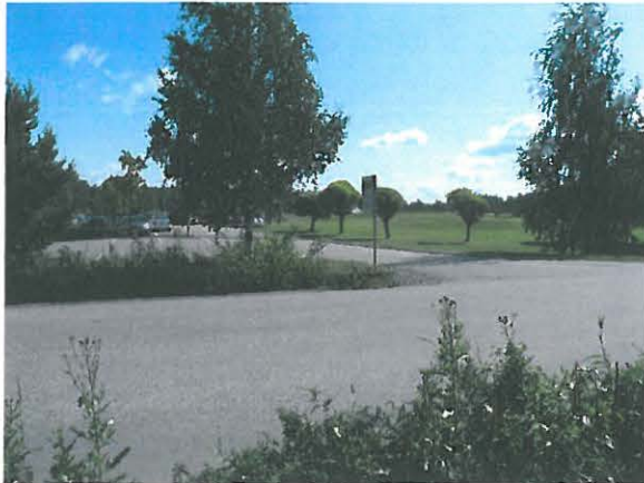
Kuva 8. Nykyisin löytöpaikalla sijaitsee parkkipaikka ja golfkenttä. 17.7.2009