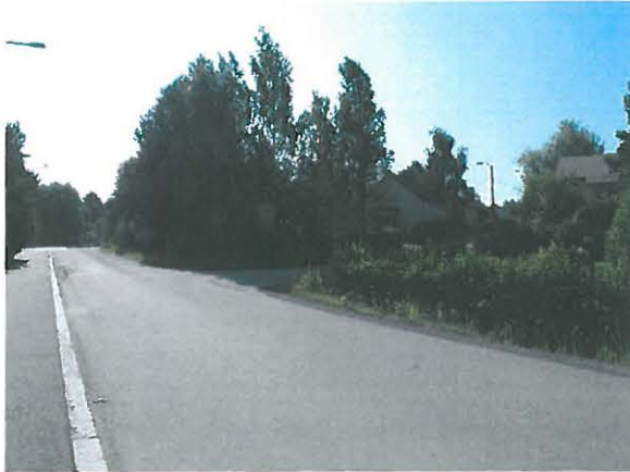
Kuva 6. Sudenkatu 32. 17.7.2009