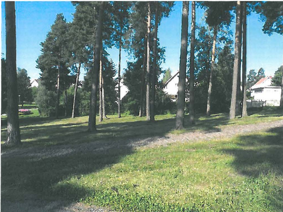
Kuva 5. Puistoaluetta Karhunkadun itäpuolella. Karhunkatu 75:n rakennus näkyy taustalla keskellä vasemmalla. 17.7.2009