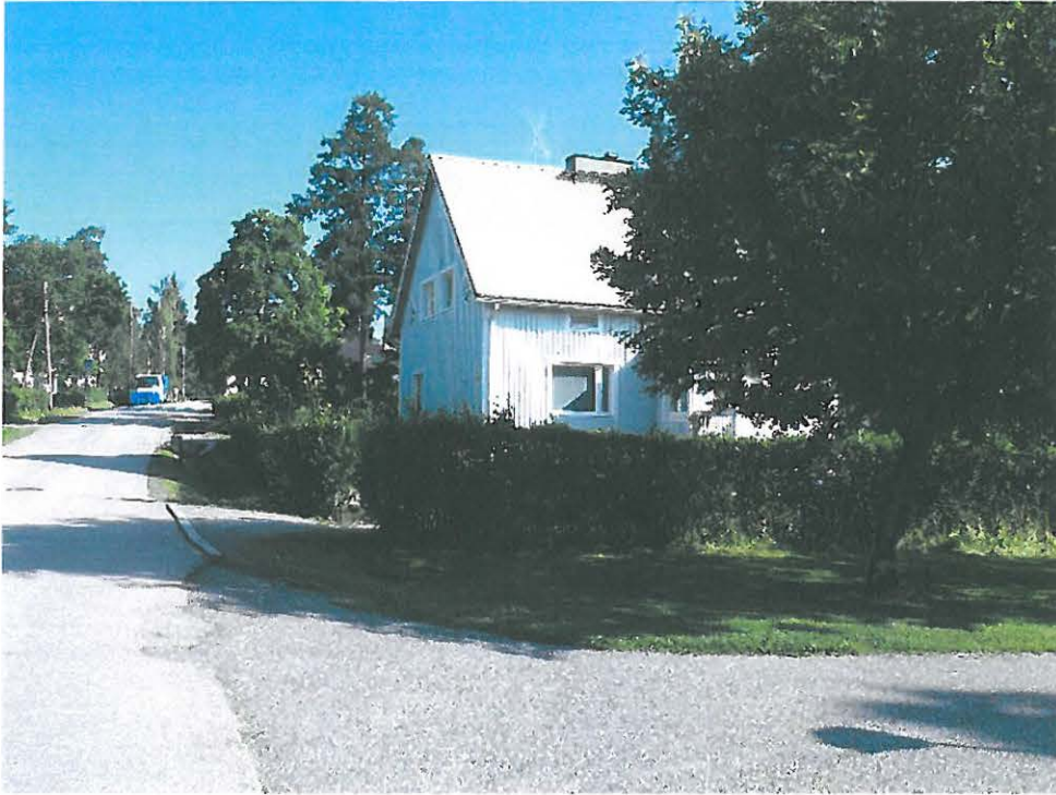
Kuva 4. Karhunkatu ja Karhunkatu 75:n kohdalla sijaitseva omakotitalo. 17.7.2009