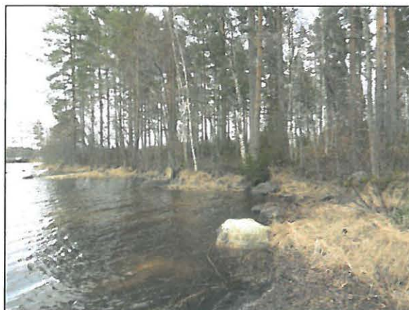
Tutkimusalueen eteläosan niemi luoteesta.

Tutkimusalue rajattu vihreällä viivalla. Sen eteläpuolella Riitniemen (844010025) kivikautinen asuinpaikka ja länsipuolella saarella Hynnisenosaaren (844010006) kivikautinen asuinpaikka.