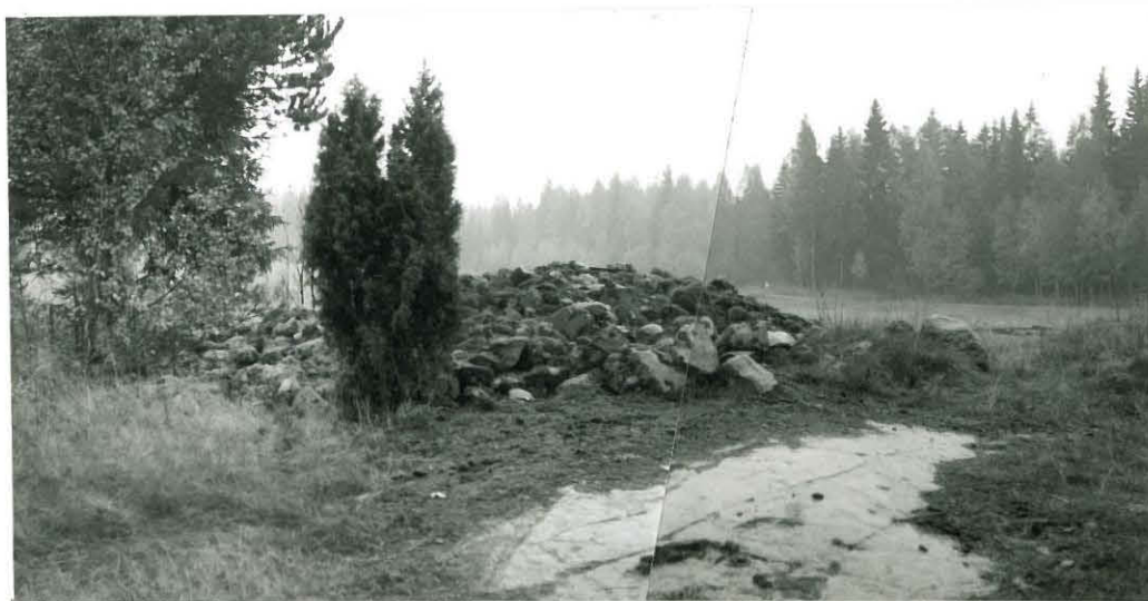
KUVA 1. PELLON REUNASSA MATALALLA KALLIOILLA OLEVA PYÖREÄ RÖYKKIÖ B KUVATTUNA LUOTEESTA.