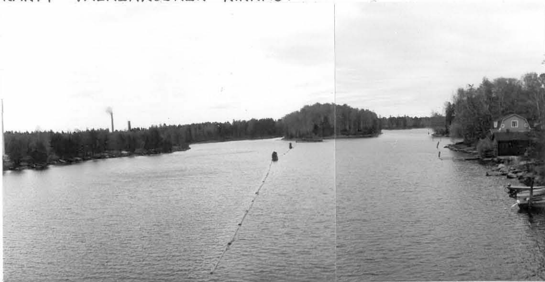
KUVA 1. KUVAN KESKELLÄ OLEVAN KOIVIKKOSAAREN KORKEIMMALLA KOHDALLA ON SARASMO KAIVANUT 3 RÖYKKIÖTÄ. LISÄKSI SAARESSA ON VALLIHAUTOJA. KUVA ON OTETTU ETELÄSTÄ, APIANNIEMESTÄ. KUVAN VASEMMASSA REUNASSA NÄKYVÄ VALKEAKOSKEN KIRKKO.