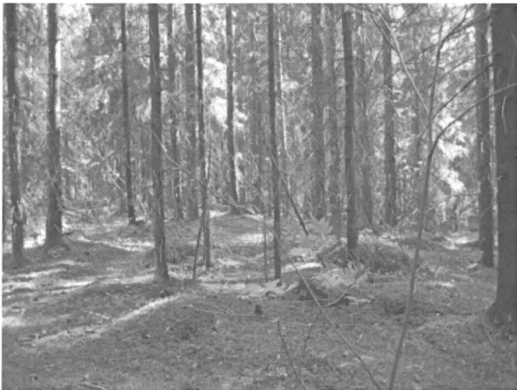
Kuva 3. Turku, Pähkinämäki 2. Vallimaisen muodostuman lounaisosaa löytökohteessa 2. Kuvattu lounaasta. DT2008:60:1:4 /H. Brusila