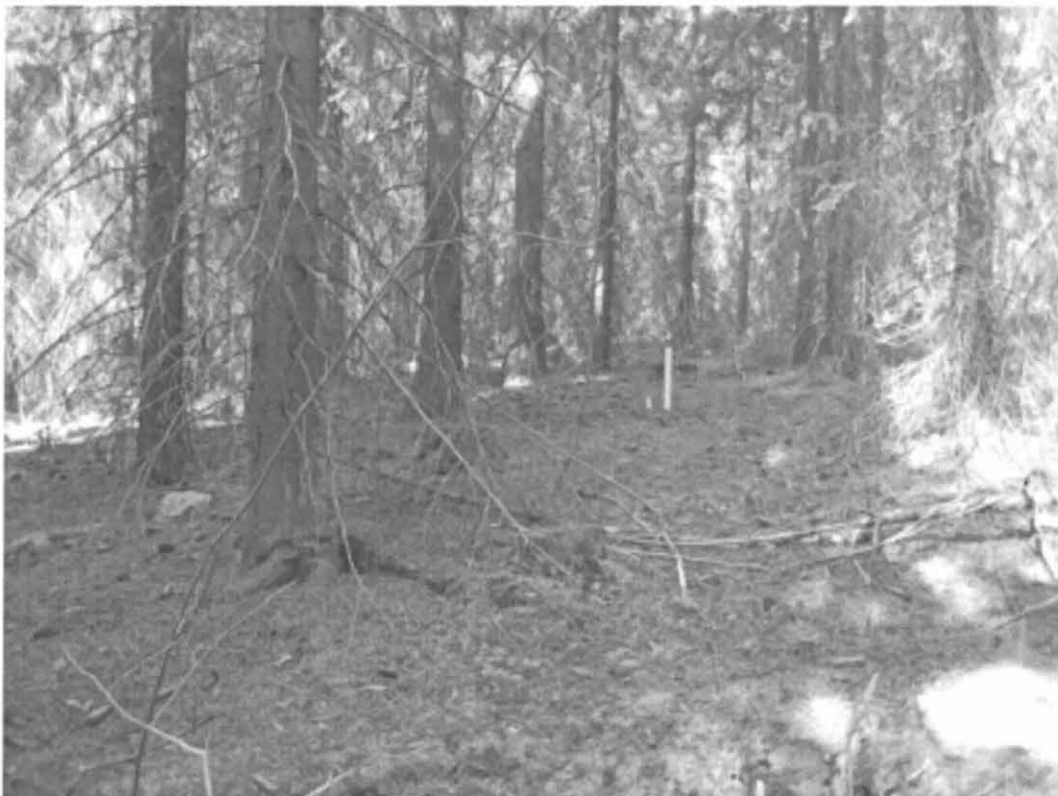
Kuva 1. Turku, Pähkinämäki 2. Löytökohde 1, jossa paalun kohdalla nokimaata ja palaneita kiviä. Kuvattu idästä. DT2008:60:1:12