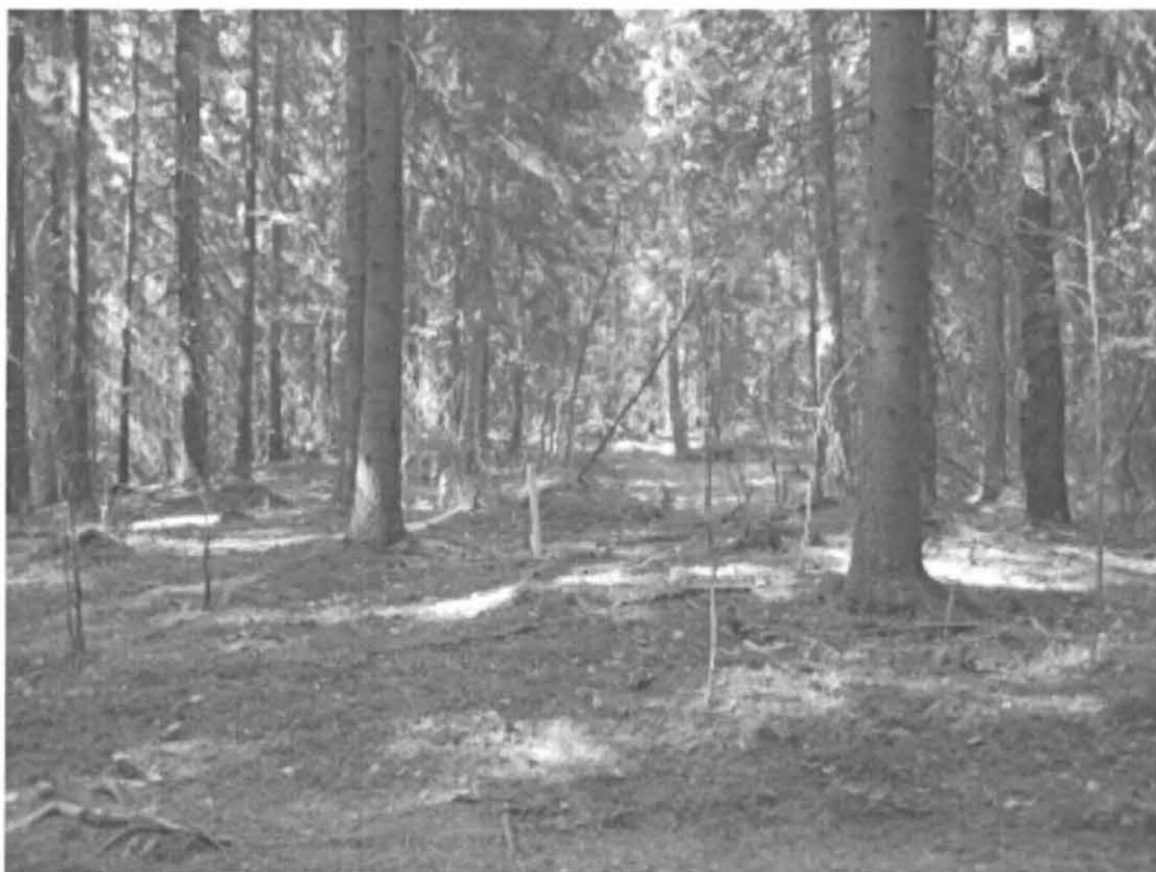
Kuva 2. Turku, Pähkinämäki 2. Löytökohde 2, jossa vallimainen muodostuma. Kuvassa etualalla kohteen koillisosaa, jossa paalun kohdalla nokimaata ja palaneita kiviä. Taustalla kuvan keskellä kosteikko. Kuvattu koillisesta. DT2008:60:1:7