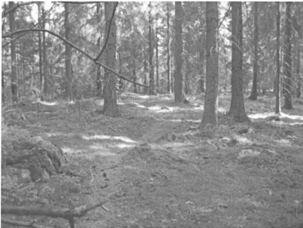
Kuva 7. Turku, Pähkinämäki 2. Löytökohteen 4 lounaisosaa etelästä kuvattuna. Vasemmalla taustan metsikössä kosteikko. DT2008:60:1:11