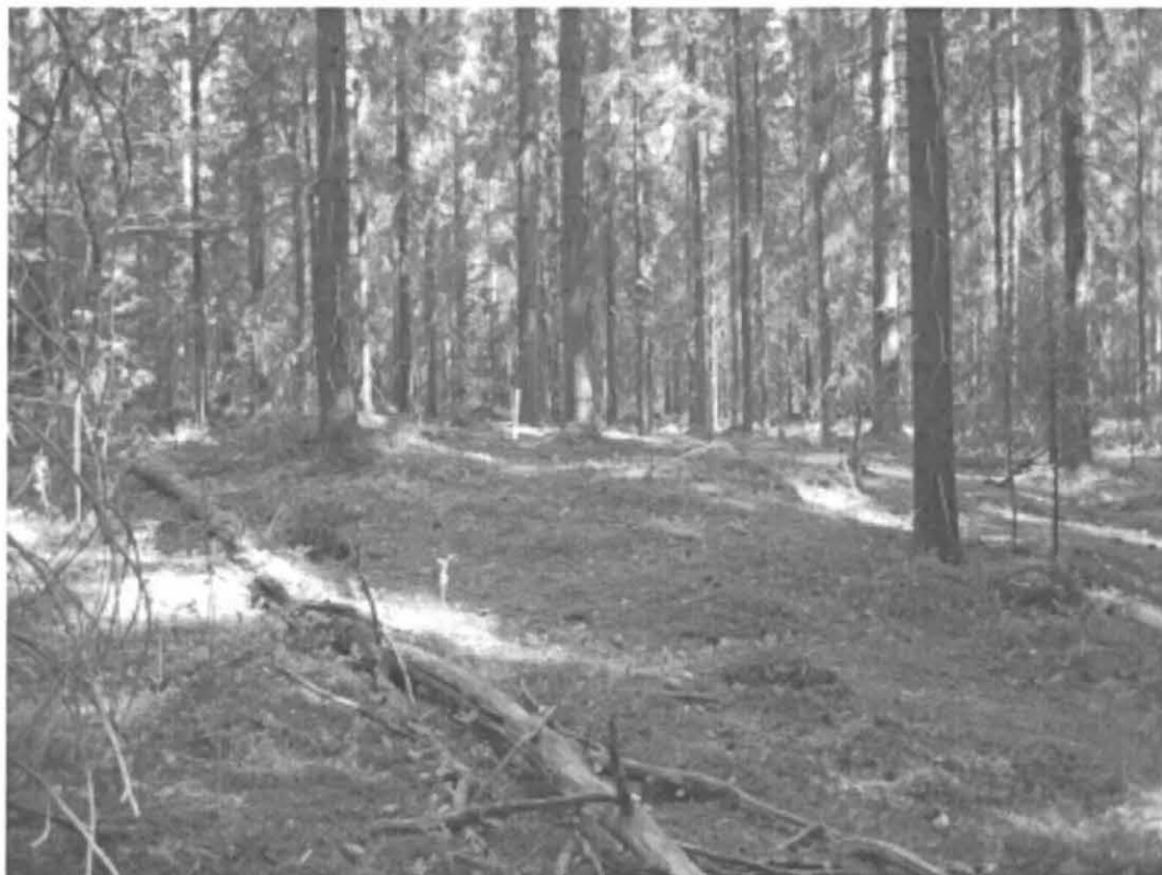
Kuva 4. Turku, Pähkinämäki 2. Löytökohteen 2 koillisosaa, jossa paalun kohdalla kuusten välissä nokimaata ja palaneita kiviä. Kuvattu etelästä. DT2008:60:1:6