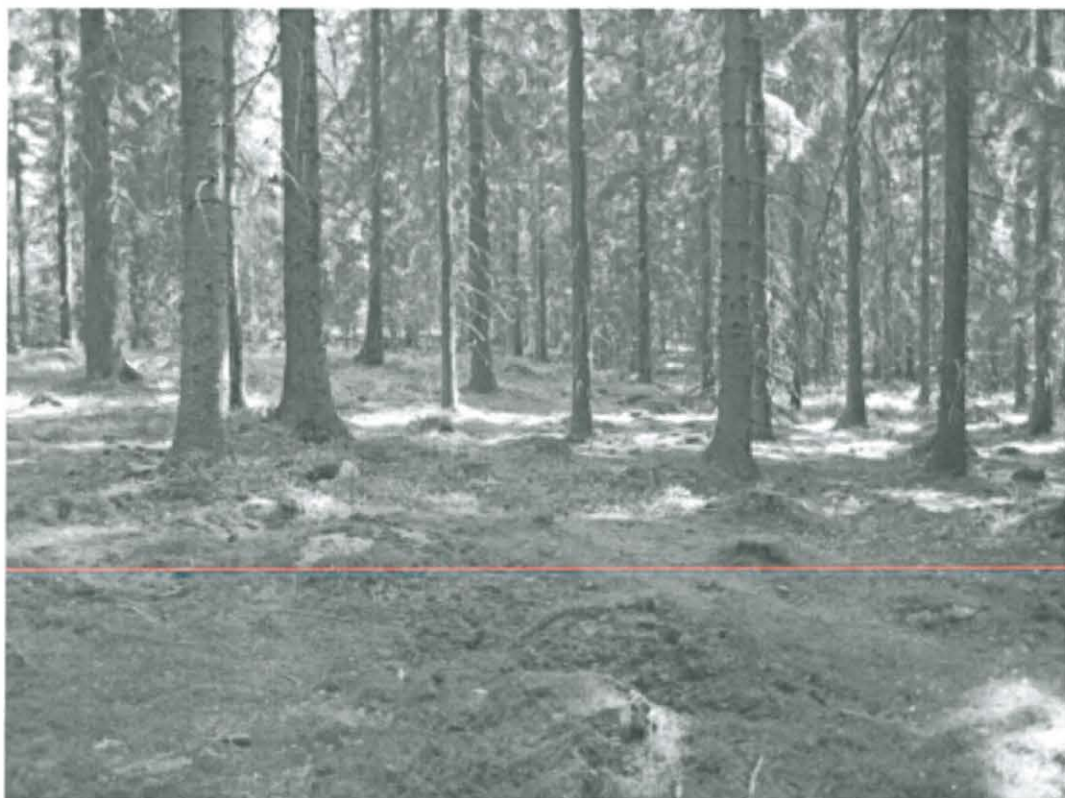
Kuva 6. Turku, Pähkinämäki 2. Löytökohde 4. Kuusikossa kuvan vasemman puoliskon keskiosassa lounais-koillissuuntaisen matalan harjanteen lounaisosaa, johon tehdystä koekuopasta löytyi kulttuurimaata, kiveystä ja esihistoriallisen saviastian pala. DT2008:60:1:9