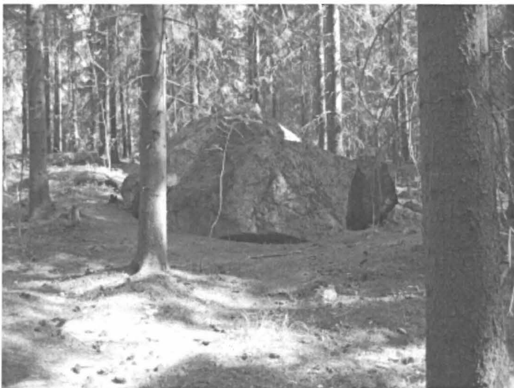
Kuva 8. Turku, Pähkinämäki 2. Löytökohteiden 1 ja 2 välissä oleva halkaistu siirtolohkare lounaasta kuvattuna. Taustalla metsikössä löytökohde 2, vallimainen muodostuma, jonka sisällä kosteikko. DT2008:60:1:13