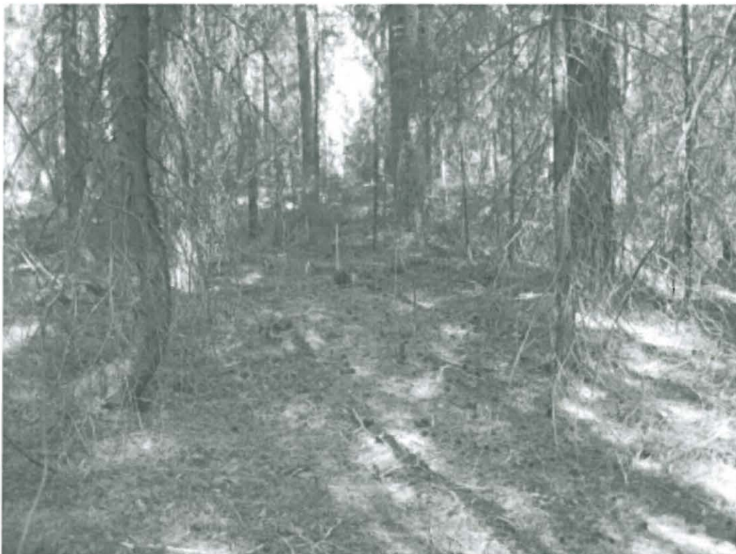
Kuva 5. Turku, Pähkinämäki 2. Löytökohde 3. Kuusten keskellä olevan paalun kohdalla nokimaata ja palaneita kiviä. Kuvattu kaakosta. DT2008:60:1:5