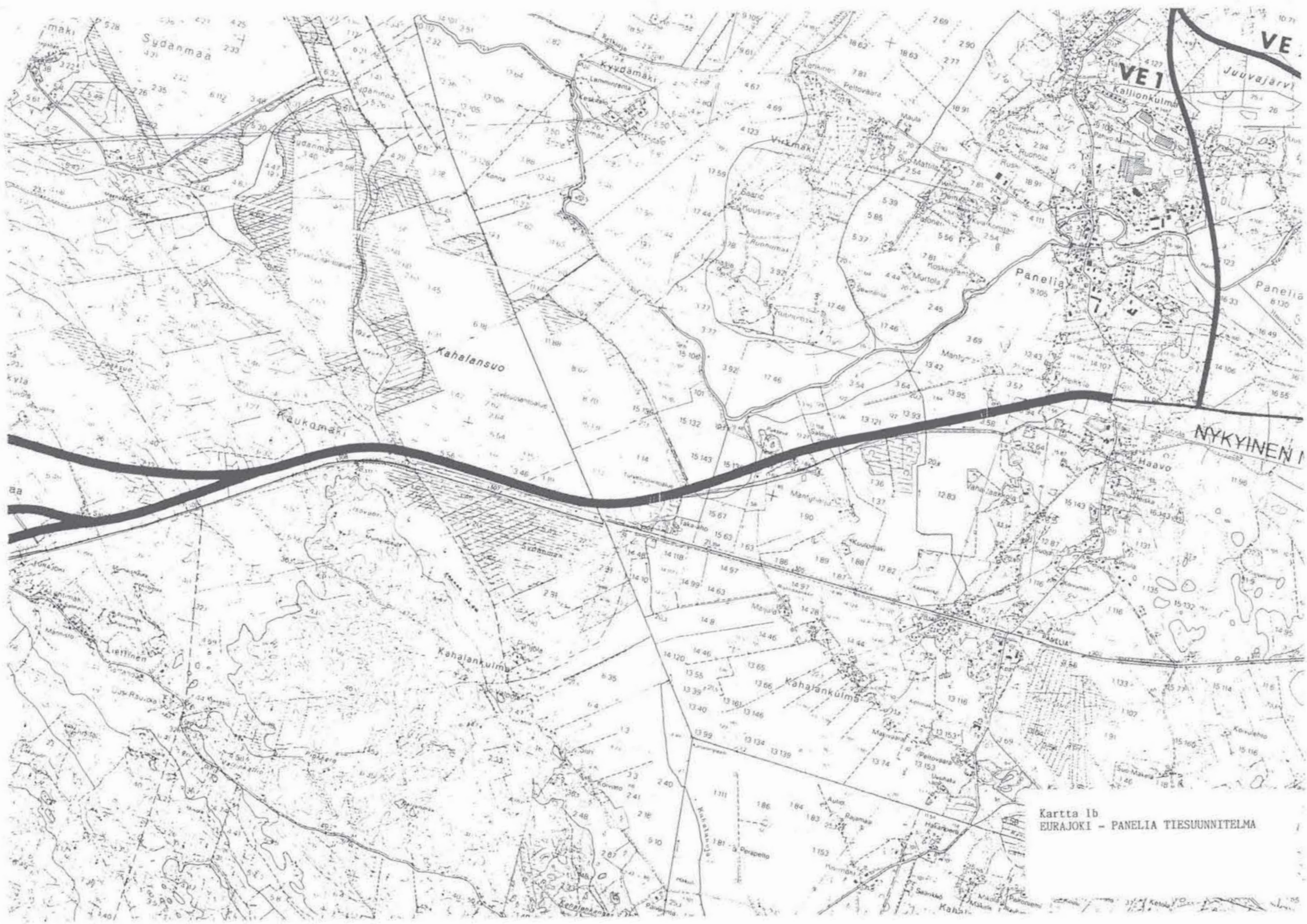
Kartta 1b EURAJOKI - PANELIA TIESUUNNITELMA