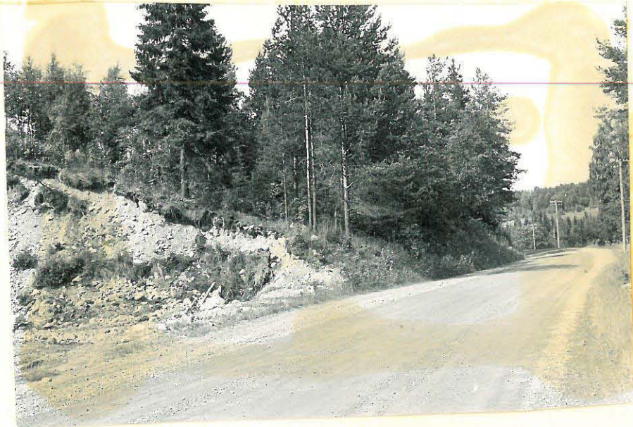
1. Mj. 7 on löytynyt vasemmalta olevasta särkästä. f. 32876