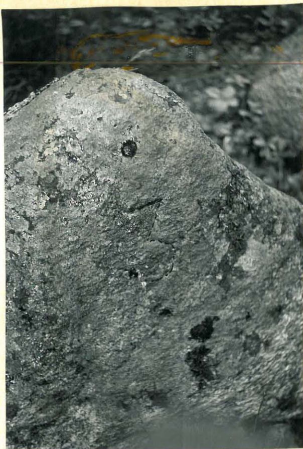
14. Öllölän niemen Suomen sodan aikuisen haudan kivi ja numero 3. f. 32889