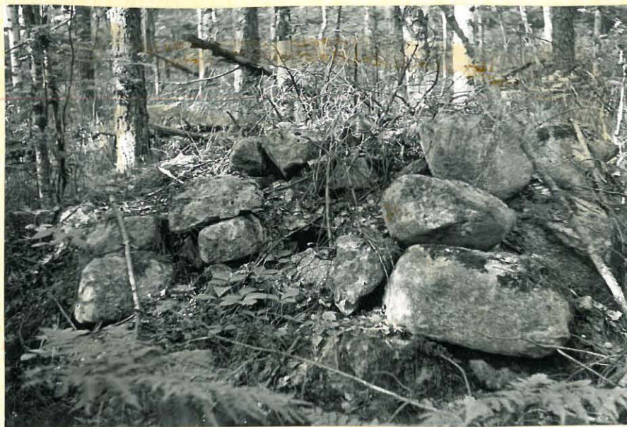
16. Öllölän niemen kiviroykkiö. f. 32888