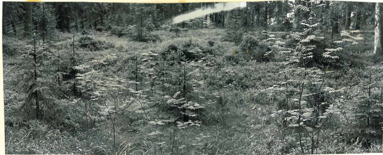
9. Pörsämäessä olera pyöreä painanne. n. 32881 - 32882