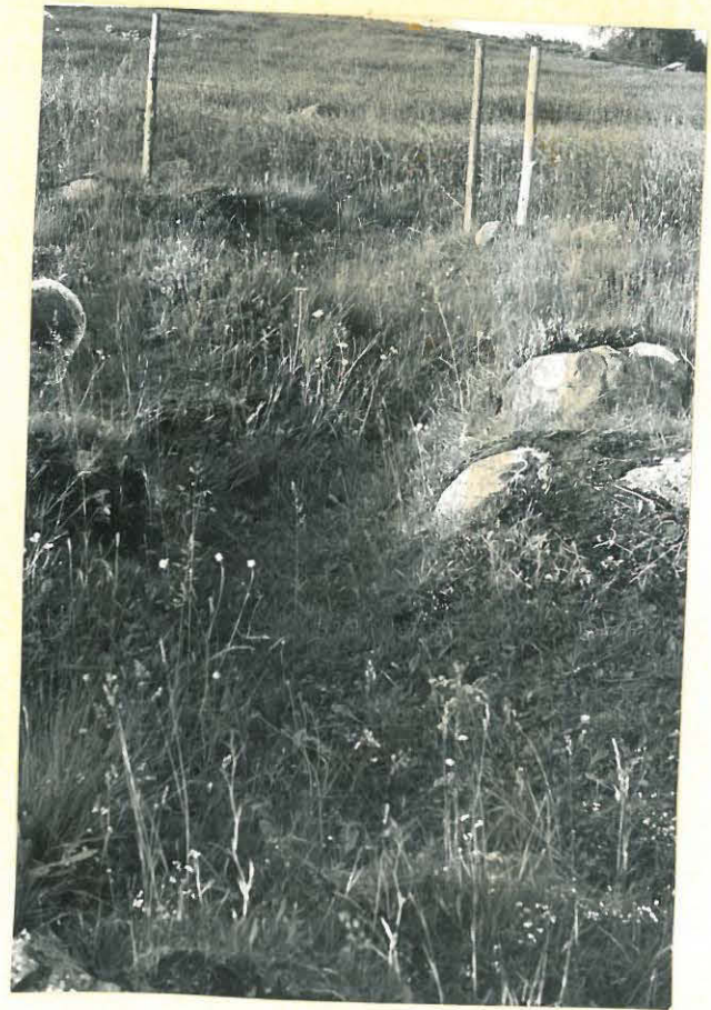
11. Hautapainanne Koveron kalmistossa. f. 32896