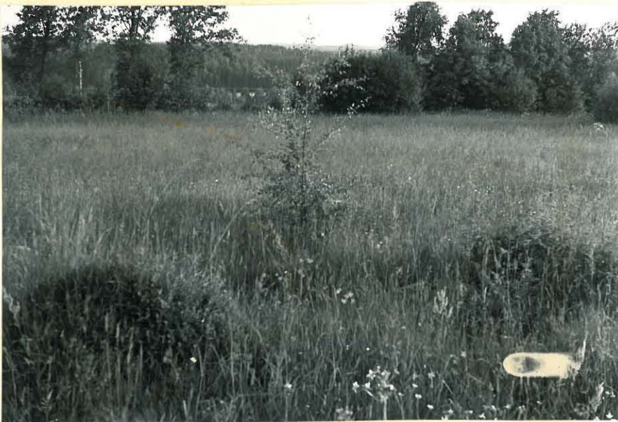
13. Tsasouнан nurkka kiviä. f. 32902