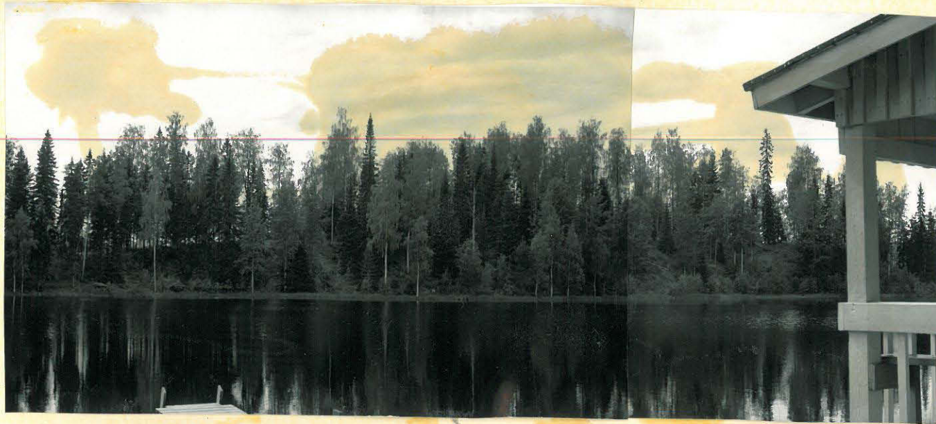
5. Siven saari pohjoisesta nähtynä. f. 32863 - 32864