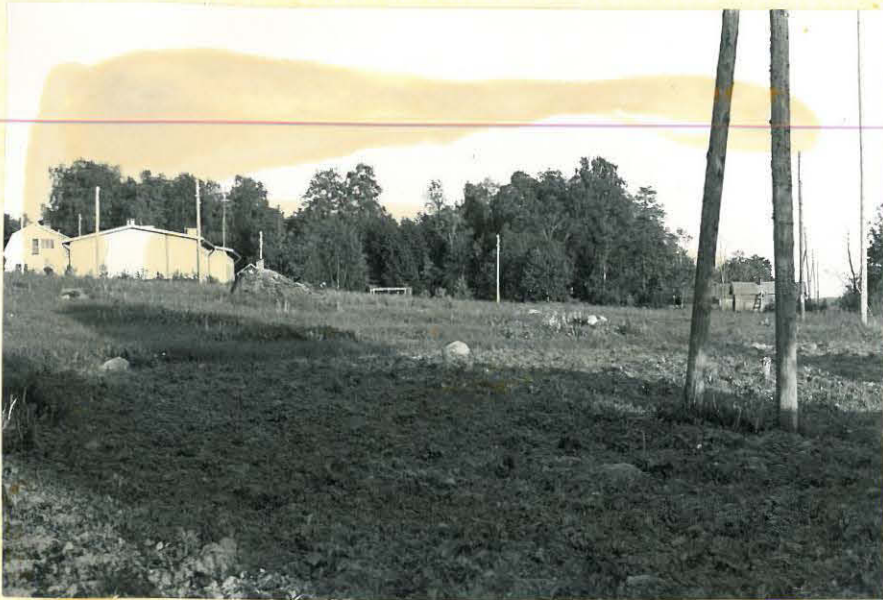
12. Koveron tsasouнан paikka f. 32895