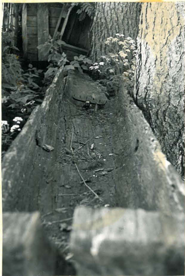
17. Pienestä Lapinjärvestä löydetty ruuhi. Etuosa on katkennut nostettaessa. Keskellä olevien reikien kautta on pantu tasa painottava riuku. \# . 32892