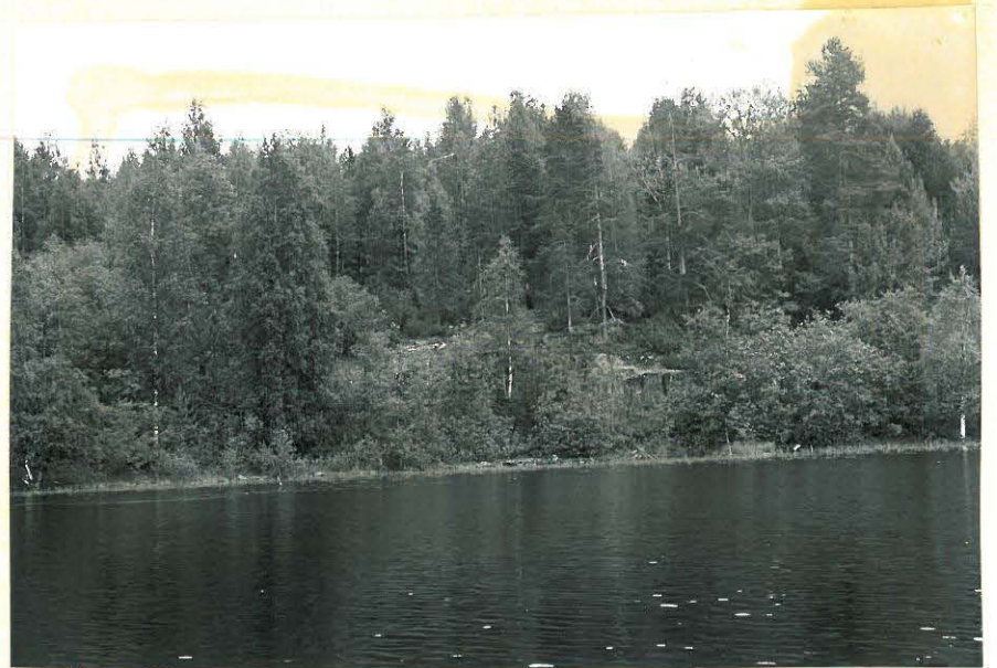
2. Malminnostopaikka Loitimojärven ja vanhin asutus- paikka Konnuniemen kylässä. f. 32870