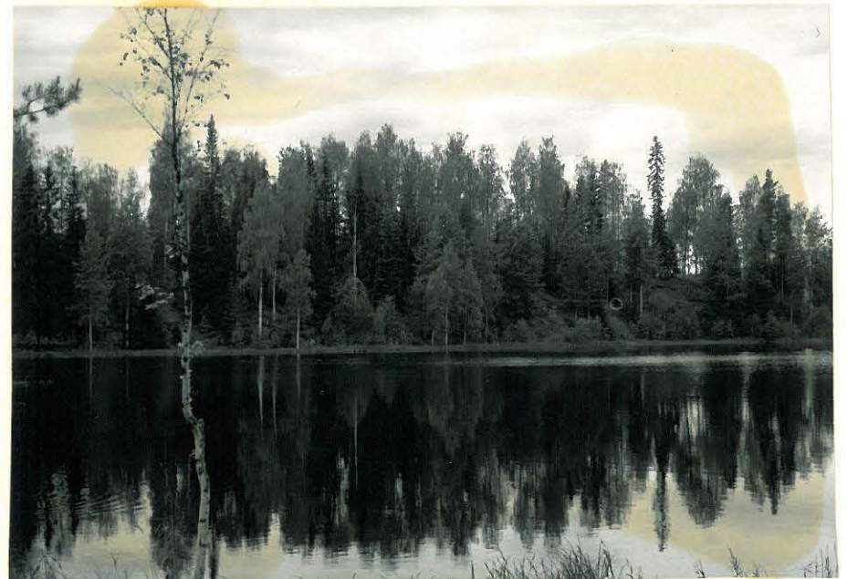
4. Suvensaari; vanhin karjalaiskalmisto koillisesta nähtynä. f. 32865