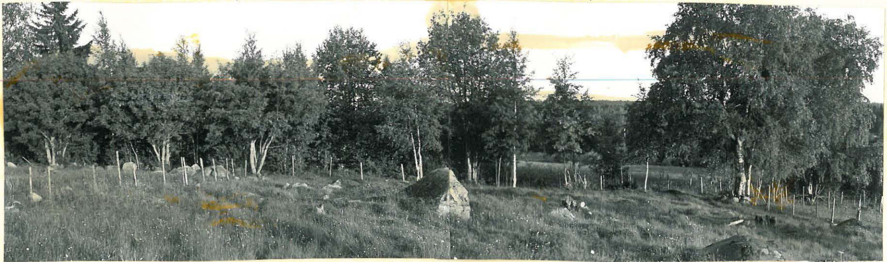
10. Koveron kylän ortodoksinen kalmisto. n. 32900 - 32907