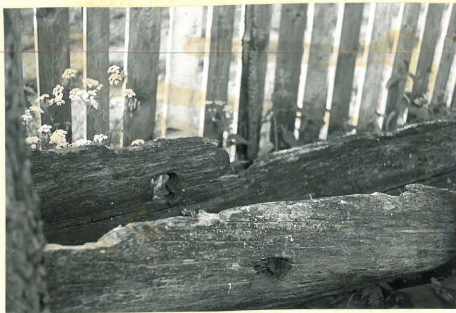
18. Lohikura ruuhen keskiosasta. \# . 32893