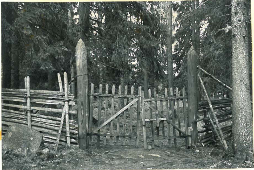
8. Pörsämäen kalmiston portti. n. 32878