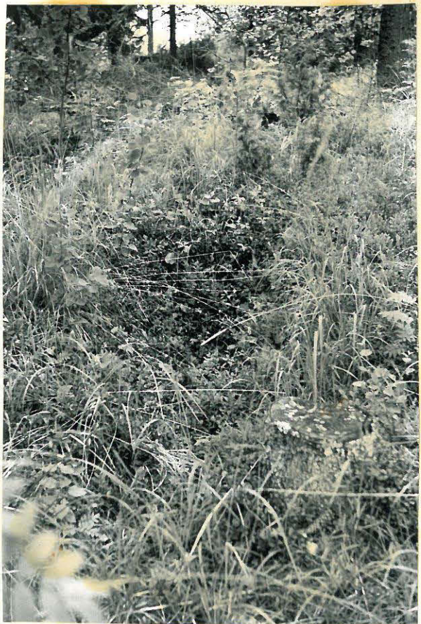
6. Hautauspaikka ilman muistomerkkiä. f. 32866