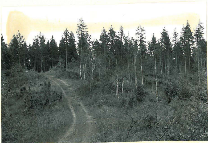
3. Surusärkkä. f. 32869