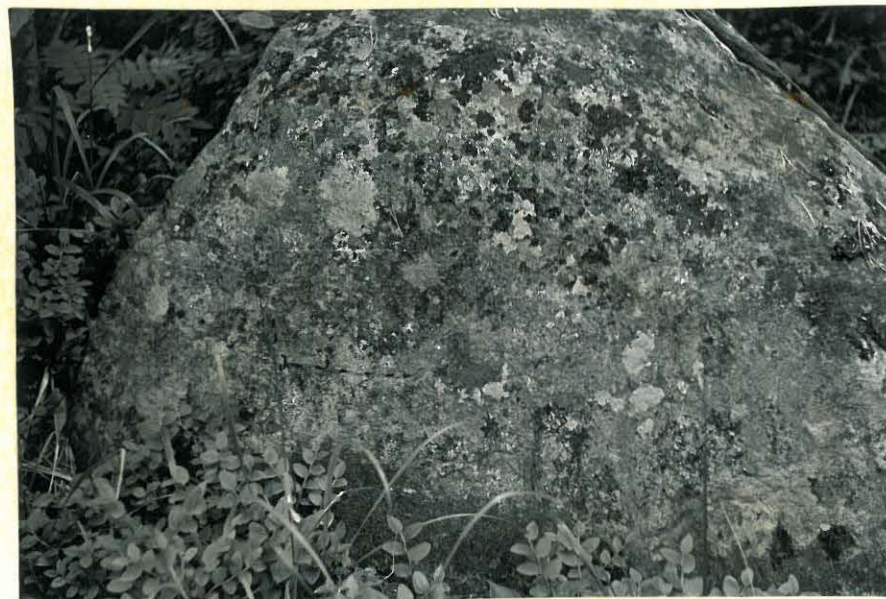
15. Öllölän niemen hautakivi ja F-kirjain. f. 32883