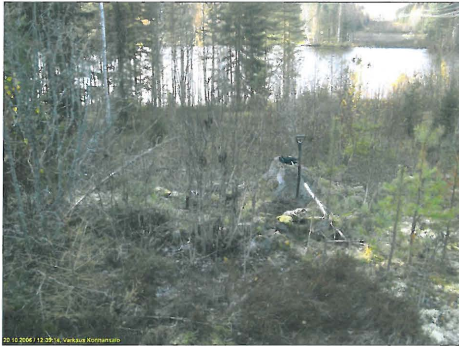
Kivirakenne pusikossa kallion päällä (lapio siinä pystyssä). Kuvattu länteen, alla pohjoisen