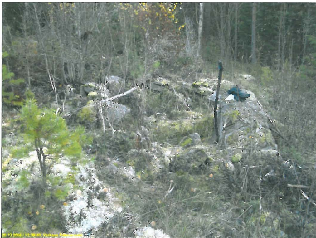
Kivirakennetta, kuvattu etelään.

Huomiot: Paikalla on avokalliolla kivirakenne, joka on suorakaiteenmuotoinen, kooltaan n. 2,5 x 2 m. Se on koottu pään kokoisista moreenikivistä. Sen sisällä on myös kiveystä, mutta reunoja matalammalla ja ne vaikuttivat muodostavan sisälle rakenteen. Rannanpuoleisella sivulla rakenteen nurkassa on muuta kiveystä isompi maakivi. Kivirakennelma vaikuttaa lapinrauniolta - sen pohjalta osin puretulta tai "täyttämättömältä" lapinrauniolta. Aivan varmasti sitä ei voi kuitenkaan lapinraunioksi todeta. Kyseessä on kuitenkin muinaisjäännös ellei sitä voida tarkemmin kaivaustutkimuksin muuksi todeta.