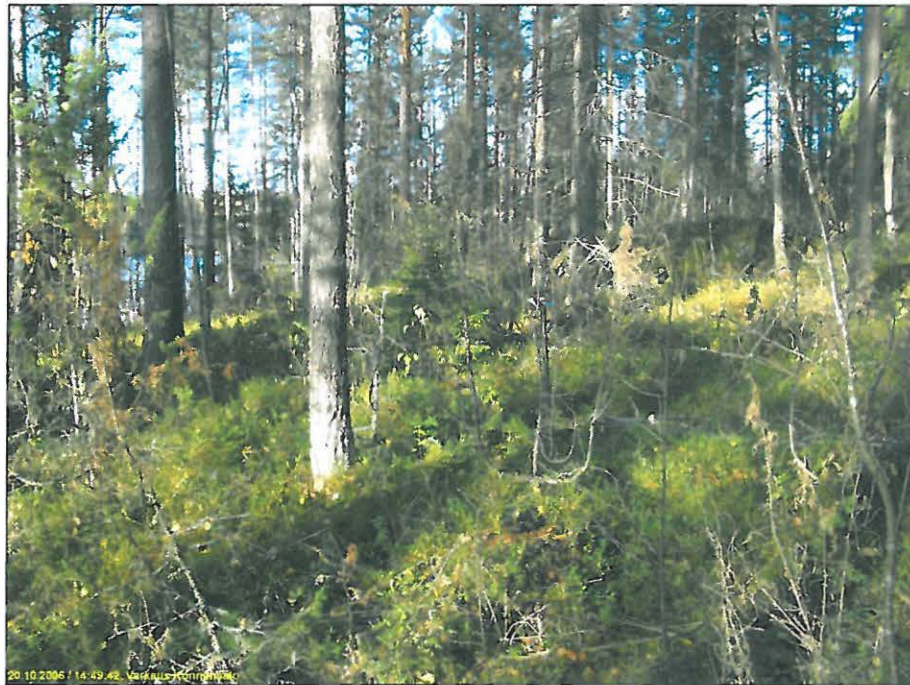
Asuinpaikkaa kuvattuna pohjoiseen.