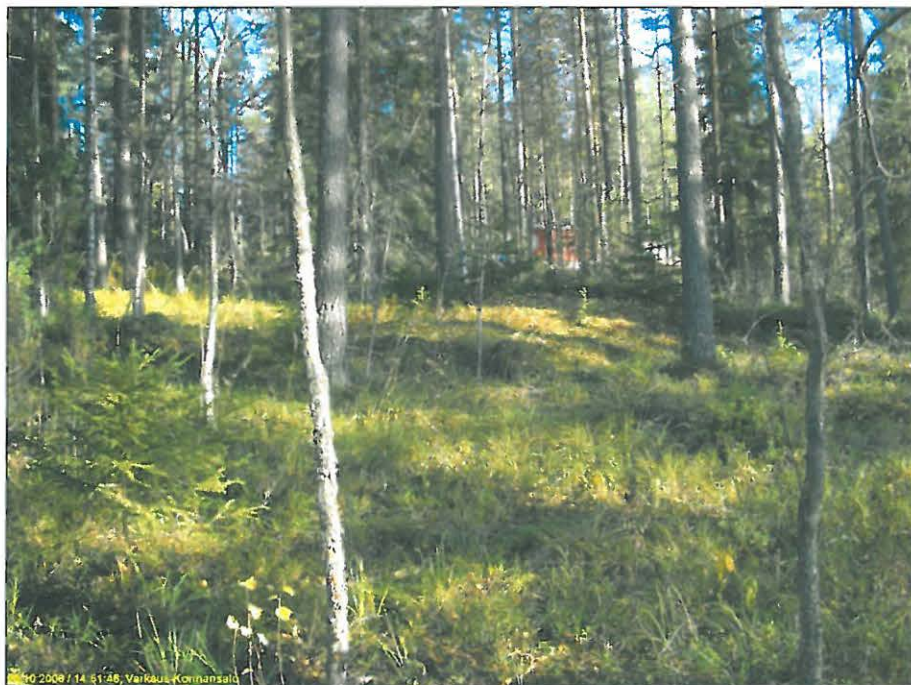
Asuinpaikka on kuvan keskellä auringonpaisteen kohdalla olevan matalan kallion päällä. Kuvattu itään.