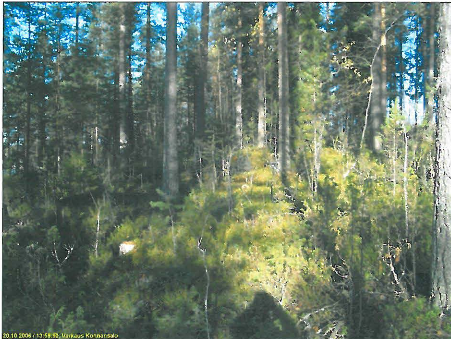
Asuinpaikkaa kuvattuna pohjoiseen.