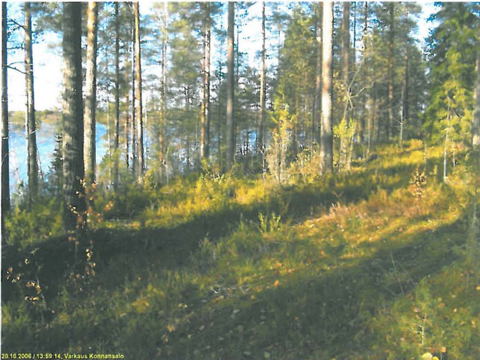
20.10.2006 / 13:59-14, Varkaus Konnasalo