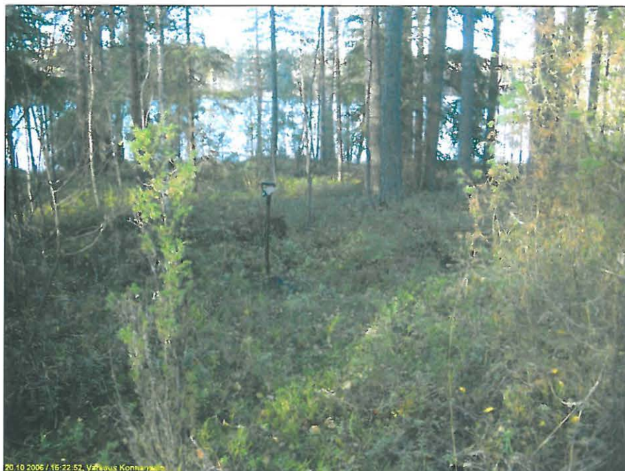
Asuinpaikkaa kuvan etualalla. Lapio löytökoekuopan kohdalla. Kuvattu pohjoiseen, alla kuvattu kaakkoon.