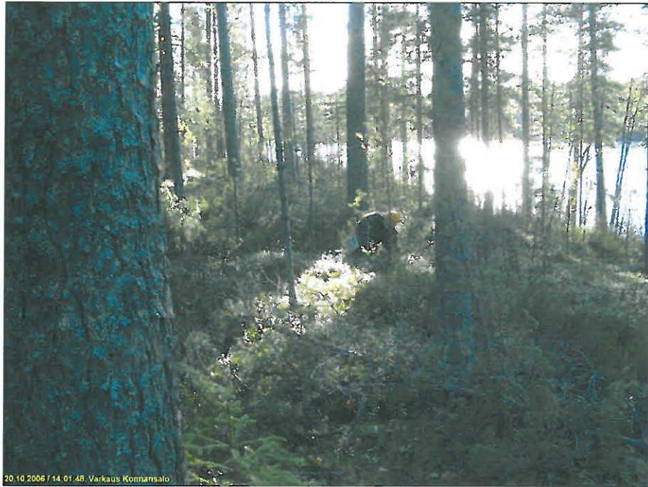
Asuinpaikkaa kuvattuna etelään. Timo Sepänmaa tutkii koekuoppaa. Alla asuinpaikkaa kuvattuna länteen.