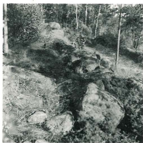
19. Uhlu. Kankkion Välimäen kivistie