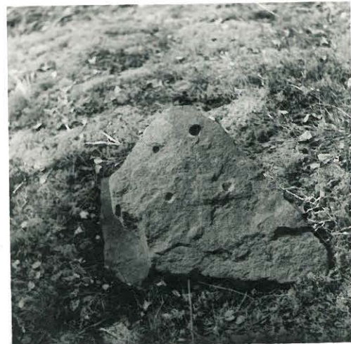
2. Kivilaaka røykkiön päässä.