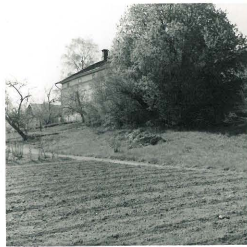
4. Kirkonkylä. Pappilanmäki.