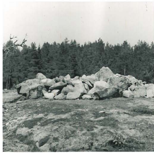
7. Piiloinen. Röykkiö III.