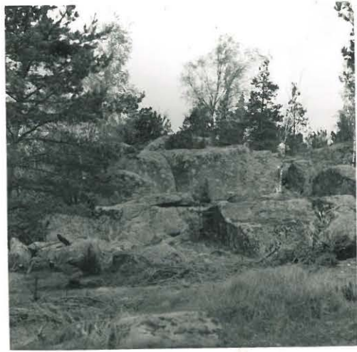
13. Lahdinko. Linnavuoren rinteitä.