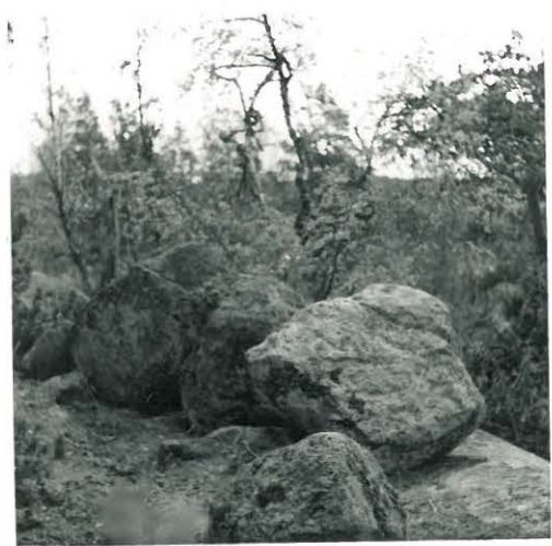
14. Lahdinko. Linnavuoren valliä.