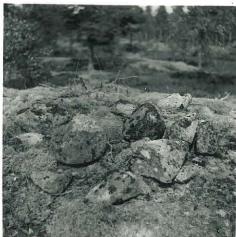
12. Huruinen. Pieni kivikasa.