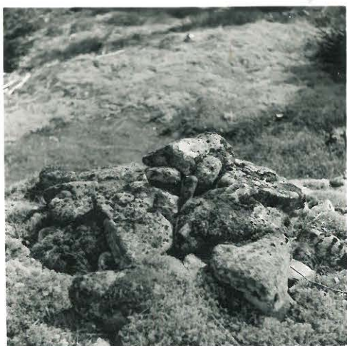
10. Huruinen. Pieni kivikasa.