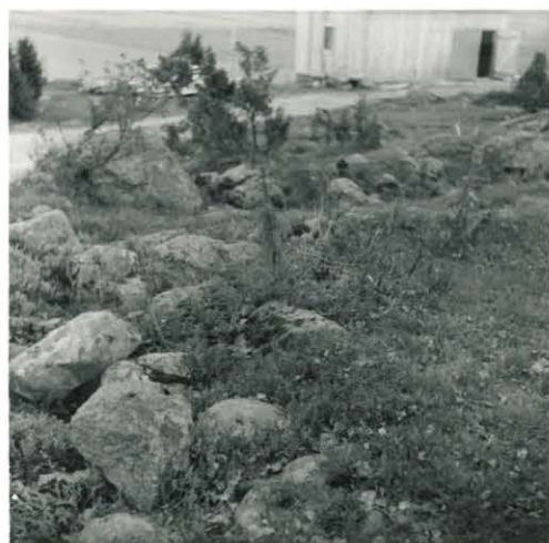
17. Laitinen. Kappel- mäen maahansortu- nutta kiviaitaa.