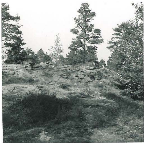
8. Huruinen. Kivikasojen sijaintipaikka etelästä