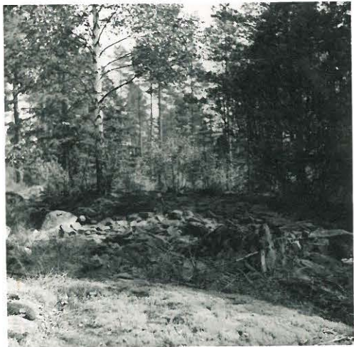
1. Kuumkallio. Røykkiö Kaarnajärven metsä- paistalla.