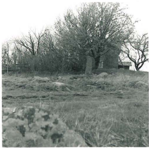
3. Lahdinko. Huolila.