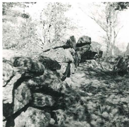
18. Nuhjala. Kirkko- mäen kivivallia.