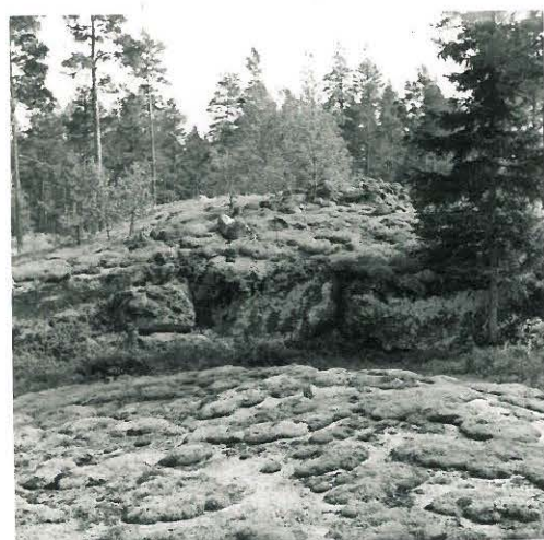
9. Huruinen. Kivikasojen sijaintipaikka pohjoisest