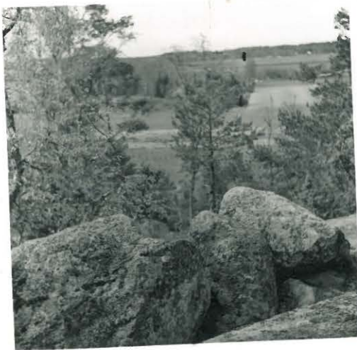
15. Lahdinko. Näkymä Linnavuorelta.