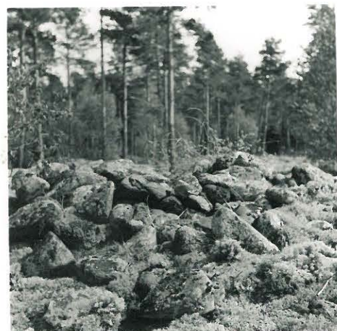
11. Huruinen. Suurin kivikasa.