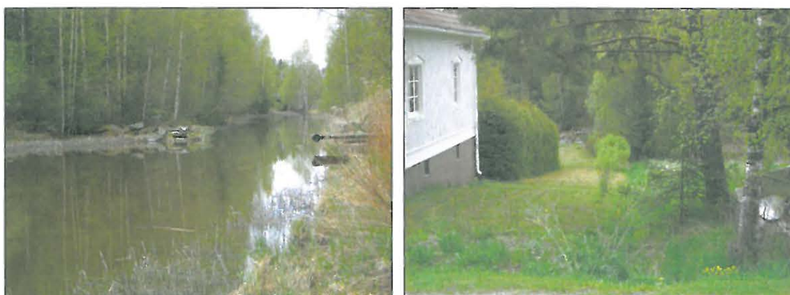
Kuvassa vanhan sillan kiviarkun rauniot (isojakokartalla itäisempi silta) ja oikealla sama kylätietä kuvattuna – vanha sillalle menevä tie nyt nurmikkona.