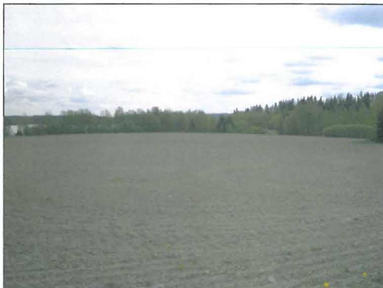
Tutkimusalueen peltoa kuvattuna kylätontin pohjoispuolelta itä-kaakkoon. Alla kuvattu itään kylätontin keskeltä. Tien molemmin puolin vanhaa kylätontin aluetta.