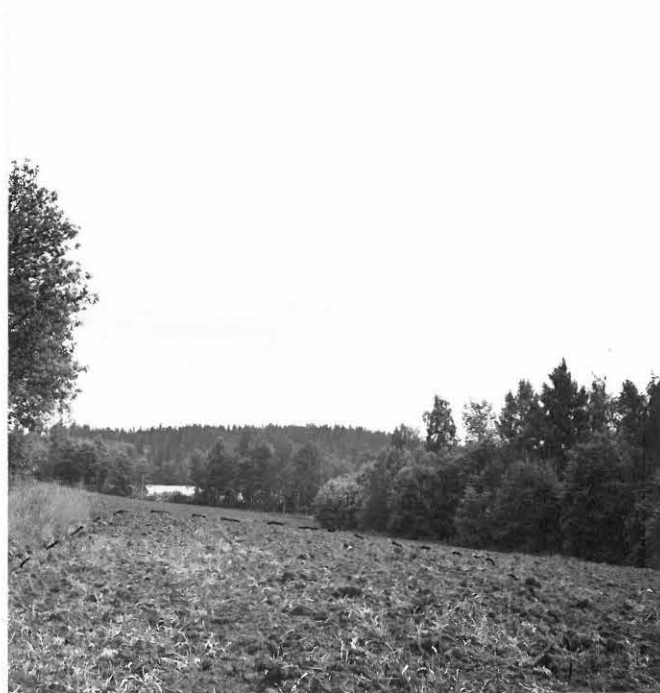
f. 31633 Ratilan asuinpaikka. Taustalla Oravalanlampi.