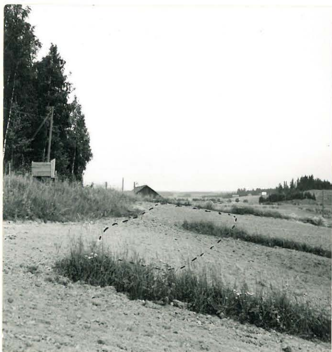
f. 31617. Itämaen kivikautinen asuinpaikka