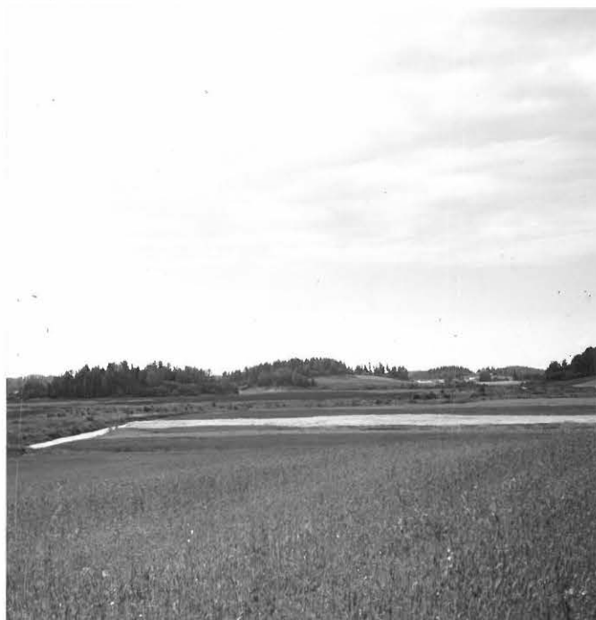
f.31627 Näkymä Kolkan asuinpaikalta Kirjavalle päin