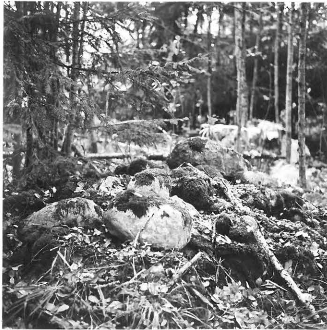
f. 31646 Holman tilan itäpuolella oleva kiviraunio