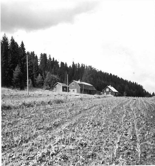
f. 31624 Jokisuun kivikautinen asuinpaikka Hiidenvedettä päin