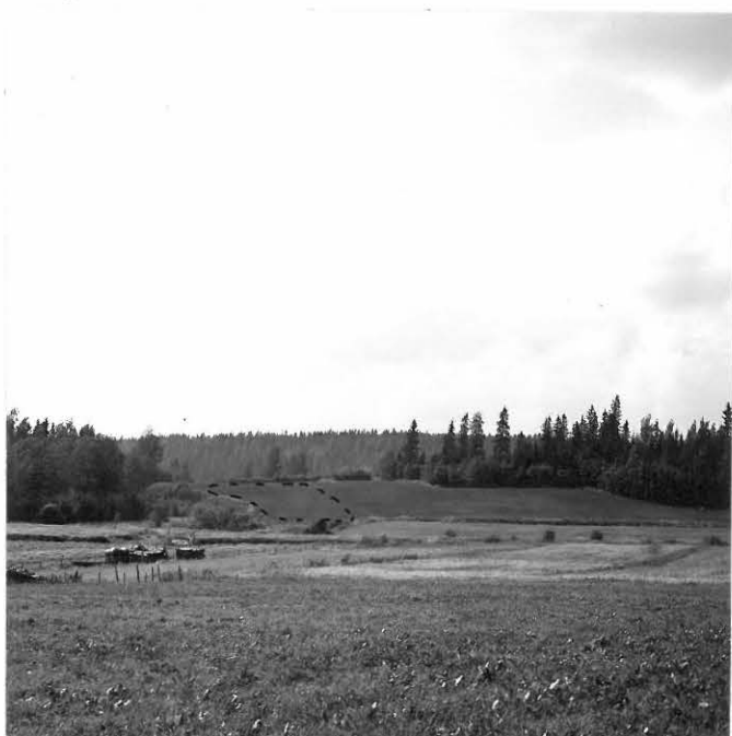
f. 31634 Veikkolan kivikautinen asuinpaikka Kaukoilan puolelta nähtynä