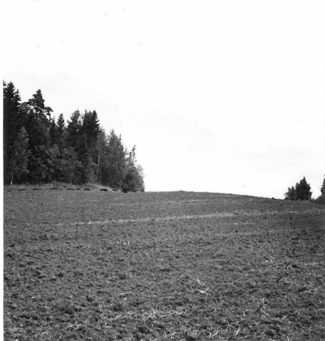
f. 31632 Ratilan kivikautinen asuinpaikka Tarttilansalmesta päin