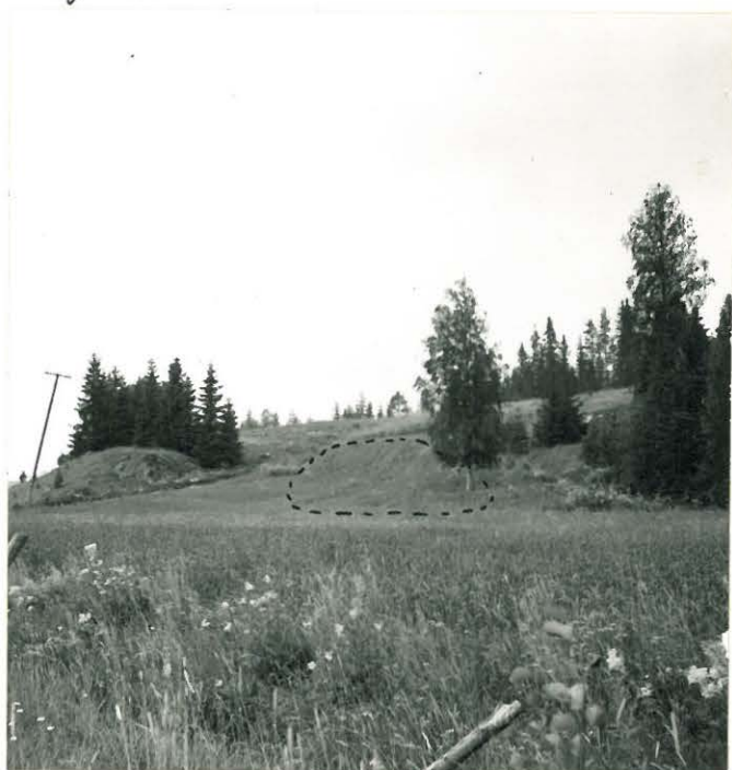
f. 31618. Vaahteramaen kivikautinen asuinpaikka