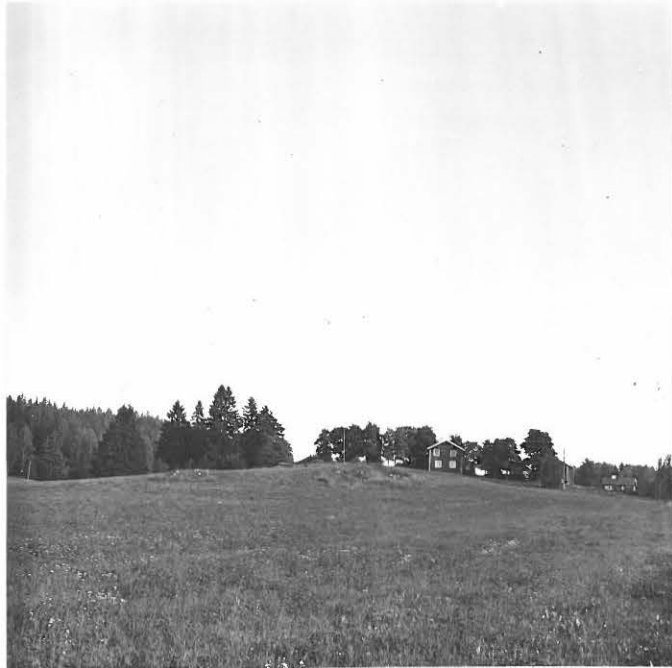
f. 31640 Fästin mäki pohjoisesta päin