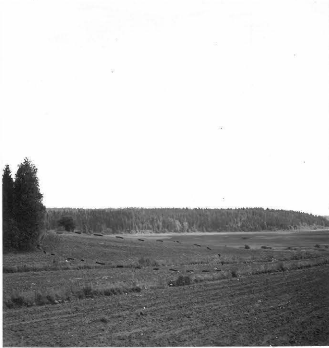
f. 31629 Purhaanmäen kivekautinen asuinpaikka. Taustalla Kirjava.