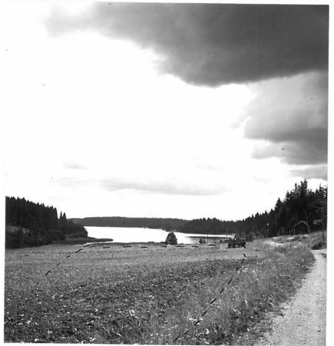
f. 31625 Jokisuun asuinpaikka pohjoisesta päin