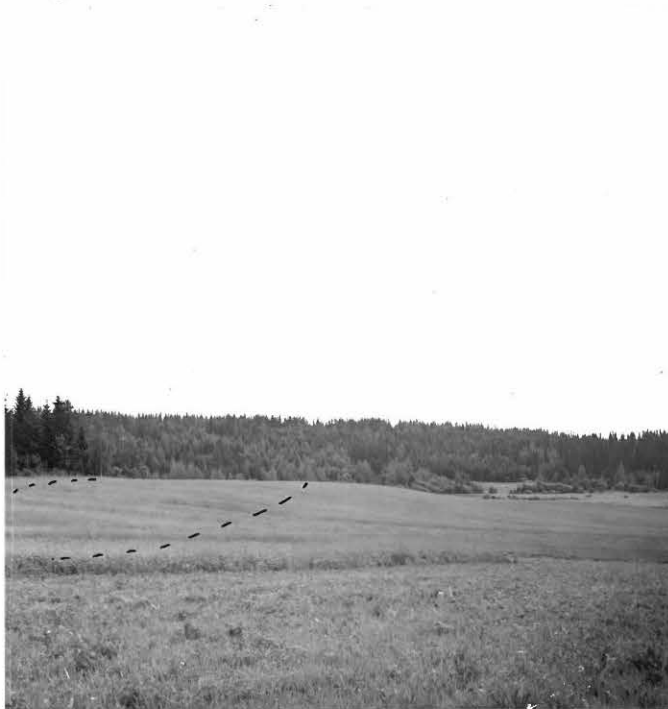
f.31628 Myllysilän kivikautinen asuinpaikka