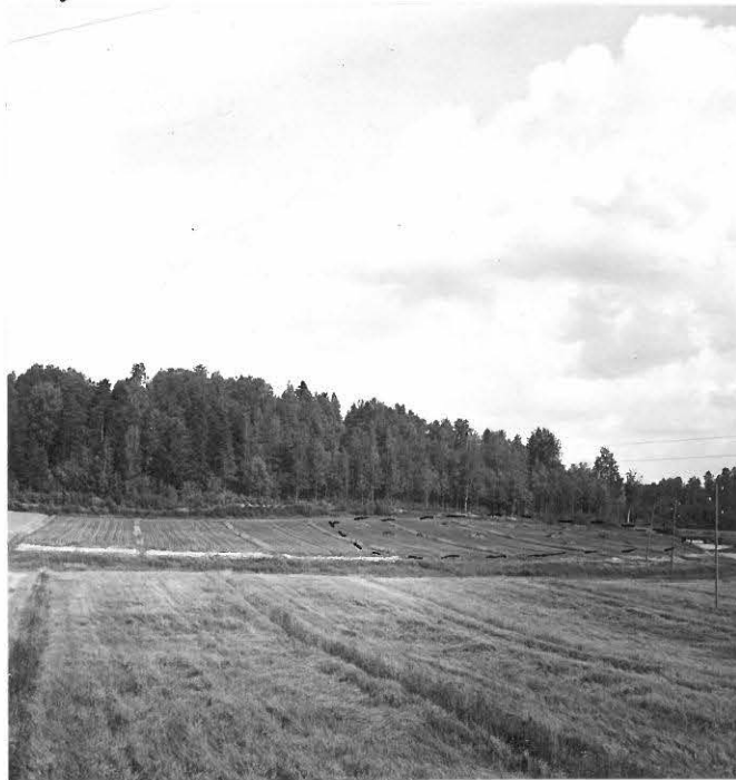
f. 31631 Sipilän Saarenperän kivekautinen asuinpaikka