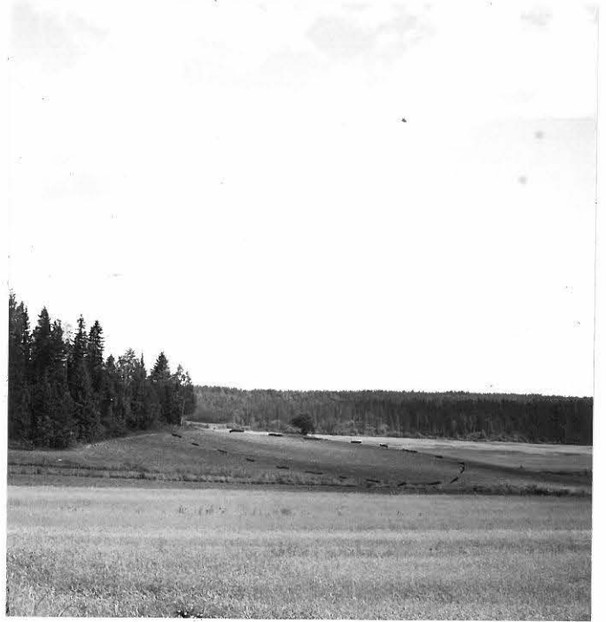
f. 31630 Purhaanmäen asuinpaikka