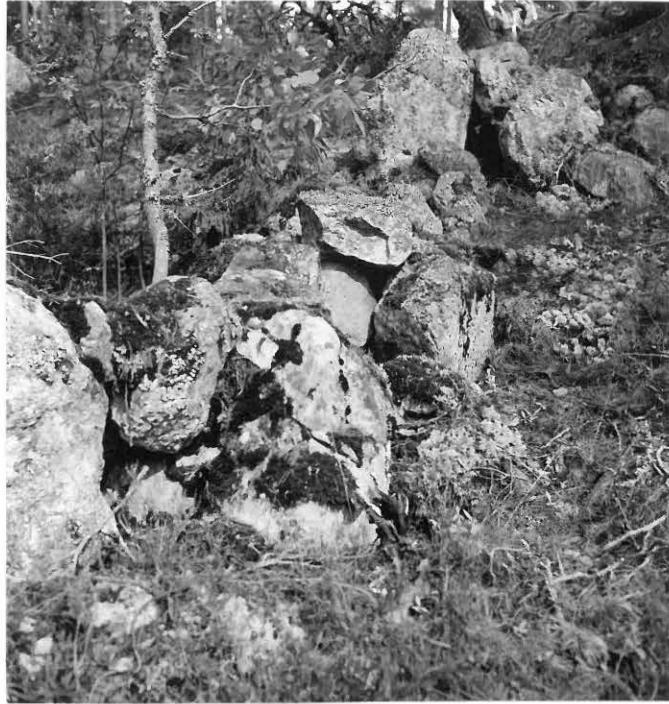
f. 31637 Kivivalli Reunan maalla