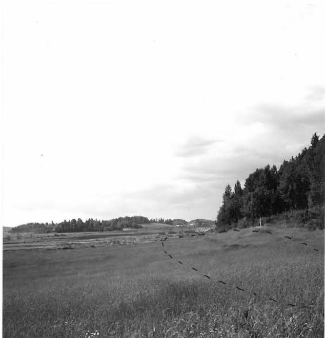
f.31626 Kolkan kivikautinen asuinpaikka