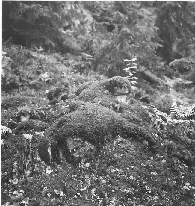
f.31636 Kiviraunio Hovin maalta