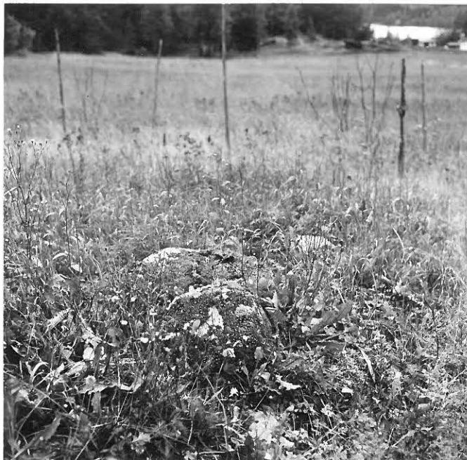
f. 31648 Kiviröykkiö Haudanniemestä. Taustalla Poikkipuoliainen.