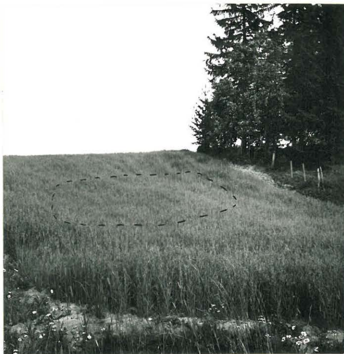
f. 31616. Lautan kivikautinen asuinpaikka