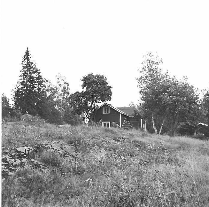
f. 31647 Haudanniemi lännestä päin