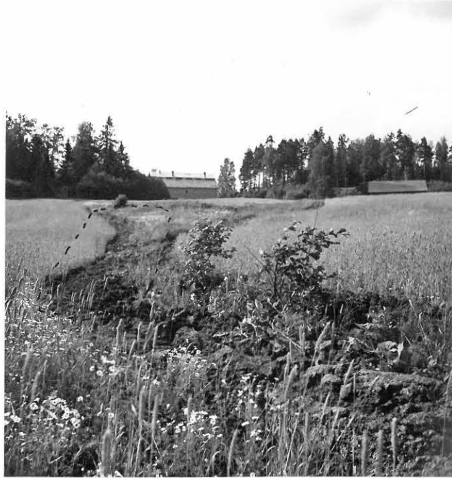
f. 31623 Ryönän kivikautinen asuinpaikka