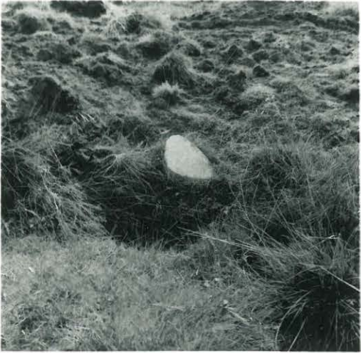
Partokankaassa oleva hisinkivi