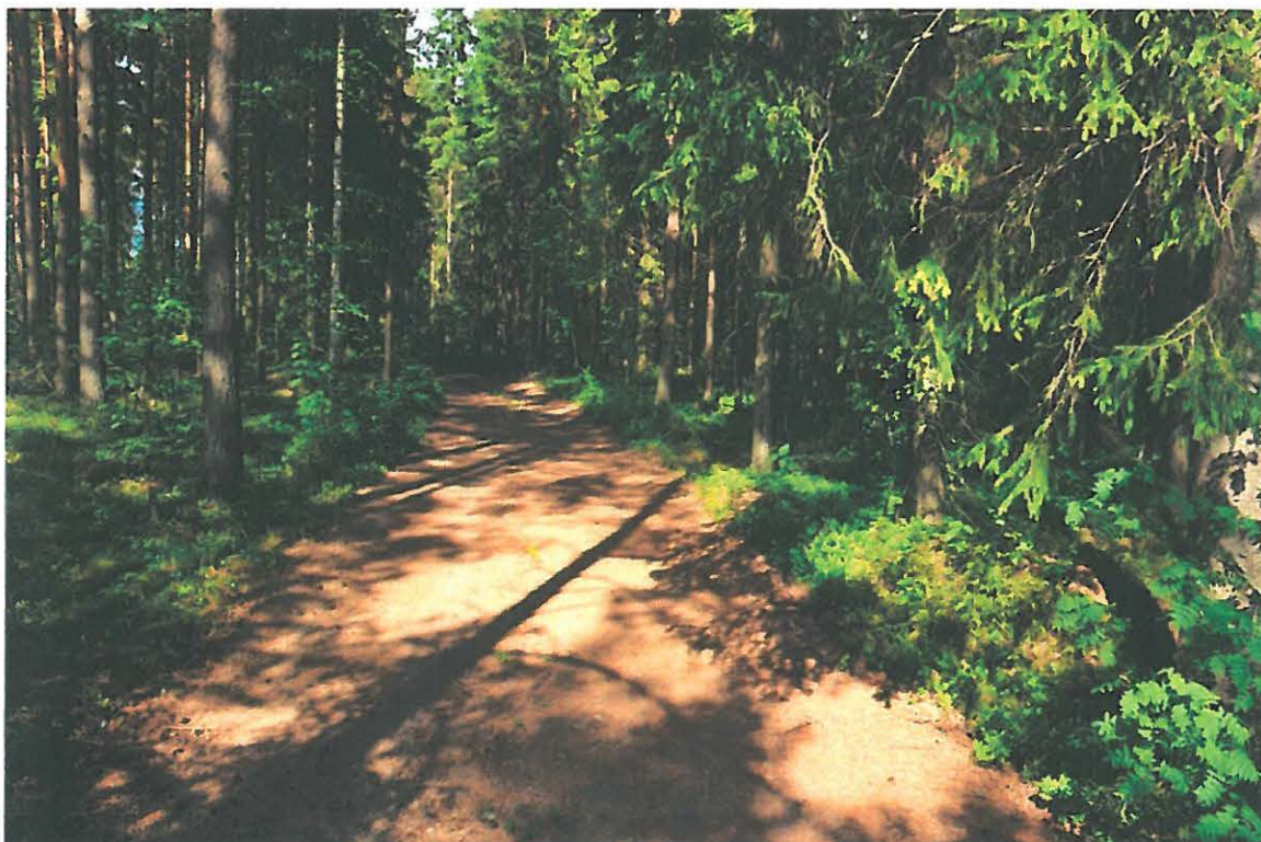
Kuva 2. Kokkolan asuinpaikalle tehtiin koepistoja hiekkatien molemmin puolin. Asuinpaikan olisi aiempien tietojen mukaan pitänyt sijaita metsässä tien molemmin puolin. Mitään asuinpaikkaan liittyvää paikalta ei kuitenkaan havaittu. Kuvattu lounaasta. (DG1327:1)