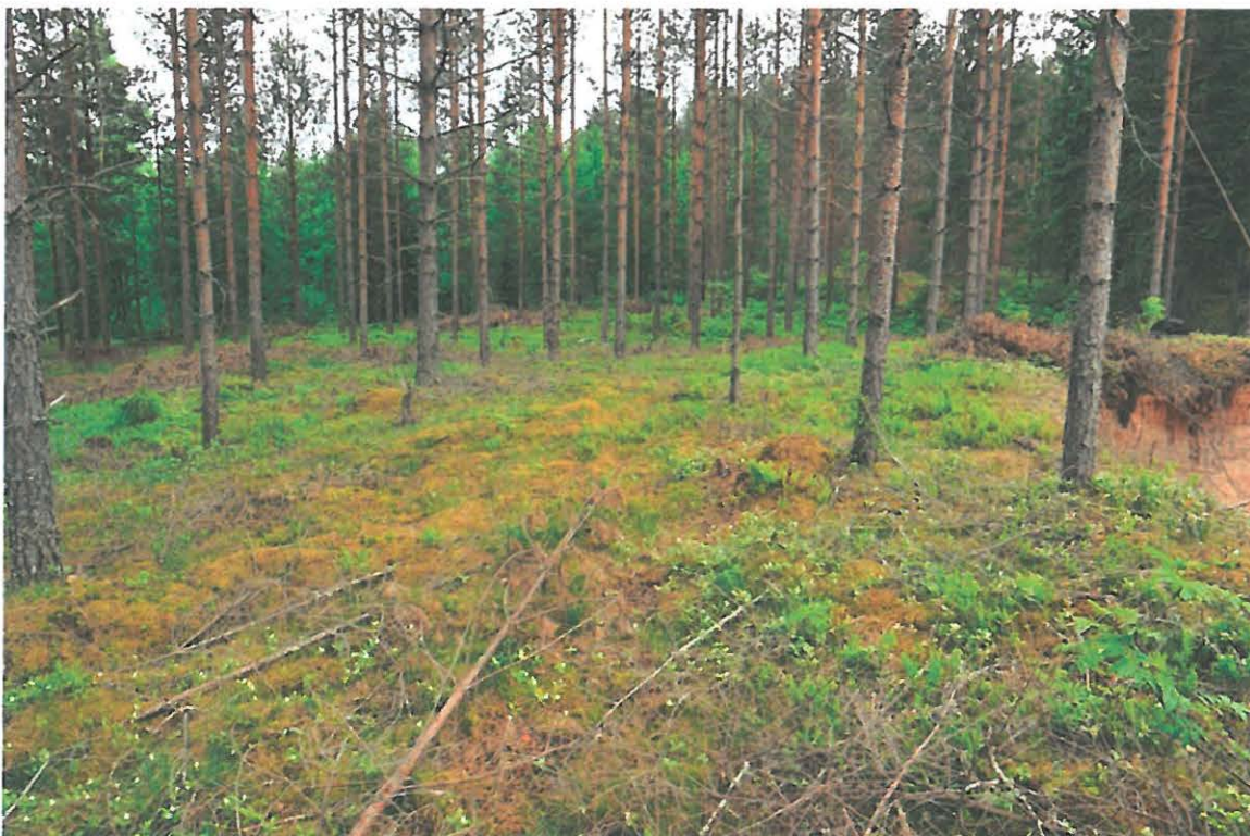
Kuva 1. Koekuopitettua aluetta Karpankankaan pohjoisosassa tielinjauksen kohdalla. Kuvattu pohjoisesta. (DG1323:1)