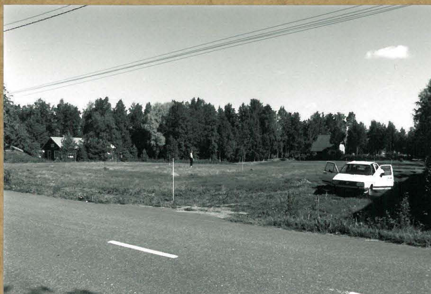
f. 101381 Lukkarinlahden kaivausalue, kuv. etelästä