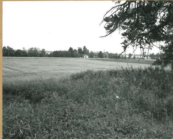
f. 72591 kuva 3 Yleiskuva Hauta-ahosta Alajärven suuntaan, kuvattu länsilounaasta.