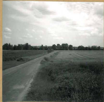
f. 72590 kuva 2 Yleiskuva Hauta-ahosta Alajärven suuntaan, kuvattu lounaasta.