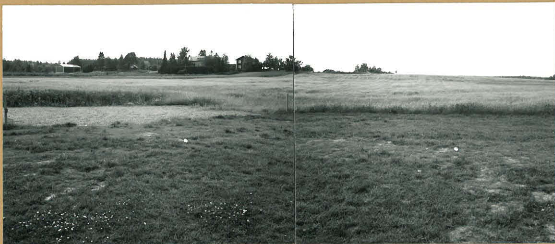
f. 72592-3 kuvat 4-5 Yleiskuva Hauta-ahosta, kuvattu uimarannalta pohjoisesta.