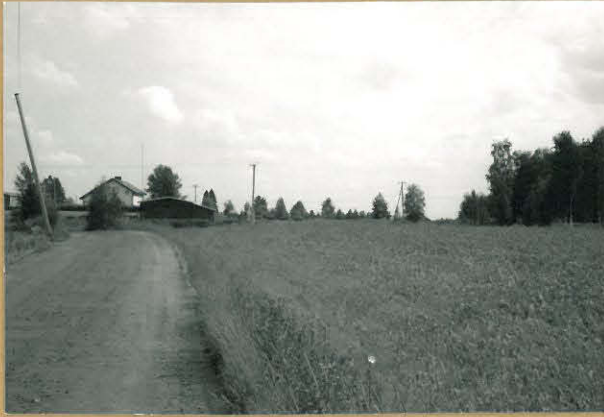
f. 72589 kuva 1 Yleiskuva Timmerbackasta, kuvattu lounaasta.