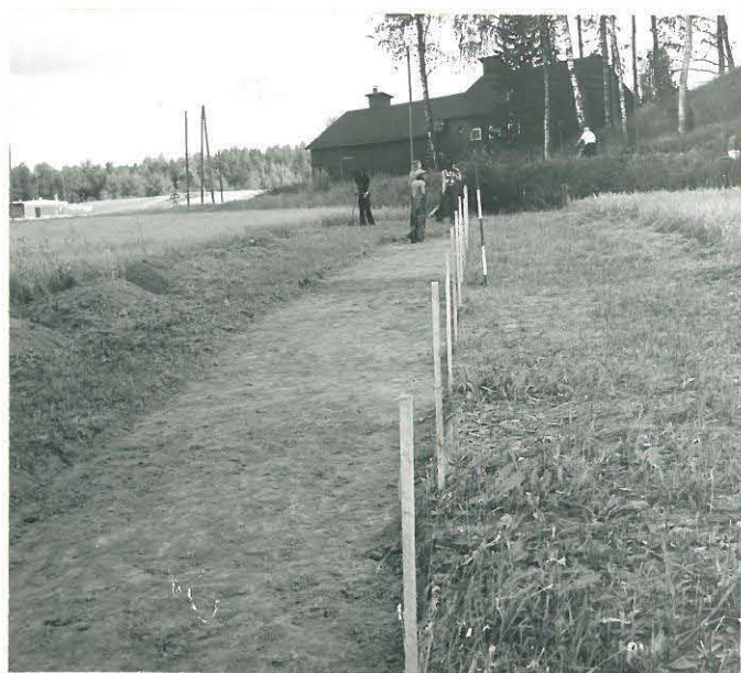
KUVA 2. YLEISKUVA GRINDINPELLOSTA. TAUSTALLA VASEMMALLA MUUNTAJANMÄKI, ETUALALLA PORVOONJOKI. KUVA OTETTU LÄNNESTÄ.