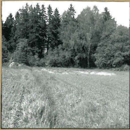
f. 85772 Myllyluoman tontin kaivausalue etelästä.