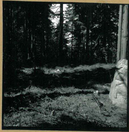
f. 85774 Mattilan tontin kaivausalue idästä