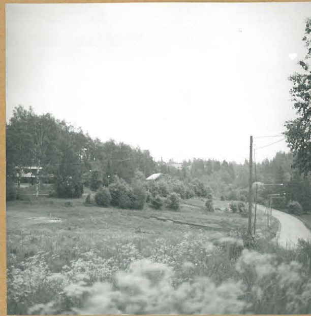
2. Yleiskuva kaivaus- alueesta; kuva idästä