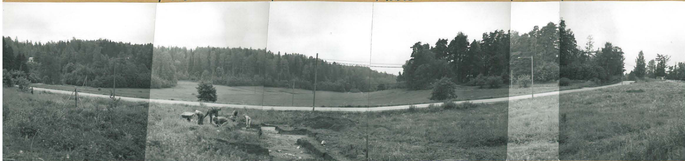
1. Panoraama kaivausalueesta. Kuva pohjoisesta.