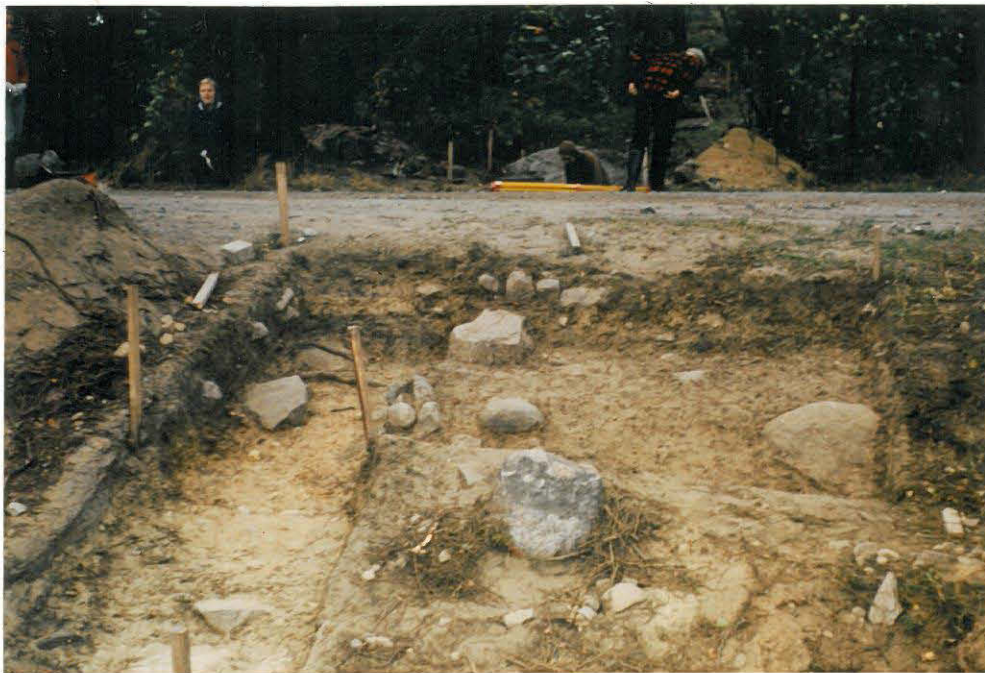
Kaivausalue nähtynä lännestä