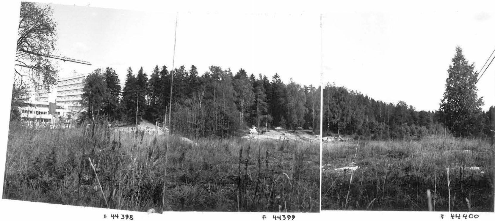
Kaivausalue nähtynä lännestä