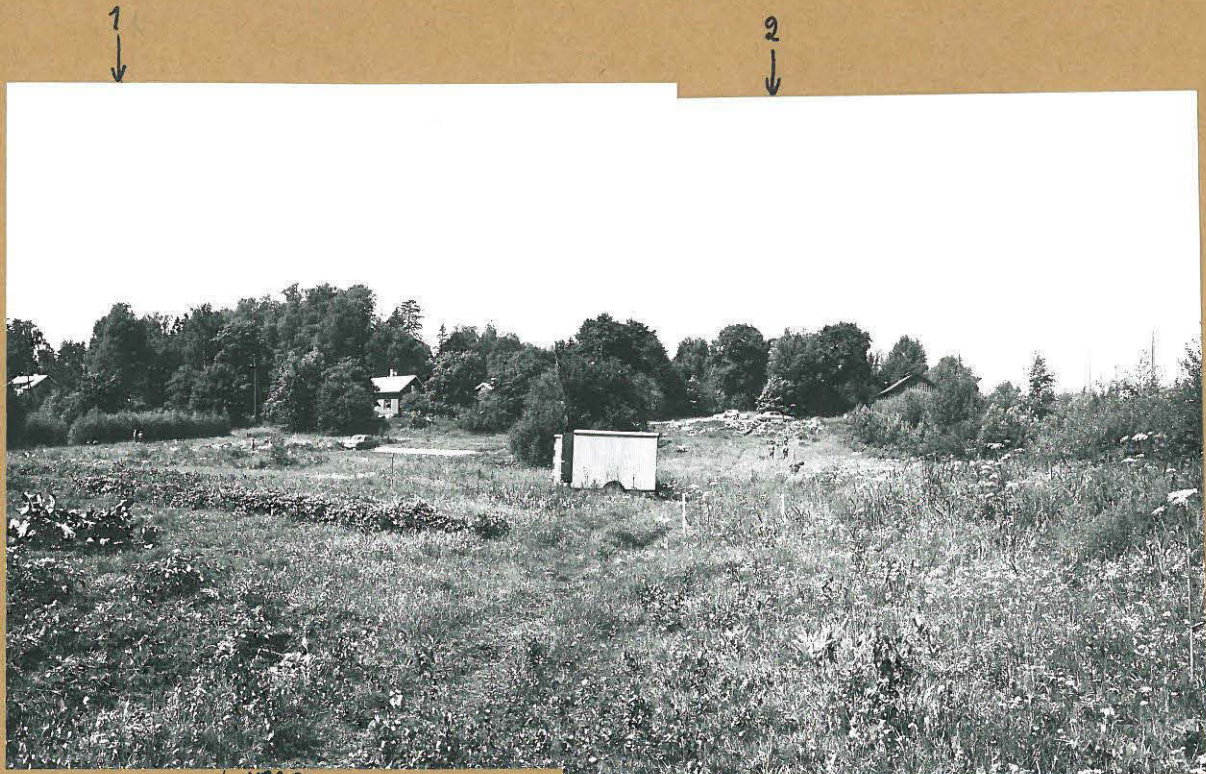
+ 49280 PANORAAMA EPINEDLIITTISELTA ASUINPAIKALTA (ALUE 1) LUOTEESEEN. + 49281 TAUSTALLA TALOJEN EDESSÄ ISO MAANTIE. OIKEALLA OLEVA PEN- SAIKKO SEURAKUNNAN ALUETTA. KESKELLÄ KAIVAUKSEN TYÖ- MAKKOPIT. NUOLEN 1 KOHDALLA KAIVETAAN KOEJAA IX, NUOLEN 2 KOHDALLA KOEJAA VIII