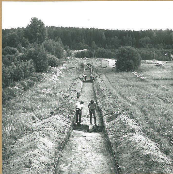
+ 49282 KUVA ISOLTA MAANTIETÄ KAAKKOON EPINEDLIITTISEN ASUINPAIKAN (ALUE 1) SUUNTAAN. VASEMMALLA NÄKYVÄ PENSAIKKO SEURAKUNNAN ALUETTA. TAUSTALLA METSÄÄ ESPOONJEN ETELÄPUOLELLA. KUVAN KESKELLÄ KAIVETAAN KOEJAA VII, TAKANA VASEMMALLA KOEJAA I JA OIKEALLA AUTON TAKANA KOEJAA II.