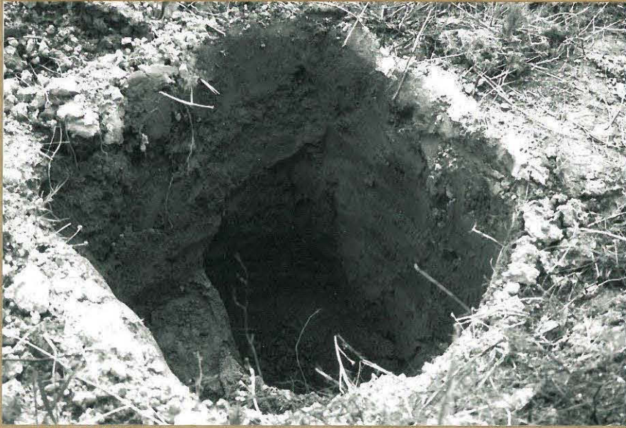
F. 106204 KUVA 3: PELLON KOUNAISOSAN KOEKUOPPA. PELTON MULLAN ALAPUOLELLA OLI 60CM SAVUA.