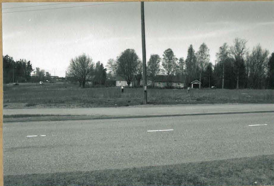
F. 106198 KUVA 3 : PAIKKA, JOSTA ON AIKUISEMPIA INV.-LÖYTÖJÄ, KUVATTU ETELÄKAAKOSTA.