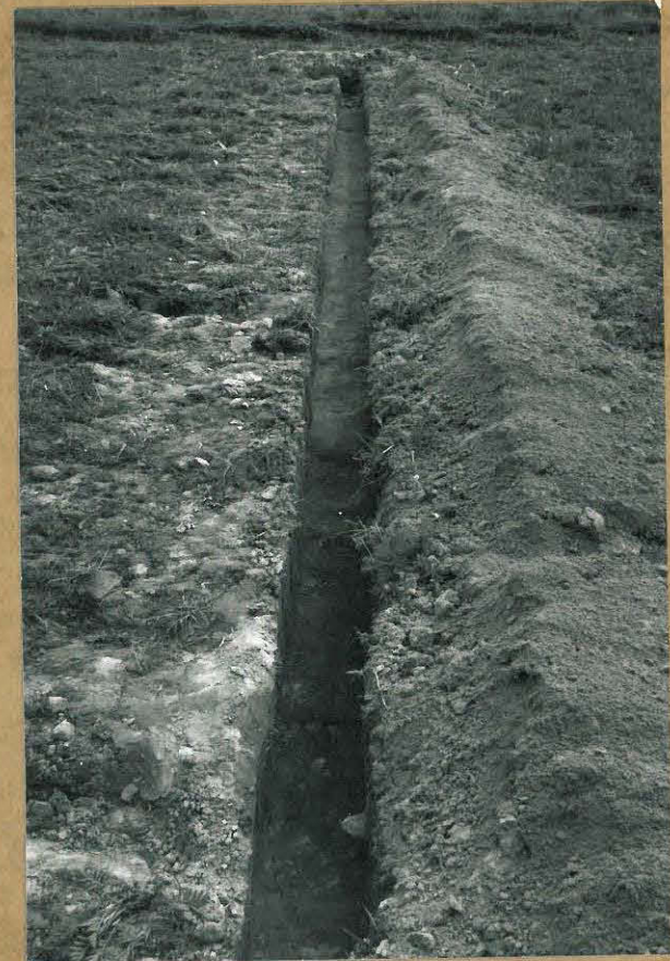
F. 106205 KUVA 10: PELLON ETELÄPÄÄN KAPEA KDEOJA. PELTONMULLAN ALLA OLI NOITTAIN PUHDASTA RUSKEAA HIEKKAA, KUVATTU POHJOISKOILISESTA.