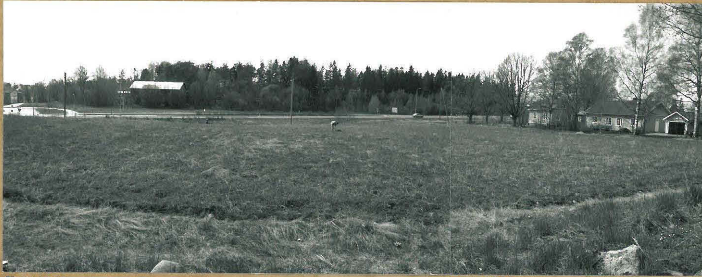
F. 106196 F. 106197 KUVAT 1-2 : TUTKIMUSALUE, KUVATTU KOILLISESTA JA KAAKOSTA.