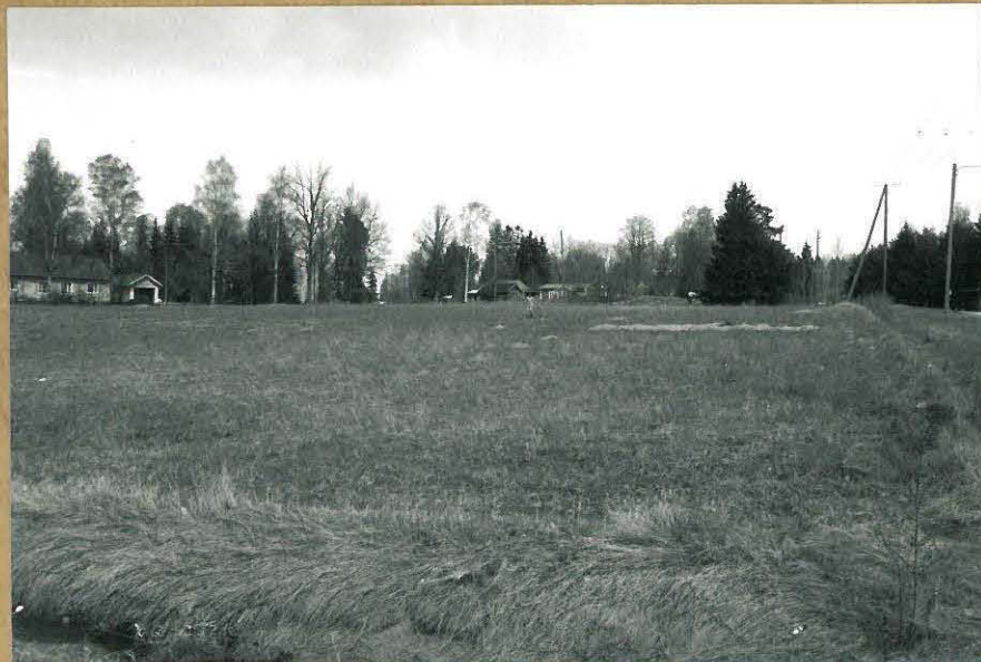
F. 106200 KUVA 5: PAIKKA, JOSTA ON AIKAISEMPIA INV.-LÖYTÖJÄ, KUVATTU ETELÄLÖUNASTA.