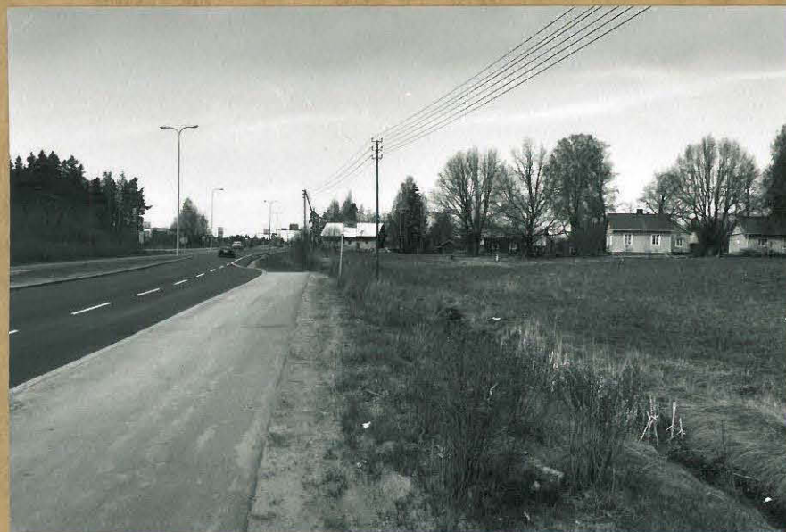
F. 106202 KUVA 7: TUTKIMUSALUEEN LUOTEISOSAA, KUVATTU ETELÄSTÄ.