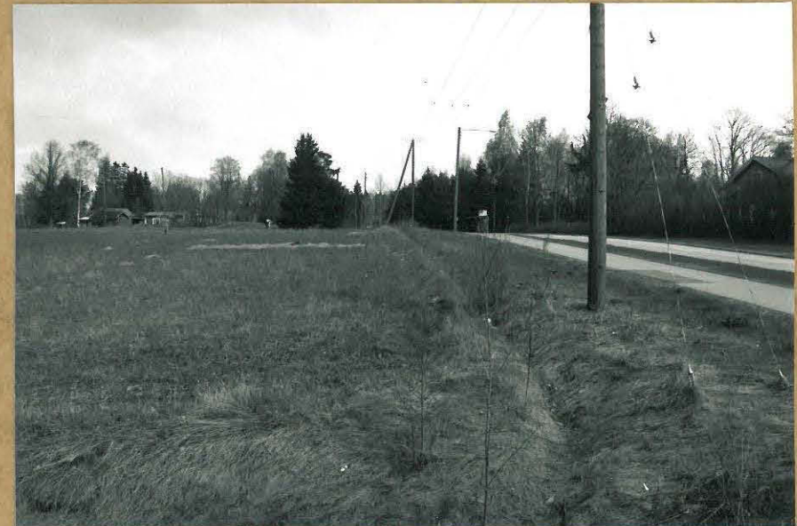
F. 106199 KUVA 4 : PAIKKA, JOSTA ON AIKUISEMPIA INV.-LÖYTÖJÄ, KUVATTU ETELÄLÖUNASTA.