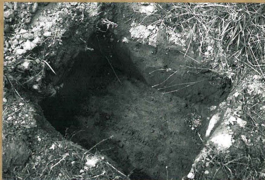
F. 106203 KUVA 8: PELLON KAARKOISOSAN KOEKUOPPA. PELTUMUL- LAN ALAPOOLELLA OLI SAVERI.