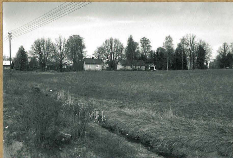
F. 106201 KUVA 6: TUTKIMUSALUEEN LUOTEISOSAA, KUVATTU ETELÄSTÄ.