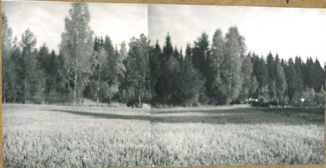
83248-40 YLEISKUVA KAIVAUksen ALUEEN Sijainnista, kuvattu etelästä