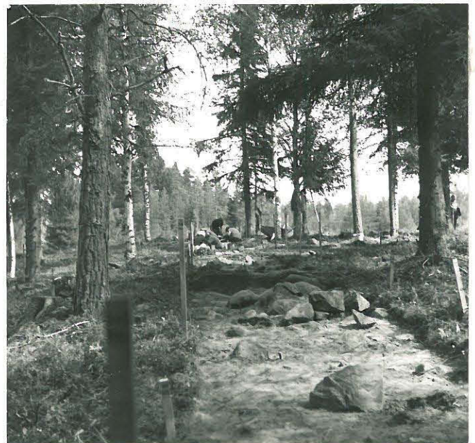
6. RUUDUT 300328-300330 KUVATTU LOUNAUSTA. F. 46241