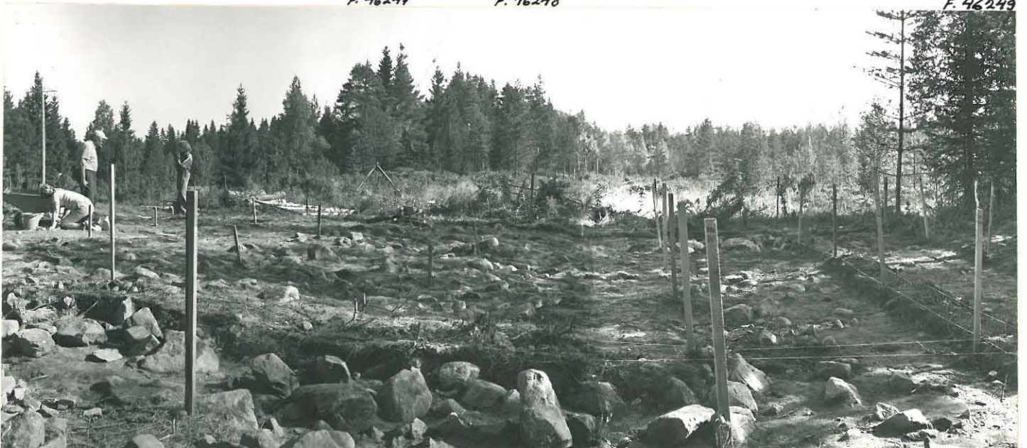
10. RUUDUT 284302-284308 , 286 302-286 308 , 288 302-288 308 290 302-290 308. T A S O 1 . KUVATTU LOUNAALSTA.