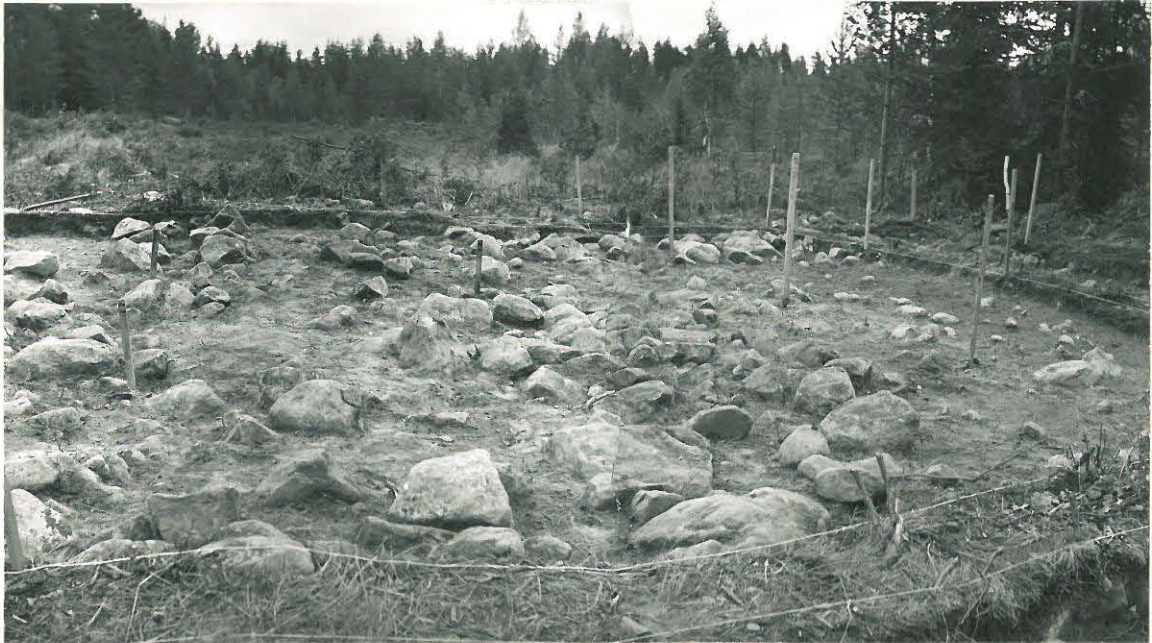
11. RUUDUT 284 302-284 308, 286 302-286 308, 288 302 - 288 308. TASO 2 KUVATTU LOUNAASTA.