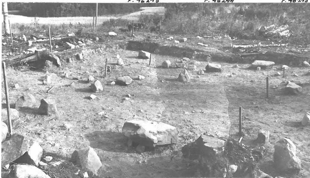
7. TYÖKUVA KUVATTU ETELÄSTÄ