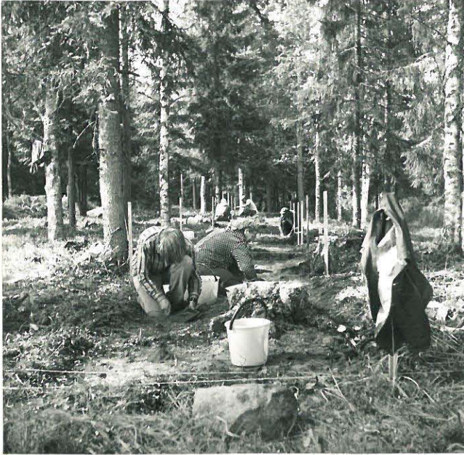
TYÖKUVA RUUDUT 300302 JA 300304 KUVATTU KOILLISESTA.