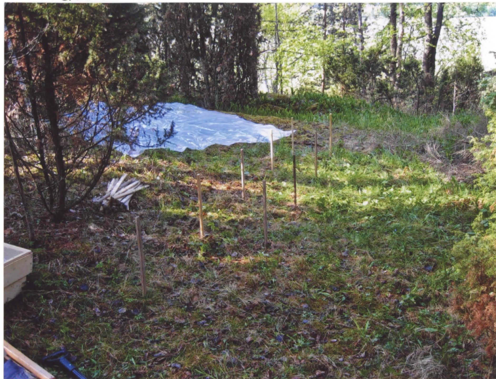
K.1. KAIVAUSALUE PAALUTETTUNA. KUVA LUOTTEESTA.