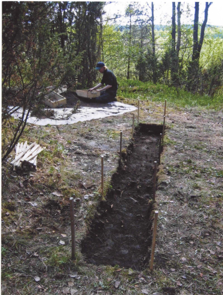
KUVA 4. D. 668.

HUMUKSEN JA HIESUN RAJA. KUVA POHJOISESTA.