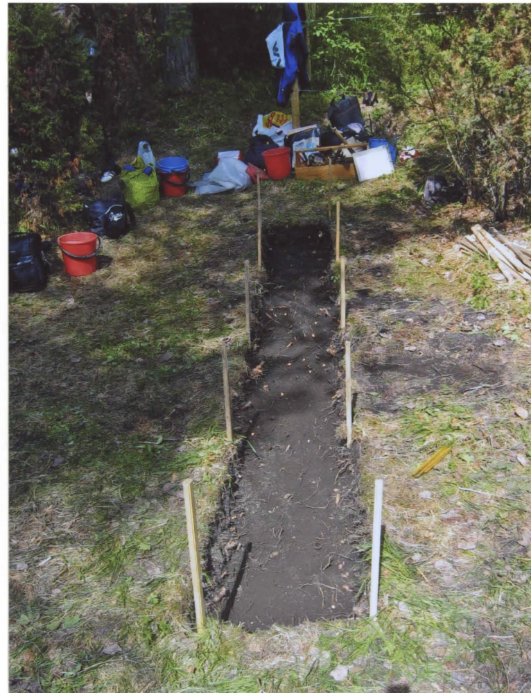
KUVA 5. D. 669.

HUMUKSEN JA HIESUN RAJA. KUVA POHJOISESTA.