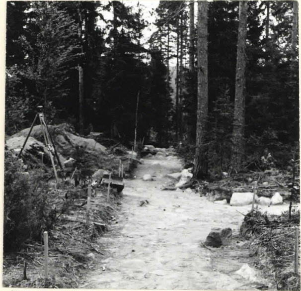
F. 39344. KAIVAUSALUEEN ITÄREUNAAN AVATTIIN KOEJOJA 15 PÖHJOIS-ETELÄ-SUUNNASSA. KUVA PÖHJOISESTA.