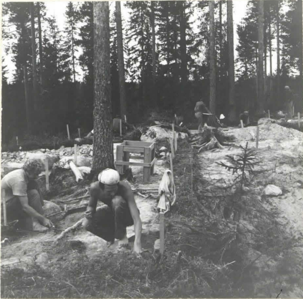
F. 39345. KAIVAUSALUEEN ITÄPÄÄTÄ. KESKELLE ON JÄTETTY PROFILIVALLI. KUVA IDÄSTÄ.