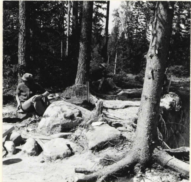
F. 39346. MYÖS KAIVAUSALUEEN LÄNSIPÄÄHÄN AVAT- TIIN LYHYT KOEJOJA 10 PÖHJOIS-ETELÄ-SUUN- NASSA. KUVA PÖHJOISESTA.