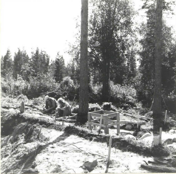
F. 39343. KAIVAUSALUEEN ITÄISIMPIÄ RUUTUJA KAIVETAAN HIEKKAKUOPAN REUNALLA. KUVA LÄNNESTÄ.