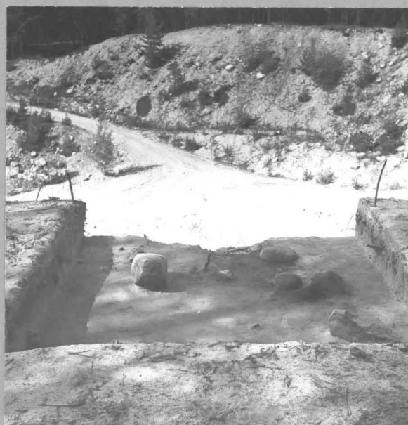
f. 58094 punamultahauta tasossa 3 = 30 cm, idästä