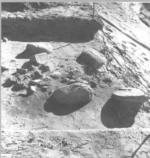
f. 58089 punamultahauta tasossa 2 = 20 cm, koillisesta