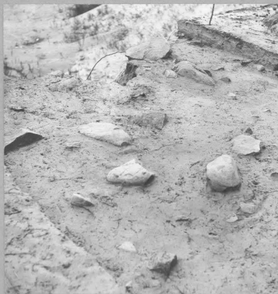
f. 58086 punamultahauta tasossa 1½ = 15cm, kaakosta