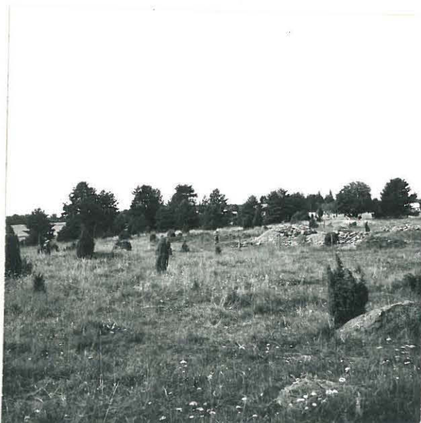
MYLLYMÄKI, KUVA ETELÄSTÄ