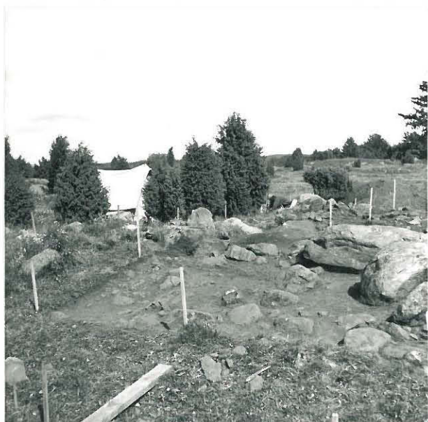
KAIVAUSALUEEN POHJOISPÄÄ LÄNNESTÄ. 2. KERROS