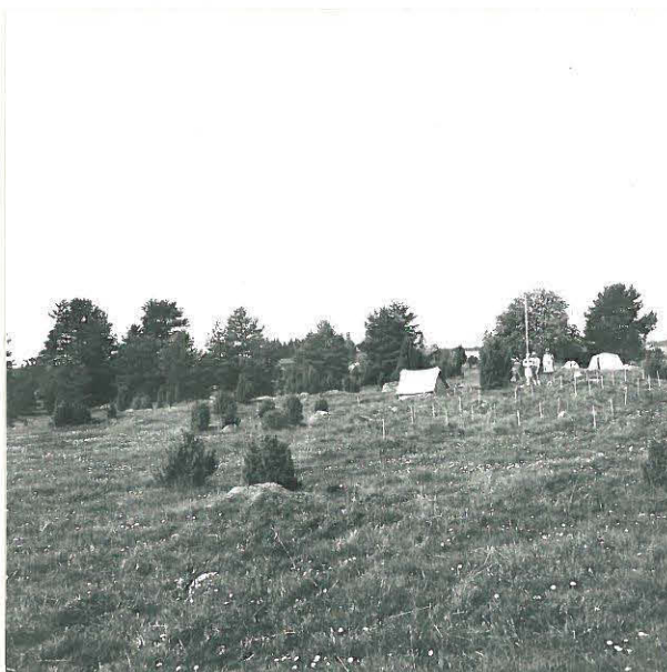
LINJOJEN MITTAUSTA. KUVA IDÄSTÄ