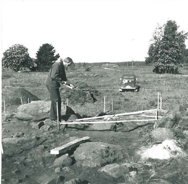
RUUTUA 507-105 PIIRRETÄÄN. KUVA KOILLISESTA 2. TASO