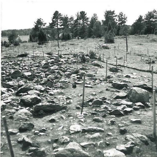
KAIVAUSALUE POHJOISESTA. 2.KERROS