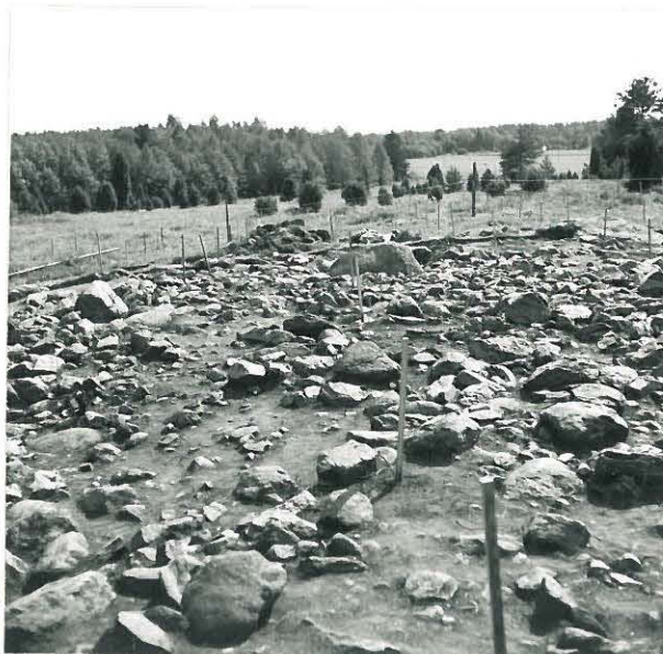
KAIVAUSALUE POHJOISESTA. 2.KERROS