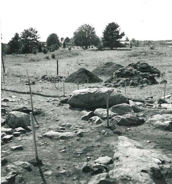
KAIVAUSALUEEN LÄNSIREUNAA. 2.KERROS