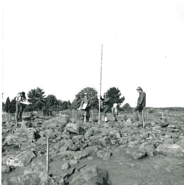
2. TASOA VAAITAAN . KUVATTU IDÄSTÄ