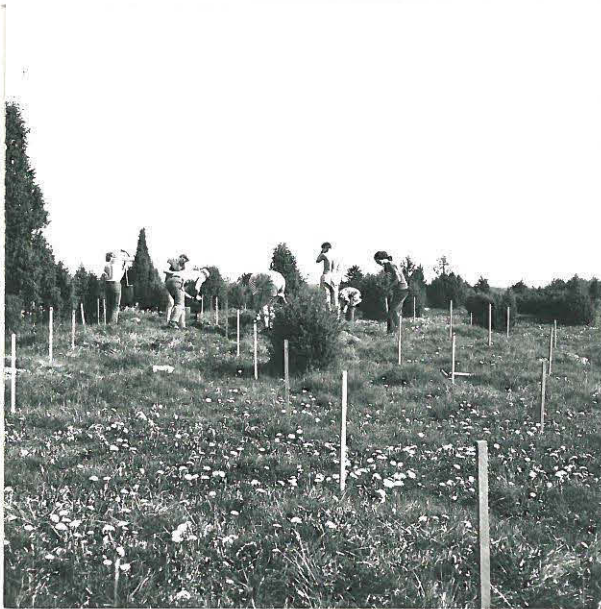
TURVETTA POISTETAAN KAIVAUSALUEELTA KUVA ETELÄSTÄ