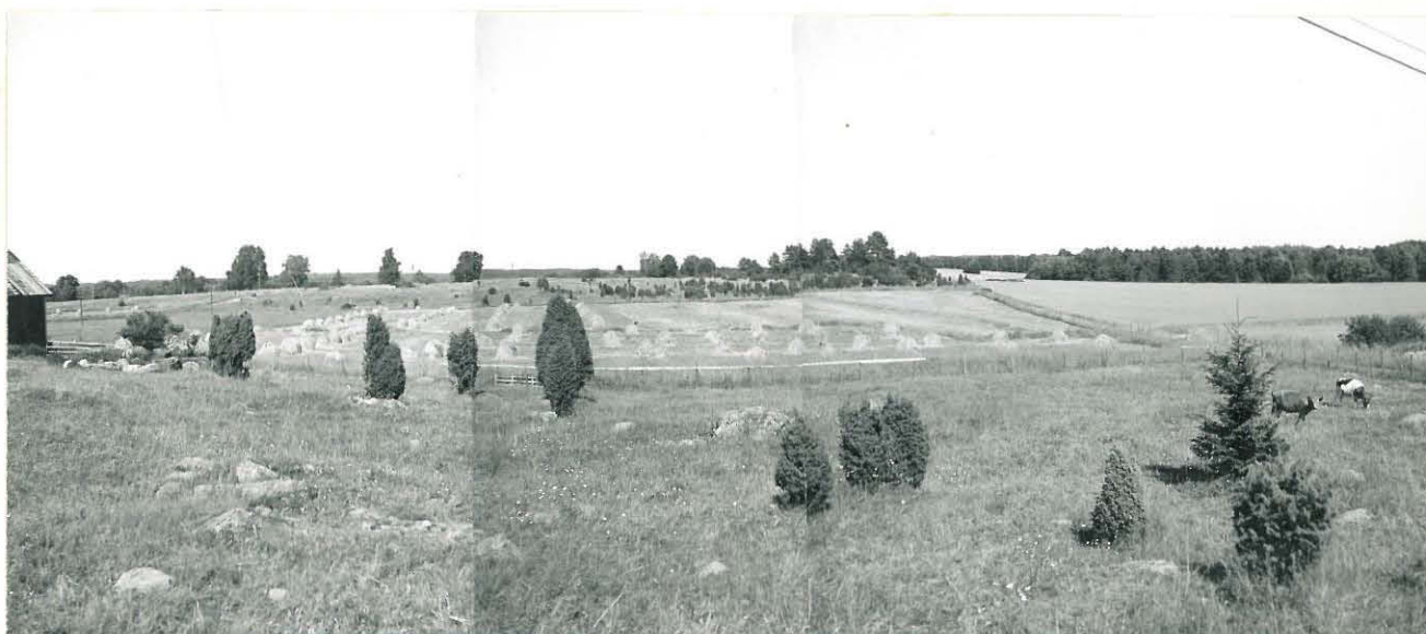
PANORAAMA KUVA LOUNAASTA MYLLYMÄELLE