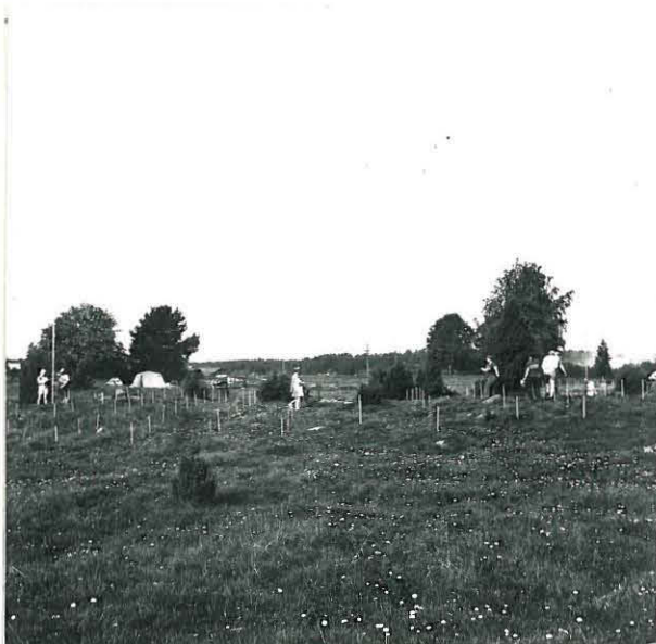
LINJOJEN MITTAUSTA . KUVA IDÄSTÄ