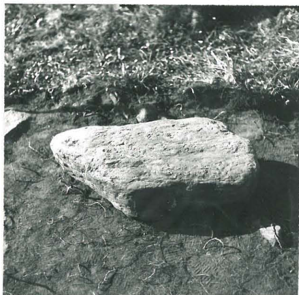
KIVI RUUDUSSA 506-108 . 2. TASO