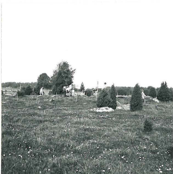
I. KERROSTA KAIVETAAN . KUVA KAAKOSTA