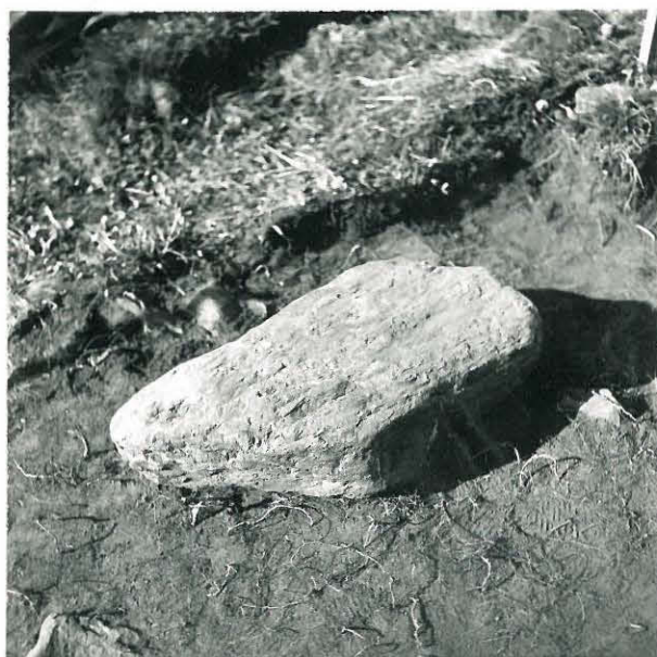
KIVI RUUDUSSA 506-108 . 2. TASO