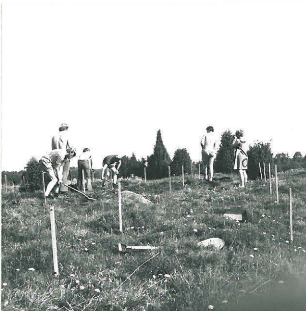
TURVETTA POISTETAAN KAIVAUSALUEELTA KUVA ETELÄSTÄ