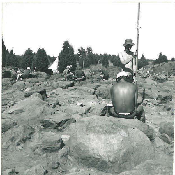
KAIVUSALUEEN ETELÄOSA, 6. TASO, KUVA ETELÄLOUNAASTA