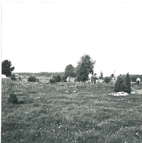
I. KERROSTA KAIVETAAN . KUVA KAAKOSTA