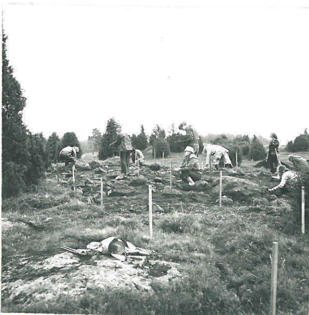
PERUSLINJAN VAAITUS. KUVA IDÄSTÄ