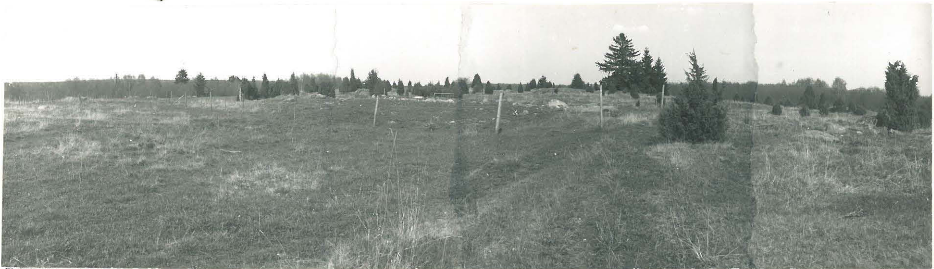
MYLLYMÄEN KUMPARE 152 ENNEN KAIVAUKSEN ALOITTAMISTA V. 1976. KUVA ETELÄSTÄ.