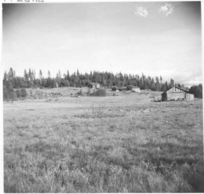
1. Harju lännessä