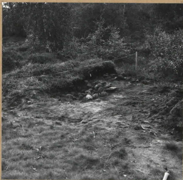
Kuva 7. Kohteesta pintakasvillisuus osit- tain poistettuna. Kuva koillisesta. ( f. 55399 ).