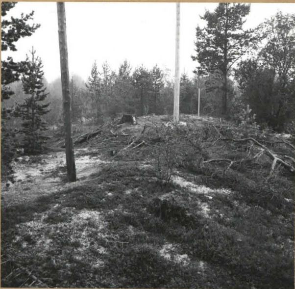
Kuva 2 ( f. 55393 ). Kaivausalue kaakosta. Paras löytökohta on kumpareella kannon ja taaemman sähköpylvään luona.