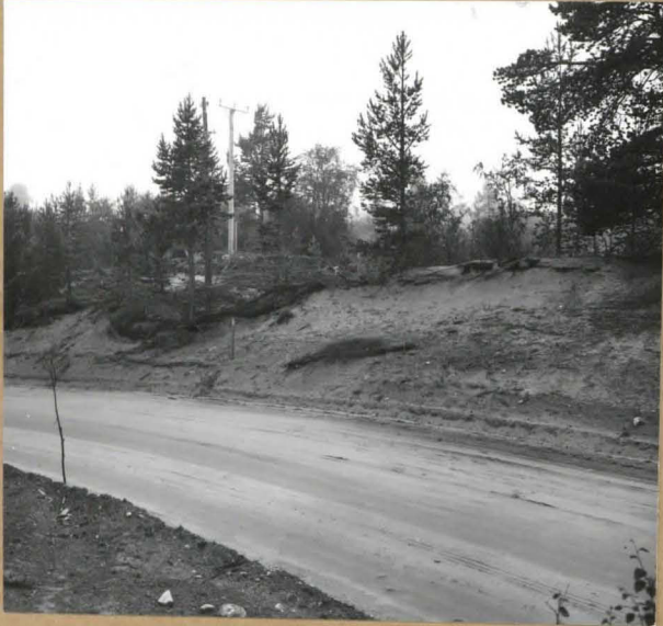
Kuva 1 ( f. 55392 ). Kaivauspaikka idästä yli Kaamanen - Norjan raja -maantien. Taaempi sähköpylväs on kaivausalueella ruudussa 104/114.