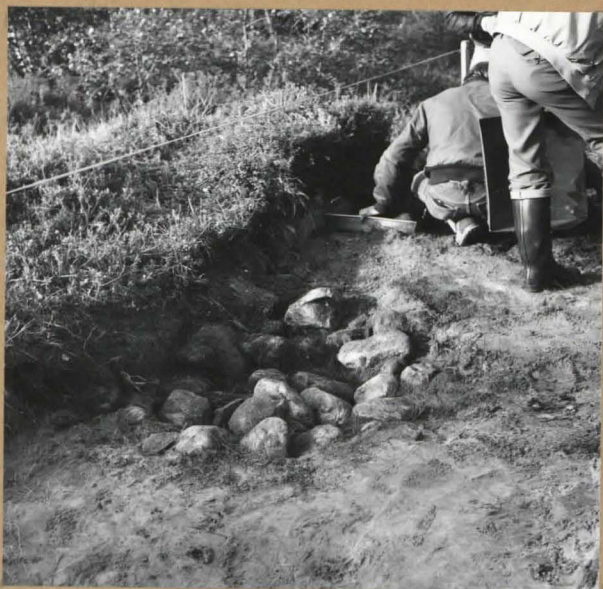
Kuva 8. Kohteen keskiosan kiveystä koillisesta. ( f. 55400 )