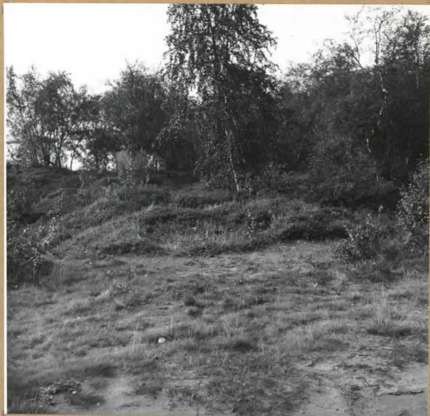
Kuva 6. K ohde ennen kaivausta osittain tasoitettuna. Taustalla näkyy Partakon- selkä. Kuva pohjoisesta. ( f. 55398 )