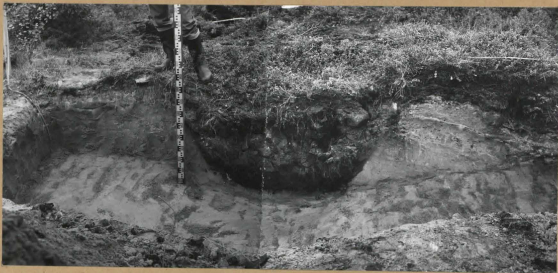
Kuva 9. Kohteen laikkaus luoteesta. Kivillä täytetyn kuopan alimmassa osassa on paksu hiilikerros. ( f. 55401-402 )