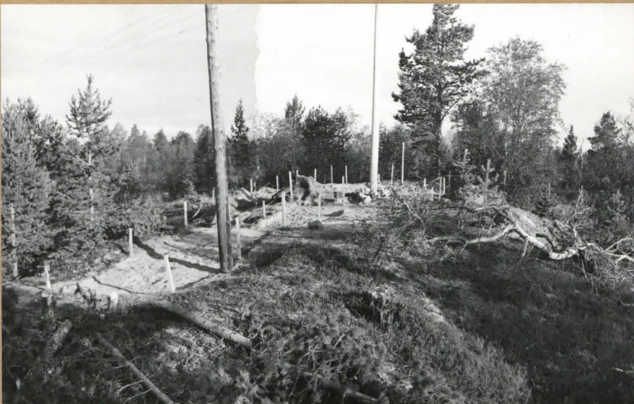
Kuva 3 ( f. 55394-395 ). Kaivausalue kaakosta. Lähimpänä linja 100 pohjaan kaivettuna.