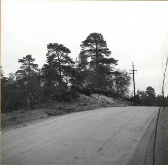
Kuva 4 ( f. 55396 ). Kaivauspaikka lounaasta Kaamanen - Norjan raja -tieltä. N - S -suuntainen koekaista on harjun laella alkaen lähinnä tietä olevan petäjän luota. Koekuoppia tehtiin poikki harjun maantien suunnassa lähelle tieleikkauksen reunaa.