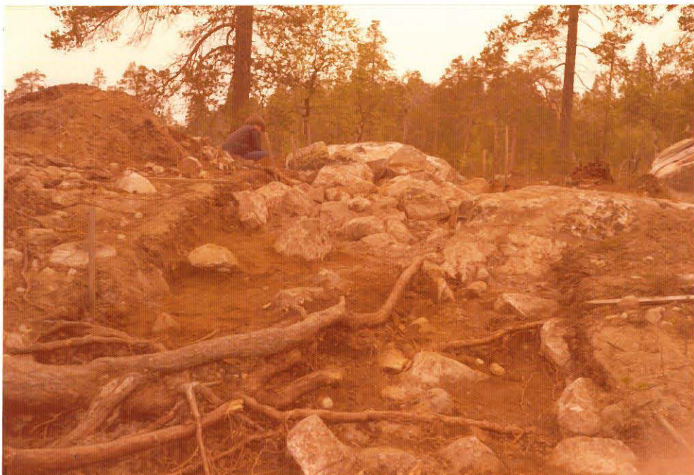
linja I tasossa 2. kuva kaakosta.