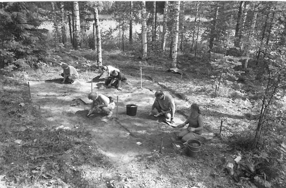
3. 1. kaivauskerroksen tutkimus meneillään pääosin Päijät-Hämeen harrastaja-arkeologien voimin. Kuva lännestä. Taustalla Pukkisaaren mantereesta erottava kapea salmi.