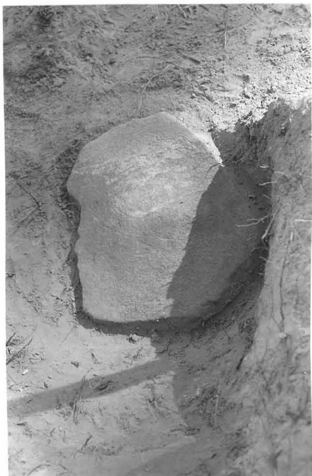
8. Miltei ehjä kiertäen hangattu hoinlaaka löytyi asuinpaikan pohjakerroksesta.