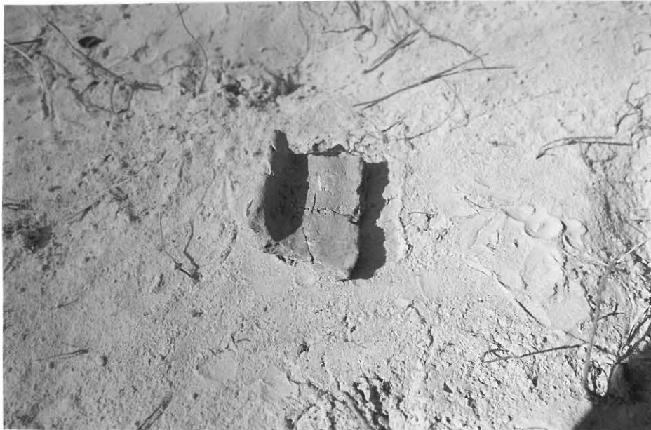
5. Tämän Pöljän keramiikan reunapalan löytyminen selvitti koekuopasta viime vuonna saadun asbestikeramiikan tyyppin identifioinnin ja osoitti, että koko asuinpaikka on myöhäis-neoliittinen.