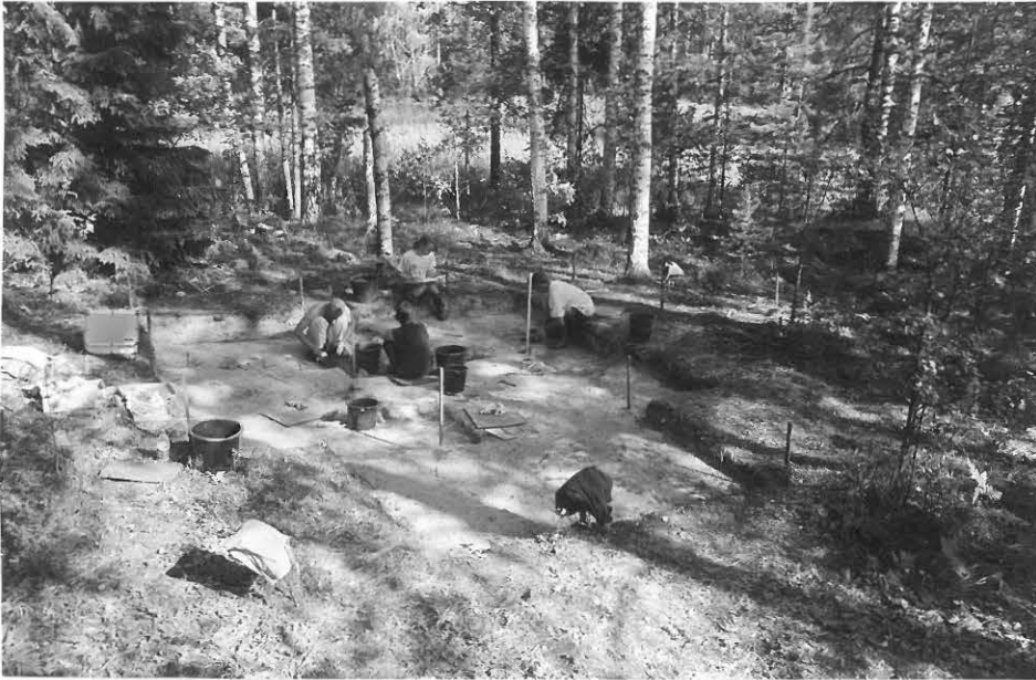
4. Kaivauksessa on edetty jo 2.kerrokseen, jossa löydöt varsinaisesti alkoivat. Hieno hiekka on edelleen miltei täysin kivetöntä. Kuva lännestä.