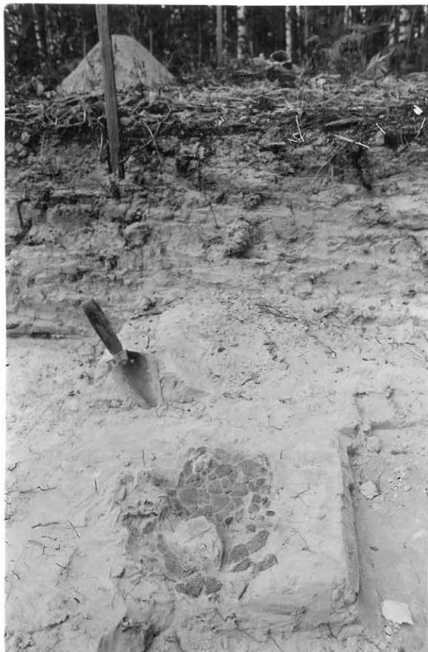
7. Alimmasta kaivauskerroksesta löytyi Pöljän astian pohjaosa, joka otettiin talteen leikkaamalla se irti hiekasta.