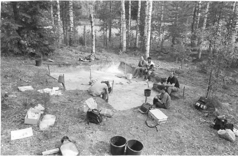
9. Kaivaus loppuvaiheessaan. Löydöt loppuivat n, 35 - 40 cm:n syvyydessä. Asuinpaikan kulttuurikerros jatkuu melko rikkaana itään ja pohjoiseen päin. Kuva luoteesta.