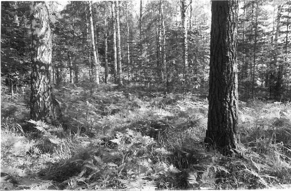
1. Asuinpaikka sijaitsee Pukkisaaren eteläpäässä loivasti etelään viettävällä rinteellä, jonka maaperä on puhdasta hiekkaa. Kaivausalue, ns. kodanpohja, on kuvan keskellä olevalla aukealla. Taustalla Huhdasjärveä. Kuva luoteesta.