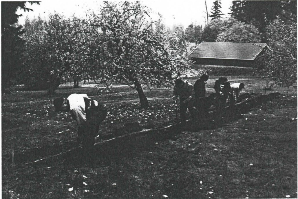
KUVA 2. KOEJAA KAIVETAAN. KUVA PÖHJOISKOILLISESTA.