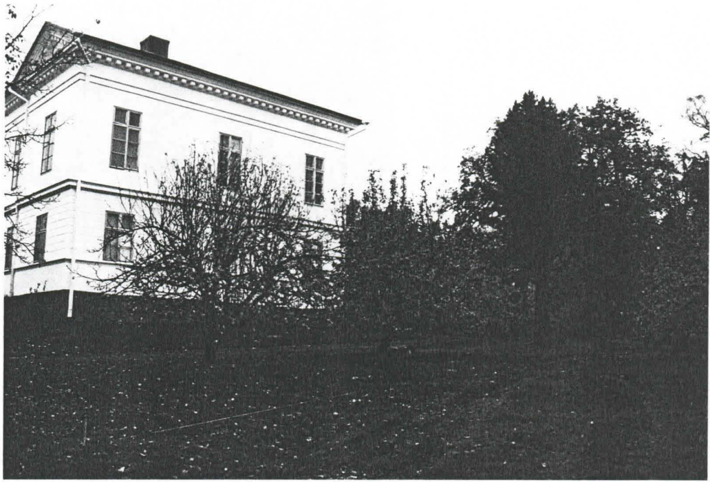
KUVA 1. KOEJAA LINJATAAN JOKIOISTEN KARTANON ENTISEEN HEDELMÄTARHAAN. KUVA ETELÄSTÄ.