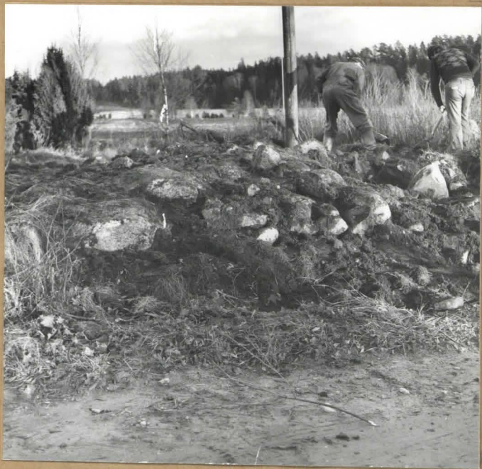
Röykkiöstä on turve poistettu.