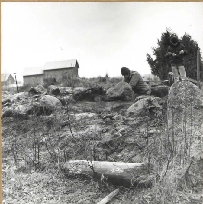
Röykkiö puoleksi kaivettuna.