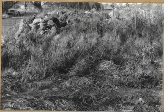
Röykkiö ennen kaivausta.