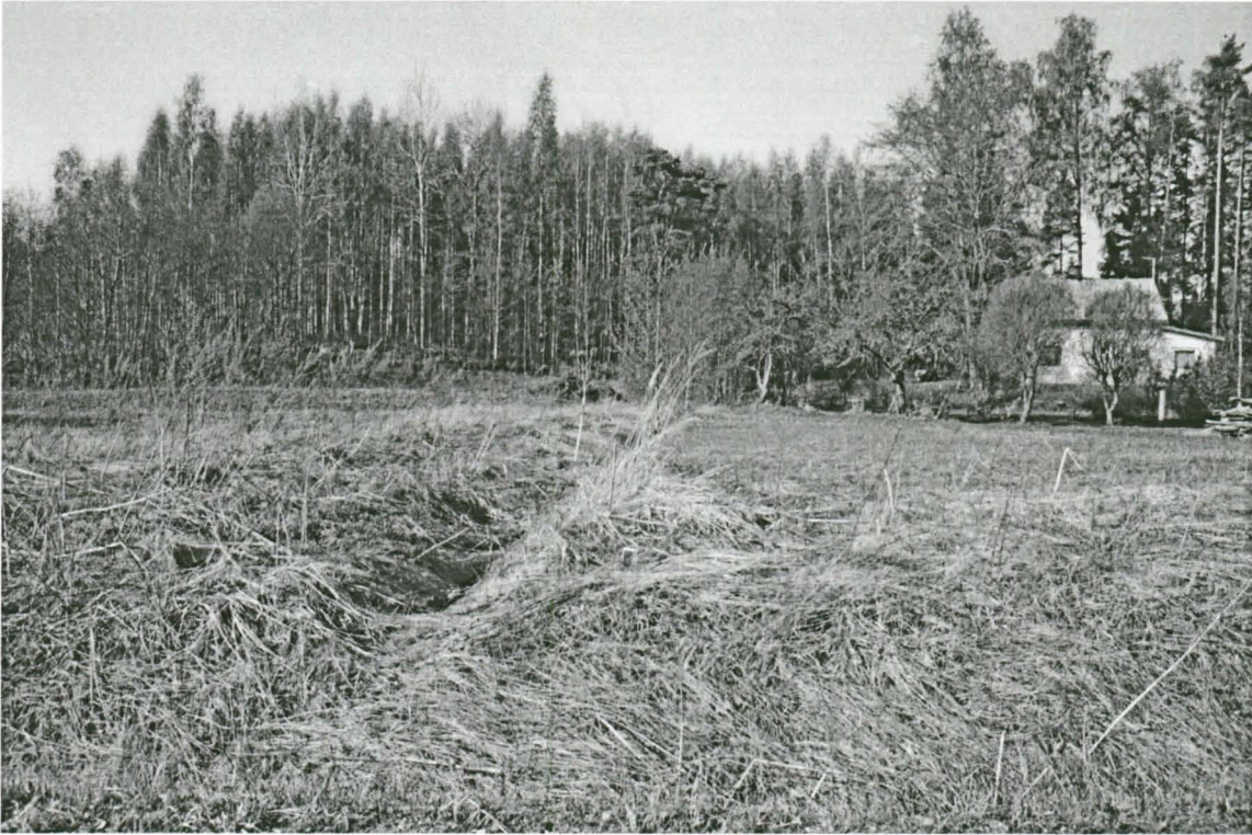
Koivikon asuinpaikka sijaitsee talosta vasemmalla olevassa metsikössä ja sen edessä olevan pellon yläosassa. NE-SW.