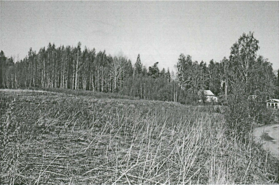
Koivikon asuinpaikka toiselta suunnalta. Oikealla näkyy Peltolantietä. E-W.