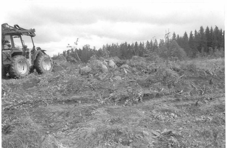
f 122686