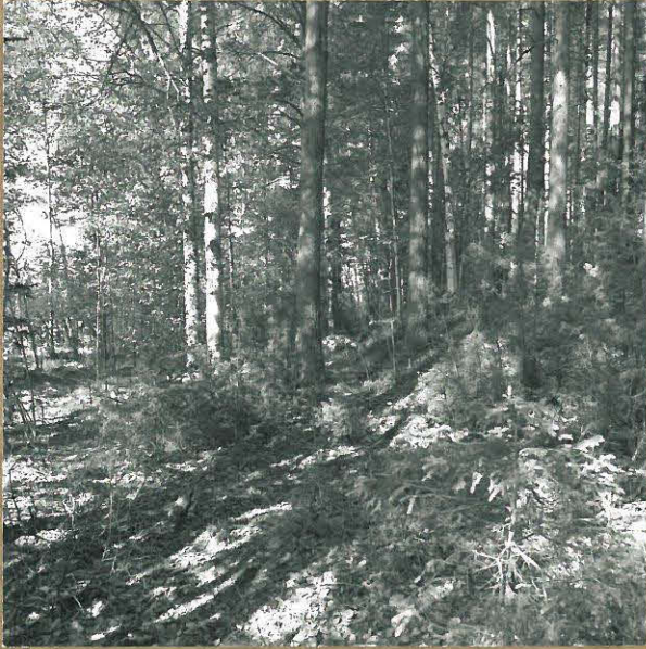
KUVA 1. KEURUSSELÄN RANTATASANNE JA TÖRMÄ, KUVATTU IDÄSTÄ.