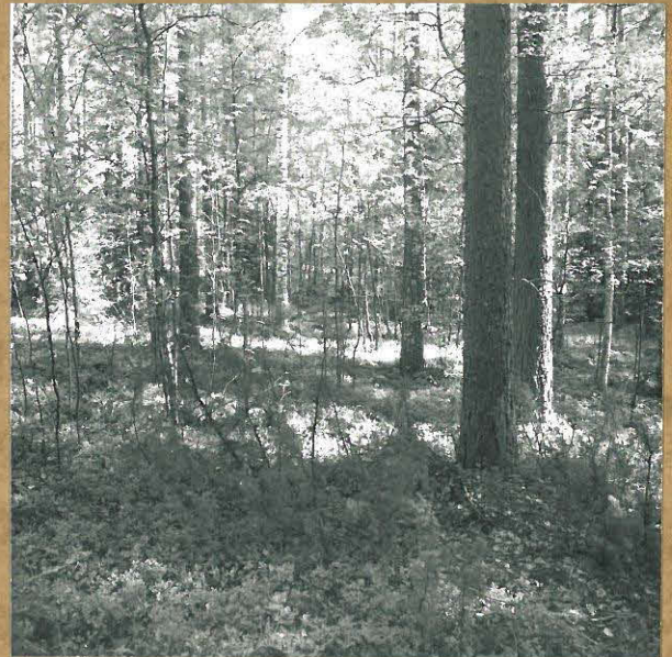
KUVA 6. TUTKIMUSALUEEN ITÄOSAN ALAVA KOESTUKKO, KUVATTU LOUNAASTA.