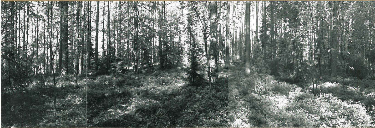
KUVAT 2-5. PANORAMAKUVA KAIVAUSSALUEEN KESKIKOHDESTA, KUVATTU IDÄSTÄ JA KAAKOSTA.