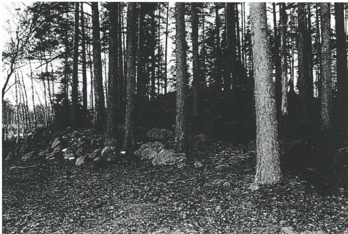
Kuva 3 Alueen 2 luoteiskulman louhikkoalue kuvattuna etelästä