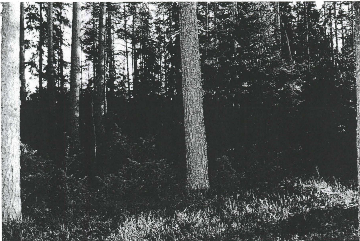
Kuva 5 Rehevä koekuoppa-alue kuvattuna lännestä