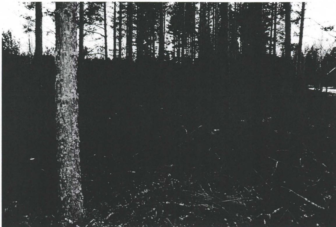
Kuva 1. Alueen 1 länsireuna kuvattuna pohjoisesta Joensivun asuinpaikan suunnalta.

Vesijättöalueen itä- ja kaakkoispuolelle tehtiin korkeuskäyrän 132 m mpy lähistölle lapionpistoja noin kymmenen metrin välein. Alue oli hyvin kivikkoista. Täältäkin alueelta ei löytynyt viitteitä esihistoriallisesta asutuksesta. Tämän alueen eteläpuolella oli ilmeisesti metsitetty pelto, jossa oli oja. Tälle alueelle ei tehty lapionpistoja. Lapionpistoja ei tehty myöskään alueen 1 aivan itäosan ”kolmioon”. Se oli mäntykangasmetsää ja topografisesti hyvin epätodennäköinen paikka kivikautiselle asutukselle.