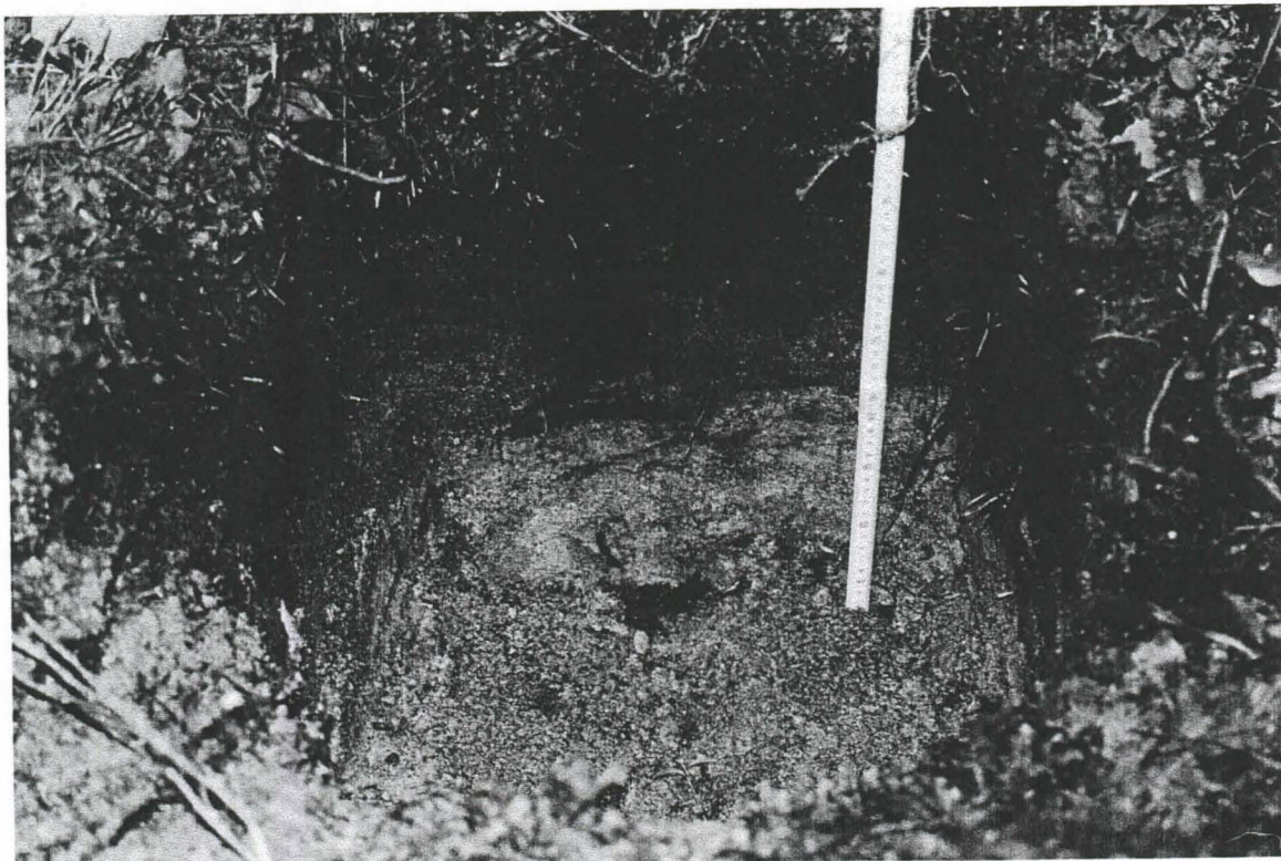
Kuva 4. Hiilinen koekuoppa 6

Koekuoppa-alueella oli runsaasti hiiltä heti turpeen alla muutaman sentin paksuudelta. Paikoitellen hiiltä oli todella paljon (esim. koekuoppa 6.). Kuoppien 1-2, 6-7 ja 9 alueella oli rehevämpi kasvillisuus kuin ympäristössä (ks. negat. 132673- 132674). Männyt olivat isompia ja aluskasvillisuus rehevämpi kuin ympäristössä. Aluspuina oli runsaasti kuusia ja katajia. Paikoitellen alueen maannos muistutti lehtomaisen metsän maannosta. Alimpana oli kuitenkin puhdas hiekka.