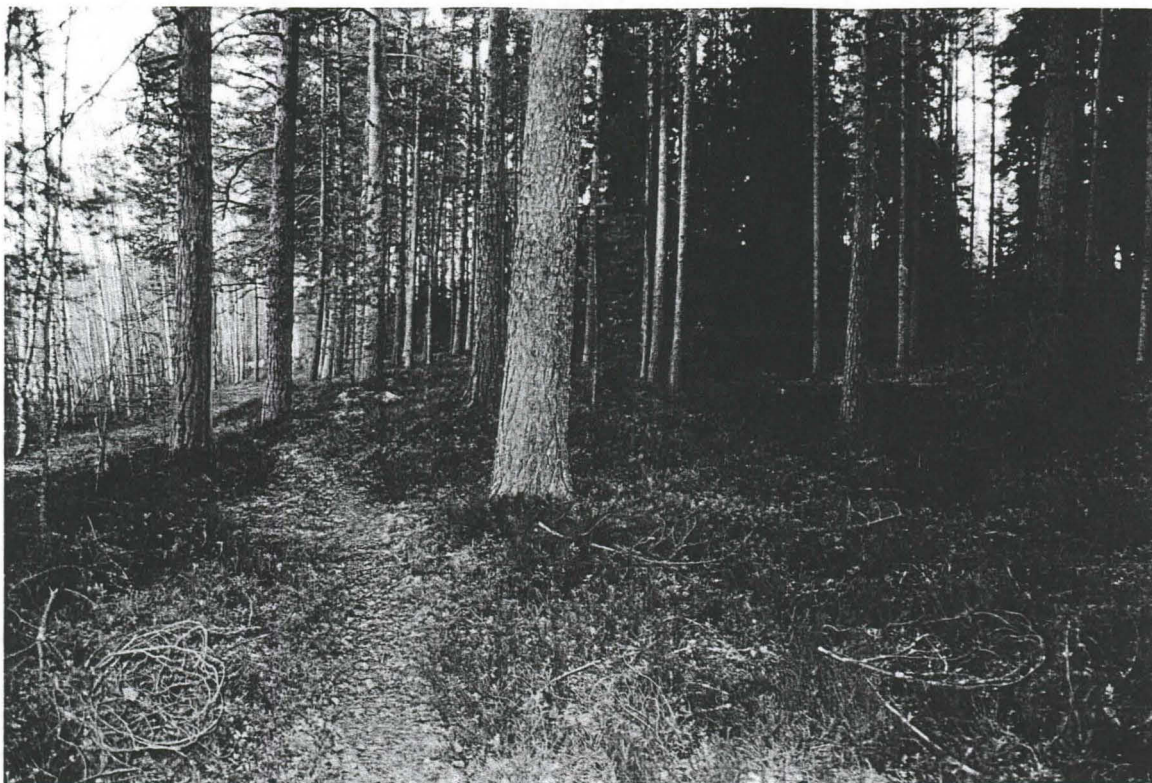
Kuva 2. Alueen 2 länsireuna kuvattuna Leirikeskuksen asuinpaikan suunnalta