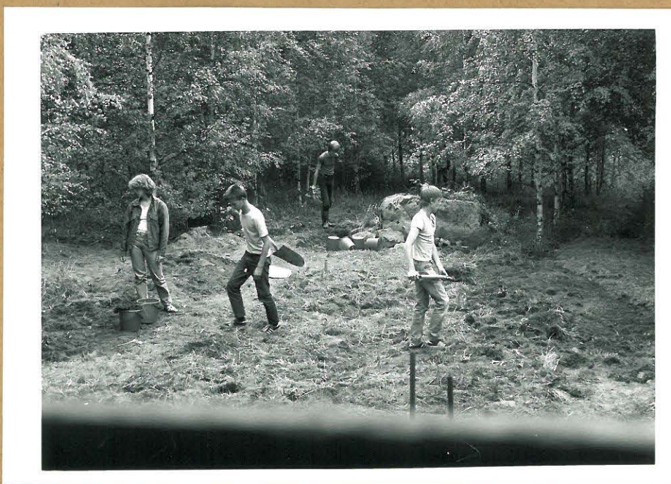
Kuva 1 Yleiskuva kaivausalueesta