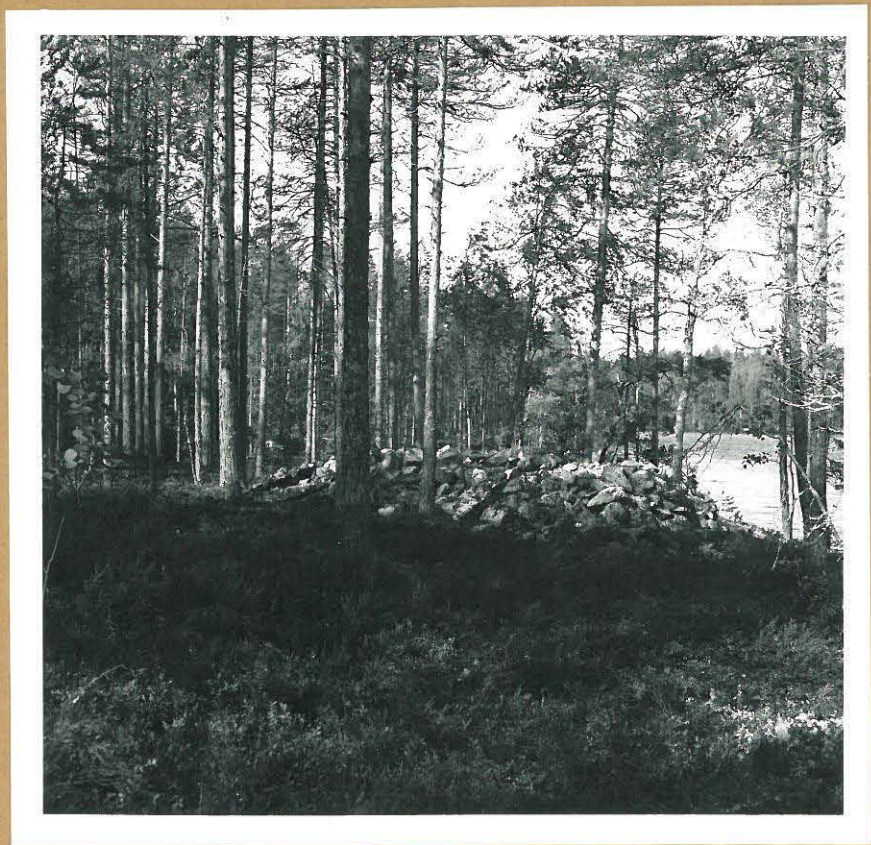
Konginkankaan Pyhänsalon hautaröykkiön muurikehää kaivauksen paljastamana.