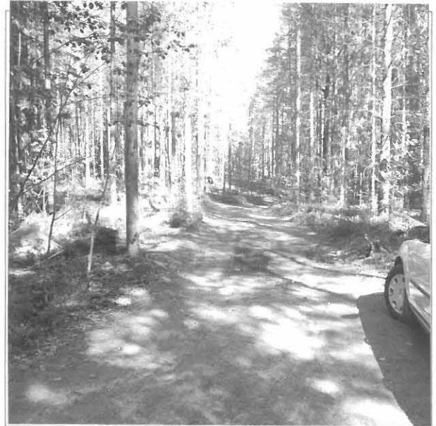
Kuva 2/F. 140827

Yleiskuva tutkimusalueesta, vasemmalla Pöykyn tielle johtava maantie, kuvattu kaakosta.