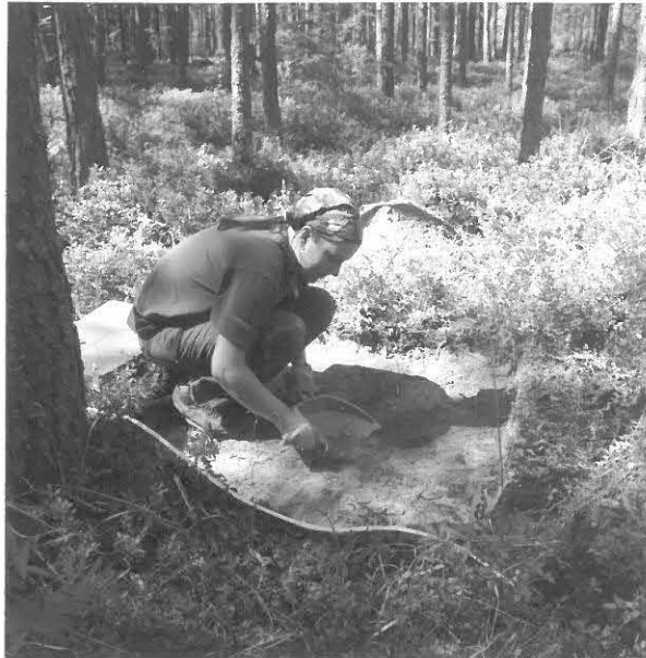
Kuva 9/F. 140834

Marjo Vanhala kaivaa koekuoppaa 7, taustalla Pöykynlampi, kuvattu kaakosta.