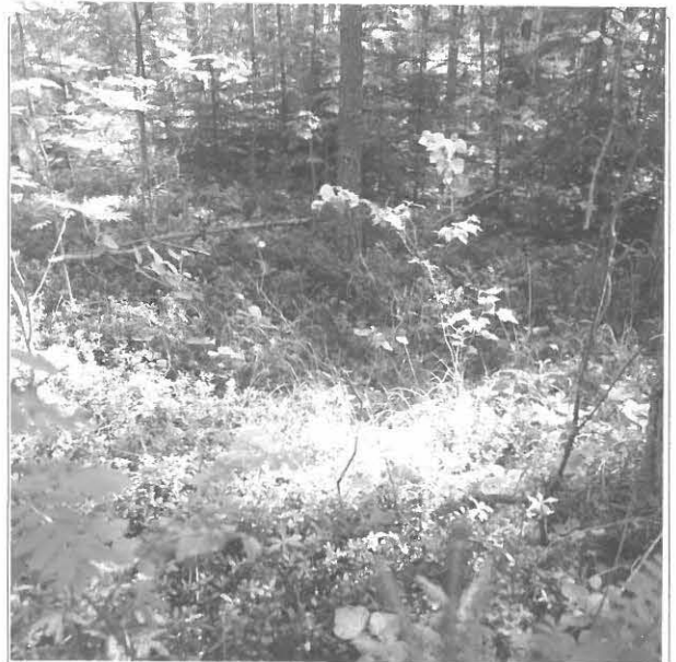
Kuva 4/F. 140829

Yleiskuva tutkimusalueesta, kuvassa uimarannalle johtava tie, jolta on löytynyt kvartseja (KM 35334, Johanna Seppä inv. 2005), kuvattu luoteesta.