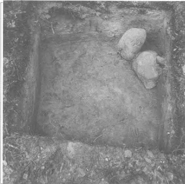
Kuva 5/F. 140830 Koekuopan 1 pohjoisnurkassa näkyi muinaista rantakivikkoa, kuvattu kaakosta.