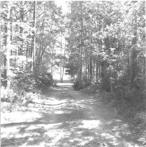
Kuva 3/F. 140828

Yleiskuva tutkimusalueesta, keskellä kesämökeille johtava tie, kuvattu lounaasta.