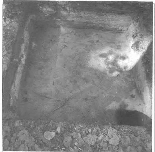
Kuva 6/F. 140831 Koekuopan 2 profiilissa näkyi kaksoisturve, kuvattu kaakosta.