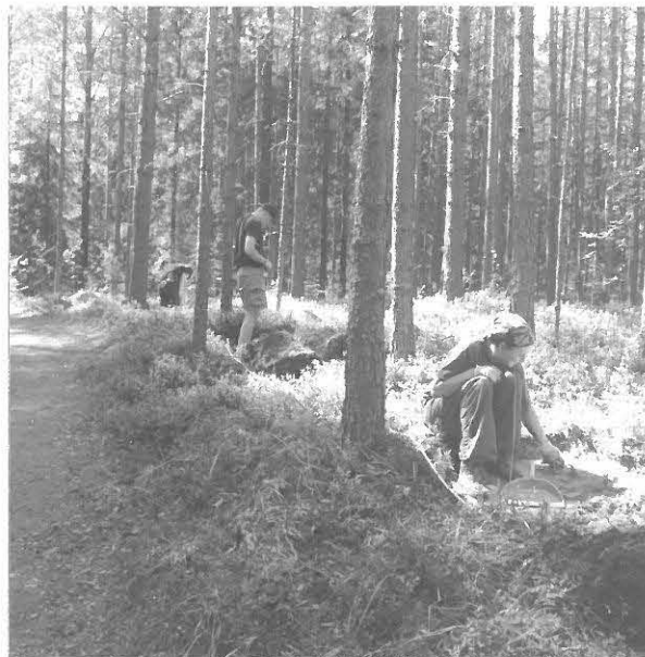
Kuva 10/F. 140835

Marjo Vanhala kaivaa koekuoppaa 7, taustalla Pöykynlampi, kuvattu kaakosta.