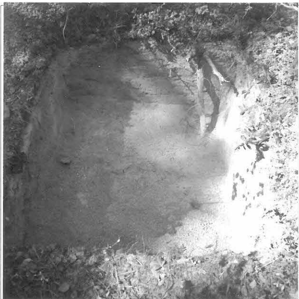
Kuva 7/F. 140832 Koekuopan 4 kaakkoisosassa oli kiilamainen harmaan, rakeisen hiekan alue, kuvattu kaakosta.